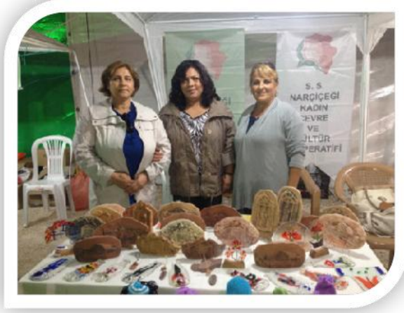
Şekil 2. Nar Çiçeği Kadın Kooperatifi Üyeleri