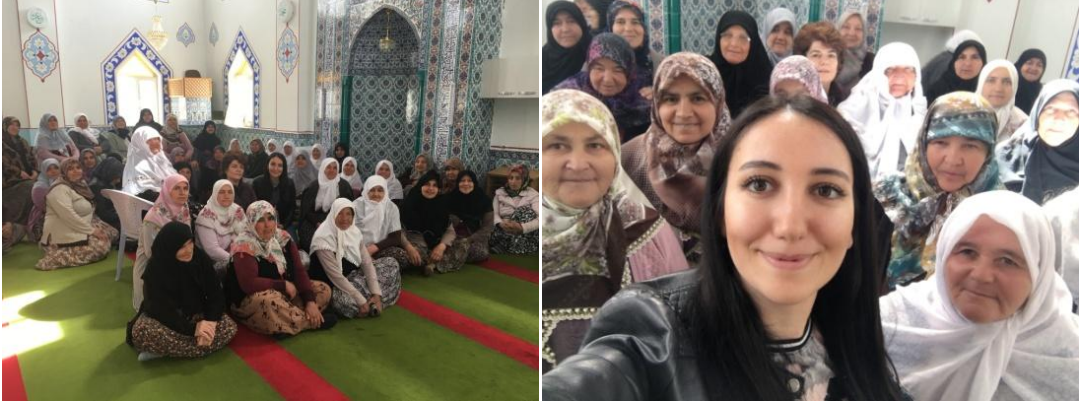
Şekil 15. Karaören Camisi'nde Kadınlar İle Buluşma

İkinci Ziyaret: Karaören muhtarının duyarlılığı çerçevesinde, kadınlara mahalle camisinin hopörleri ile duyuru yapılmıştır. Ziyaretimiz sırasında cami de Kuran Kursu'nda olan kadınlarımız kurslarını yarıda keserek bizi dinlemek için toplandılar ve çok dikkatli bir şekilde anlattıklarımızı dinlediler.