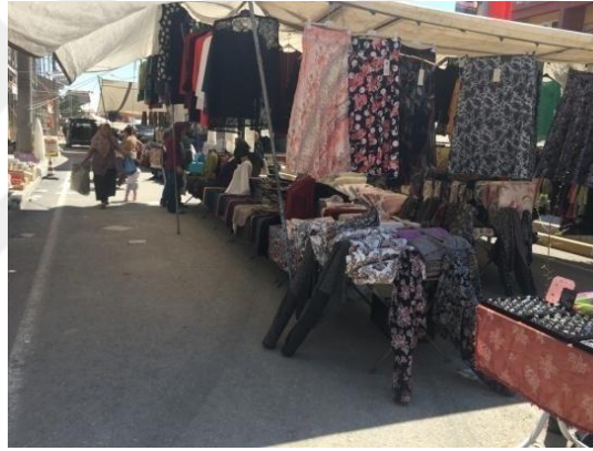
Şekil 11. Beylikova İlçe Pazarından Bir Görüntü

İkinci ziyaret: Beylikova İlçesinde kadınlarla yapmış olduğumuz sohbeti her hafta Salı günü kurulan ilçe pazarının olduğu gün gerçekleştirdik. Buradaki amacımız daha fazla üretici kadına ulaşmaktı. Pazarda görüştüğümüz kadınlardan öğrendiğimiz bilgiler ışığında, Eskişehir’de kurulan pazarlara da gitmek istediklerini ama pazar yeri kirası ve ulaşımın maliyetinin yüksek olması sebebi ile gidemediklerini ve bu pazara geldiklerini söylediler.