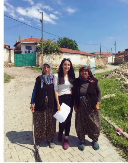
Şekil 12. Cevizli Mahallesi Kadınları

İkinci ziyaret: Cevizli kadınları ile buluşabilmek için çalıştıkları tarlayı ziyaret ettik ve sohbetimizi gerçekleştirdik. Çalışma saatlerinde oldukları için işlerine çok engel olmamak için on-on beş dakika gibi çok kısa bir süre içerisinde görüşmemizi tamamladık. Buradaki kadınlar tarafından;