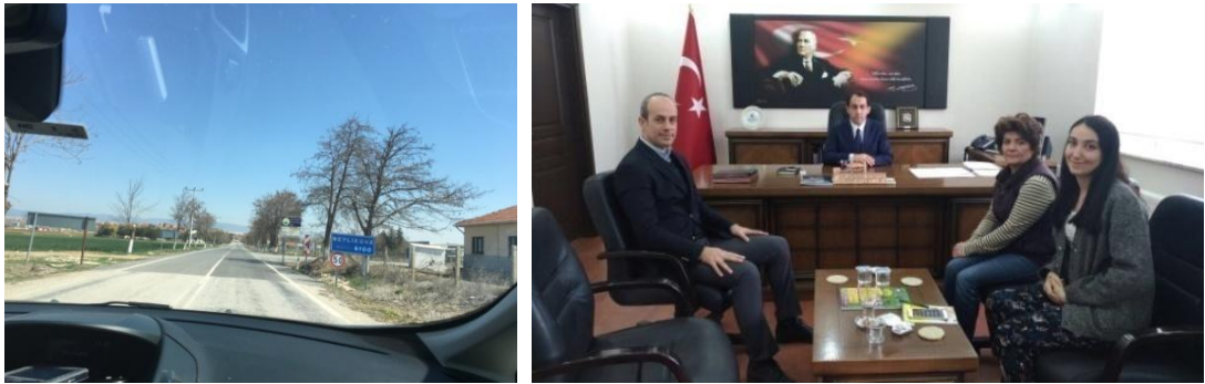
Şekil 10. Beylikova Kaymakamlığına Yapılmış Olan Ziyaret

Birinci Ziyaret: Beylikova İlçesinin kaymakamından randevu alınarak ilk ziyaret gerçekleştirilmiştir. İlçenin kaymakamı bizi güler yüzle karşılayıp, ilgili bir şekilde bizi dinlemiş ve çalışmamıza elinden geldiğince destek olacağını söylemiştir.