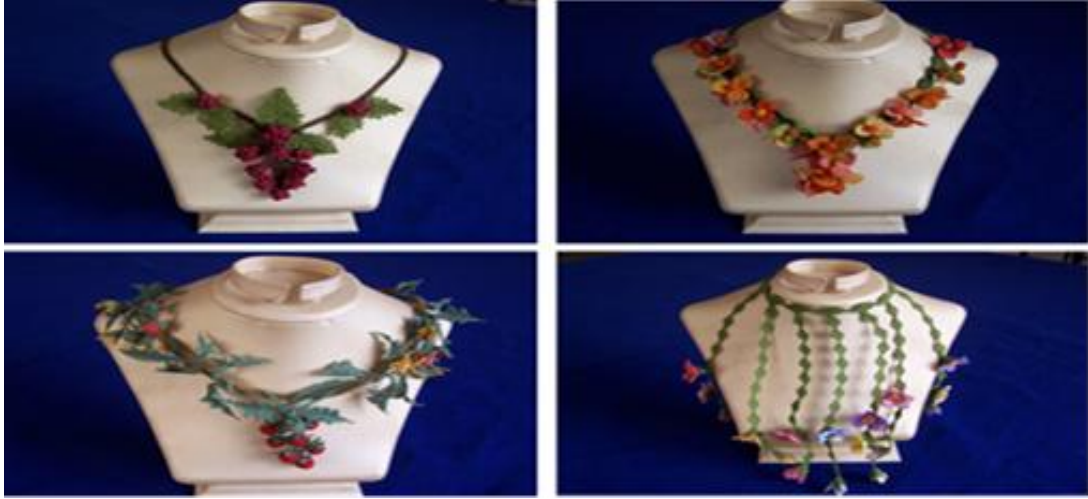
Şekil 1. Nal-Etik Kadın Kooperatifine Özgü İğne Oyaları Motifi