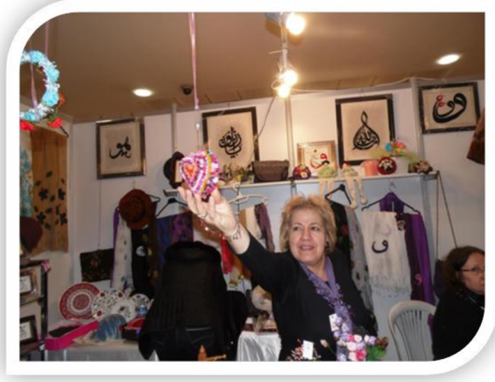
Şekil 4. Kimya Hatun Kadın, Çevre Kültür ve İşletme Kooperatifi