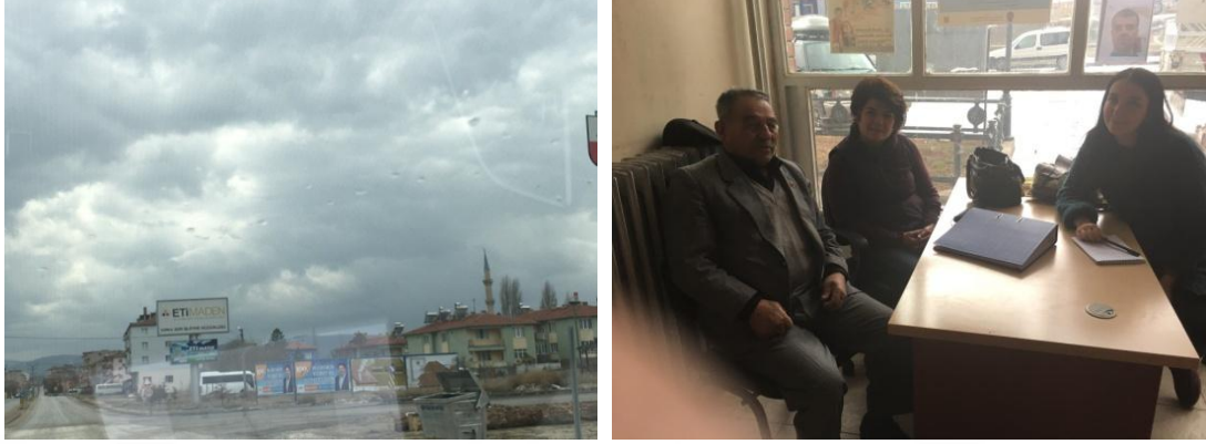
Şekil 14. Kırka Mahallesi Muhtarı ile Yapılan Görüşme

süredir muhtarlık yapan ve belli bir yaşın üzerinde olan Kırka Mahallesi muhtarına bizim projemiz pek cazip gelmemiştir. Projenin amacı anlatılıp, kadınlara nasıl ulaşılabileceğimizi sorduğumuzda bize yol gösterecek cevaplar alamadık.