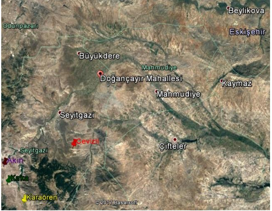
Şekil 8. Eskişehir İlinin İlçe ve Mahalle Haritası