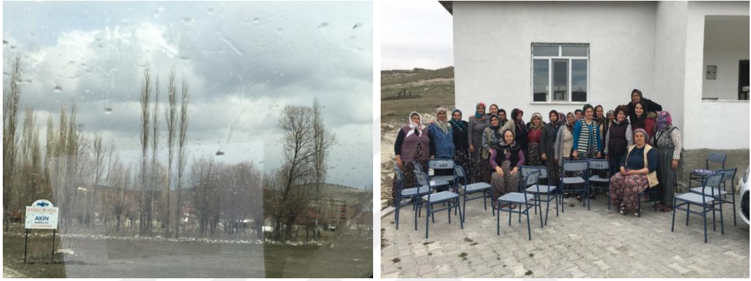
Şekil 9. Akin Mahallesi Kadınları İle Yapılan Sohbet Görüntüleri

Birinci Ziyaret: Mahallenin muhtarı güler yüzle bir şekilde karşılayıp, ilgili bir şekilde davranmıştır. Mahalle kahvesinde muhtar ve erkekler ile sohbet edilmiştir. Projenin amacı anlatılıp, kadınlara nasıl ulaşılabileceği sorulmuştur ve randevu alınmıştır.