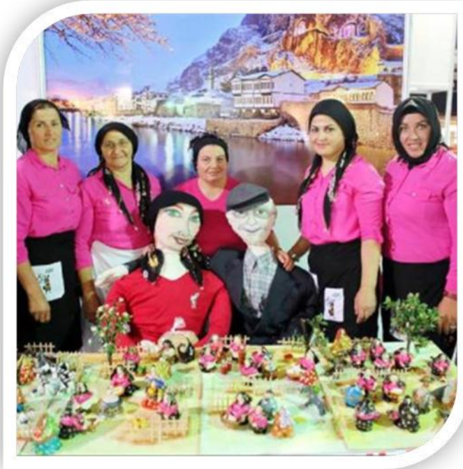
Şekil 3. Amesia Çalışan Arılar Kooperatifine Üye Kadınlar

Çalışkan araştırmasında bu kadın kooperatifini; “kadınlar bir araya gelerek uyumlu ve sistematik bir şekilde ürettikleri doğal köy ürünlerini, kooperatifler aracılığıyla pazarlamak, ev ekonomisine katkıda bulunmak, kendilerini aile içerisinde ifade etmek ve köyden kente göçü bir nebze olsun engellemek amaçları ile arı gibi çalışmaya devam etmektedirler. Eş ve toplum baskısı ile bir süre mücadele ediyorlar. İzin vermeyen eşler, ikna olmayan kaynanalar, tanıdık akraba ve komşulardan sonra ısrarla başarıya ulaşıyorlar ve kendilerini kabul ettiriyorlar. Ve bu mücadelenin sonrasında ise; aile ekonomisine katkı sağlayan, çocuğunun eğitimine destek veren, kendi ihtiyaçlarına çare olan, kırsal toprakların rol modeli oluveriyorlar” şeklinde ifade etmiştir (Çalışkan, 2016).