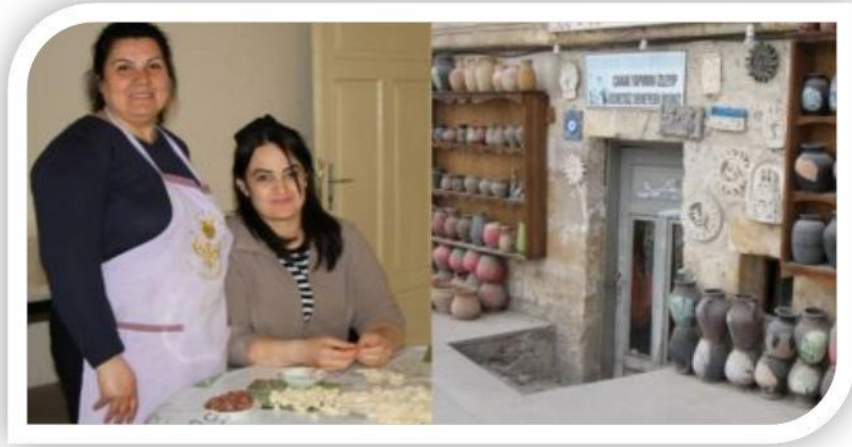
Şekil 6. Avanos Kadın Kooperatifi