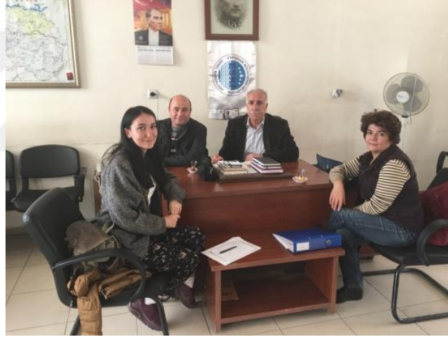
Şekil 13. Çifteler İlçesi Ziyareti

Birinci Ziyaret: Çifteler ilçesine ilk ziyaretimizi gerçekleştirdiğimizde, ilgili Büyükşehir Belediye Temsilcileri ile görüşülüp, projenin amacı anlatıldı. Çifteler İlçesi ile ilgili bilgiler aktarıldı. Kadınlara nasıl ulaşılabileceği sorulmuş ve referandumdan sonra kadınlar ile görüşülmek üzere randevu alınmıştır.