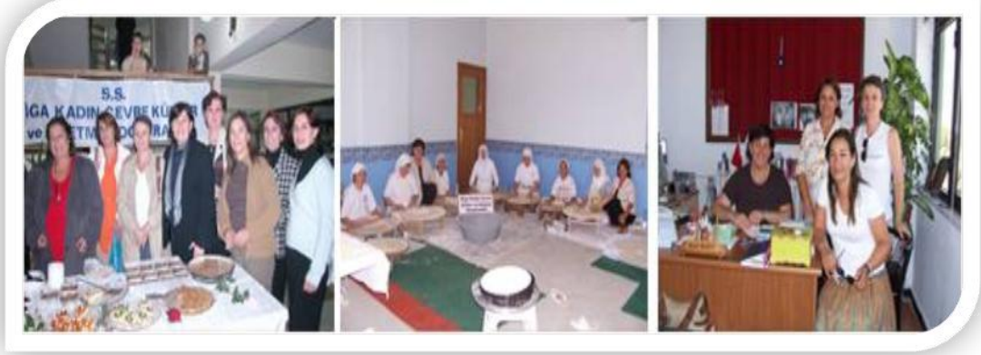
Şekil 7. Biga Kadın Çevre Kültür ve İşletme Kadın Kooperatifi