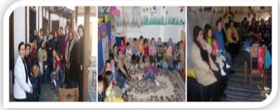
Şekil 5. Nilüfer Kadın Kooperatifi

ifade etme fırsatı bulamamış kadınların kendi yeteneklerinin ve yapabileceklerinin farkına varmaları ve ' Ben de başarabilirim' demeleri yönünde'' şeklindedir (Ayan, 2013).