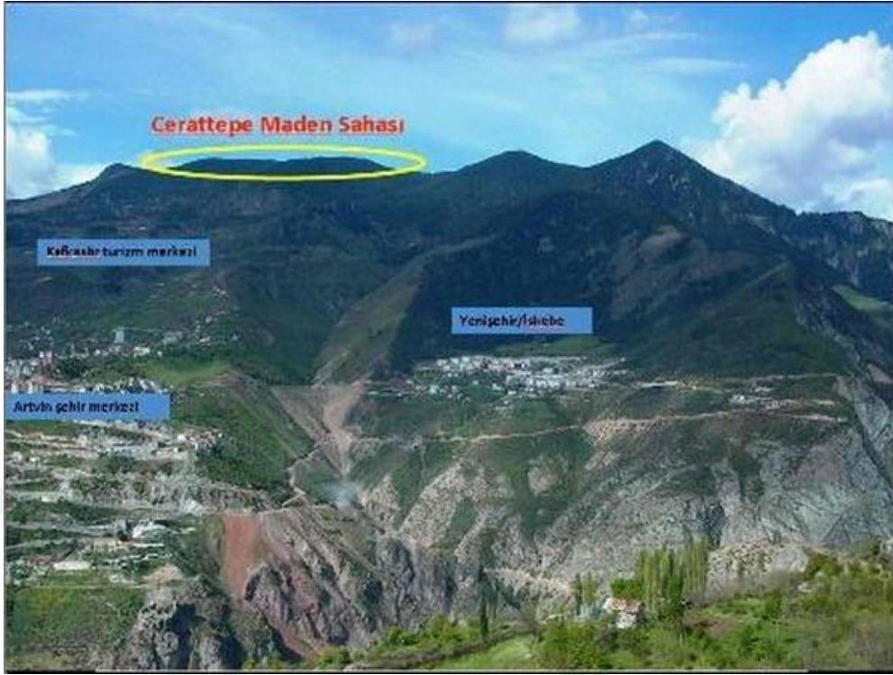
Resim 1: Cerattepe Maden Sahası