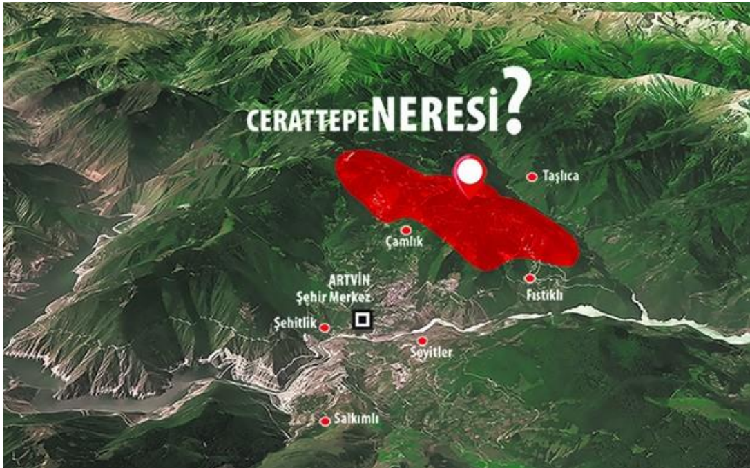
Resim 2: Cerattepe Konumu