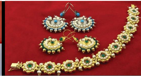
İncili küpe 131