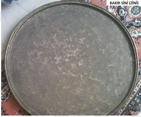
Bakır sini 132