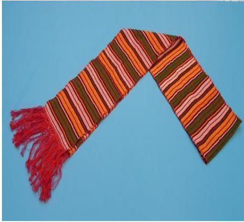
Trablus kuşığı (Silifke) 134