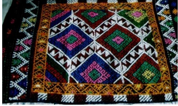
Dokuma yastık 130