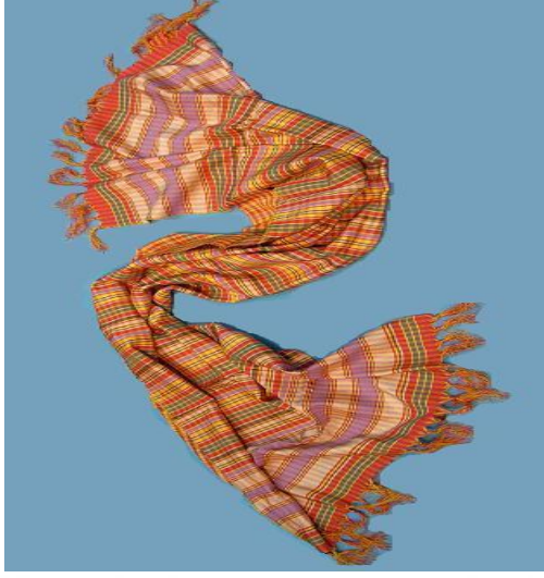
Trablus (ipek) 133