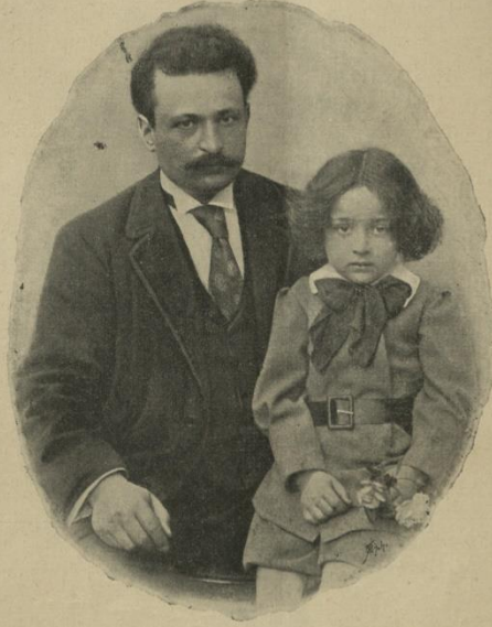
Tevfik Fikret ve oğlu Halûk