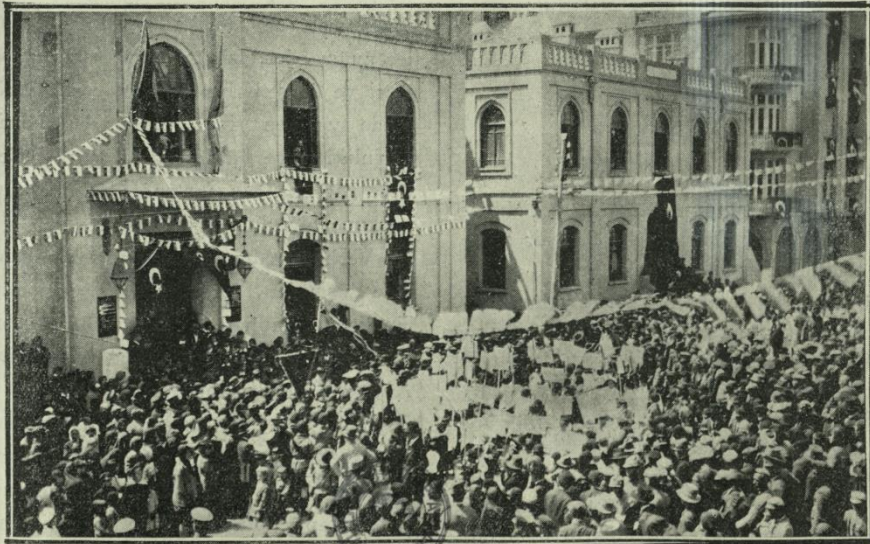
23 Nisan çocuk bayramında çocuk alayı Himayei Etfalden ayrılırken.