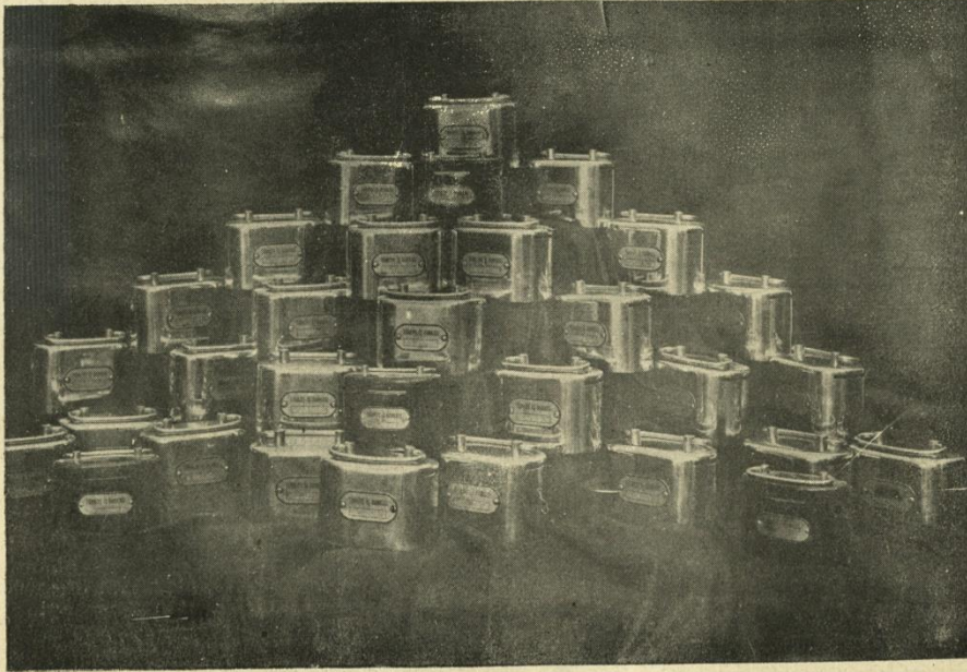
İş Bankası Tasarruf kumbaraları