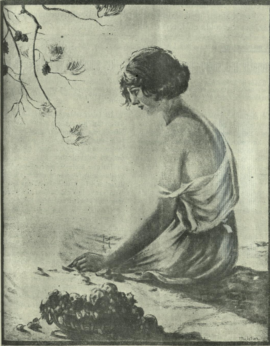
ARKADAN ZIYA (Güneşe dargin bir melek)