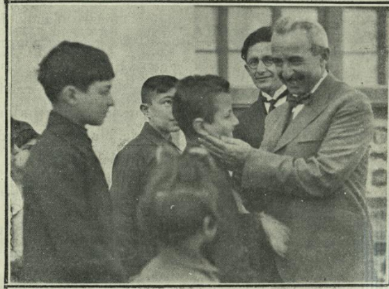
23 Nisan çocuk bayramında İsmet Paşa hazretleri çocukları severken.