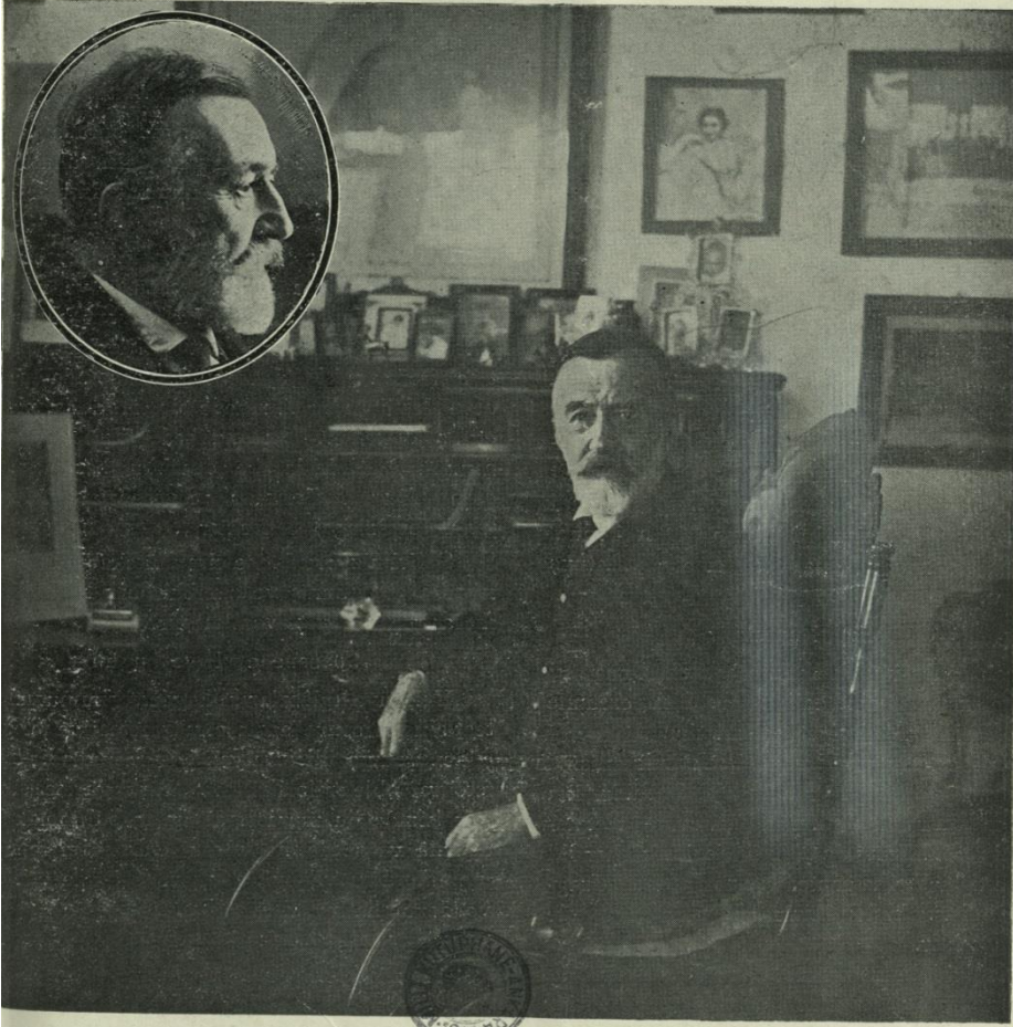
Büyük şair Aptülhak Hamit Beyfendi.

Büyük şairimizin bu defa İstanbul meb'usluğuna intihap edilmesi bütün memleket münevverlerinin, türk edebiyatının bu yük- ahisine karşı beslediği derin muhabbet ve hürmeti tekrara bir vesile teşkil etti. -UYANIŞ- dahiye tebriklerini taktim en bütün karilerinin hissiyatına da tercüman olduğuna kanidir. Üstada bu yeni milli vazifesinde de muvafakiyetler ve ine uzun ömürler dileriz.