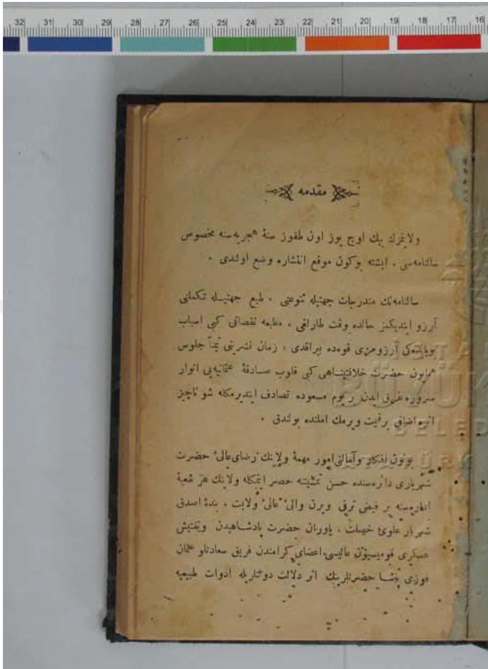
1319 Yanya Vilayeti Salnamesi, s. 1.