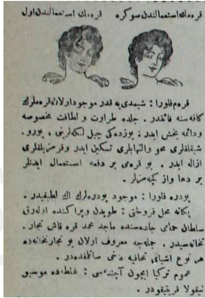
Ek: 13 1909 yılı Tanin gazetesinde yer alan Pertev gzellik kremi reklamı