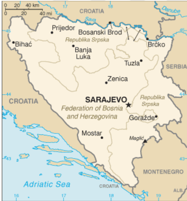
Şekil 5: Bosna Savaşı sonrası sınırların dağılımı (2002)

ateşkes niteliğinde olmuştur ve Hırvatlar ile Müslümanlar arasındaki çatışmaların durulması için çok önemli bir rol oynamıştır. Ayrıca ABD'nin Bosna'daki olaylara daha fazla katkı sağlayacağını göstergesi olmuştur. Bu sırada ABD'de silah ambargosunun kaldırılması için iç siyasette tartışmalar başlamıştır. Fakat Fransa ve İngiltere ambargonun kaldırılmasının savaşa faydası olmayacağını düşünmüştür. Aynı zamanda Kuzey Atlantik Antlaşması Örgütü (North Atlantic Treaty Organization-NATO) daha geniş kapsamlı ve etkili müdahale için harekete geçmiştir. Bosna Hersek'teki Sırp güçlerini hedef alan hava bombardımanı sonrasında Sırp güçleri önce ateşkes yapmak ve sonrasında ise bugün Dayton Barış Anlaşması (Dayton Peace Agreement-DPA) olarak bildiğimiz bir barış anlaşması imzalamak zorunda kalmışlardır. Bu antlaşma 14 Aralık 1995'te Bosna Hersek'in Cumhurbaşkanı İzzetbegoviç, Hırvatistan Devlet Başkanı Franjo Tuđman ve Sırbistan Devlet Başkanı Slobodan Milošević arasında ABD'nin Ohio eyaletinde imzalanmıştır.