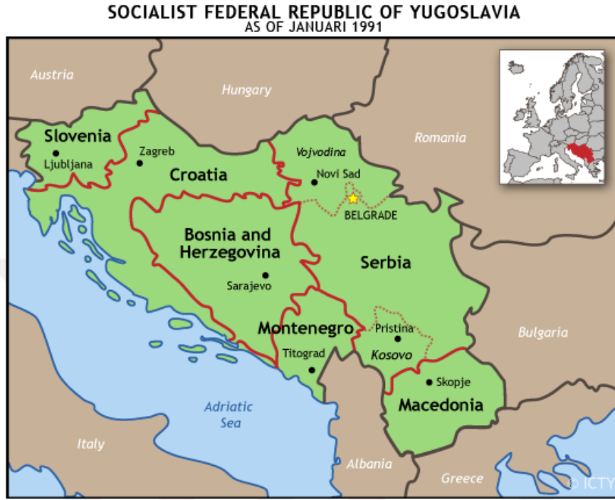
Şekil 3: Eski Yugoslavya sınırları (1991)