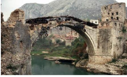
Şekil 6: Bosna Hersek İç Savaşında Mostar Köprüsü

gibi ülkelerin bağışlarıyla yürütülmüş ve proje için Türkiye 1 milyon dolar bağış yapmıştır 41 .