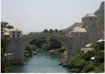
Şekil 7: Yeniden Yapılandırma Çalışmaları Bittikten Sonra Mostar Köprüsü