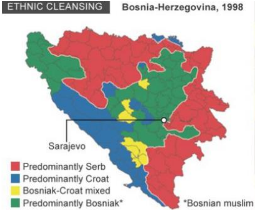
Şekil 2: İç Savaştan Sonra Bosna Hersek'teki Boşnak, Sırp ve Hırvatların dağılımı (1998)