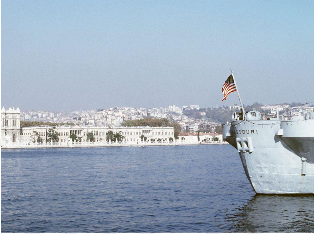
EK- 18: Missouri'nin Türkiye'ye ikinci geliři (İclal-Tunca Örses Arřivi).