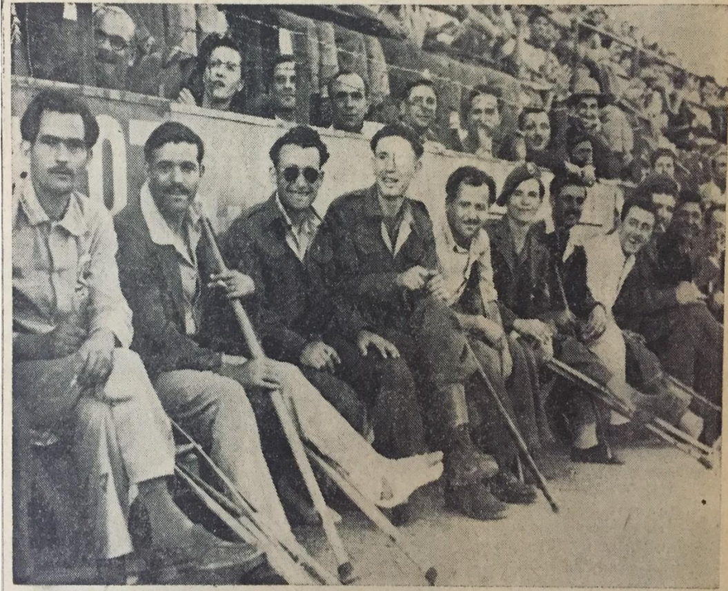
Yunan iç harbinde yaralanan askerler evvelki gün Atina'da yapılan Türkiye - Mısır milli futbol karşılaşmasını kendilerine ayrılan yerden seyrederek.

EK- 8: 15 Mayıs 1949 tarihli Hürriyet gazetesi.