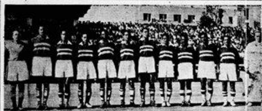
Το σύνολο του αθλητικού όμιλου της Ελλάδας Φίλιας "Εθνική Αθλητική Ομάδα" της Τουρκίας. Οι Τούρκοι, υποστηρίχθηκαν από τους φίλους τους στην Ελλάδα, κέρδισαν τον αγώνα με σκορ 3-2.