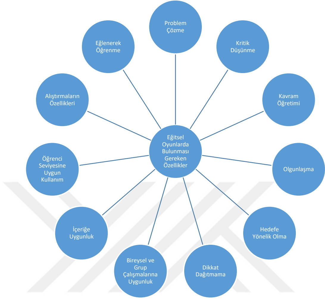
Şekil 1. Eğitsel Oyunlarda Bulunması Gereken Özellikler