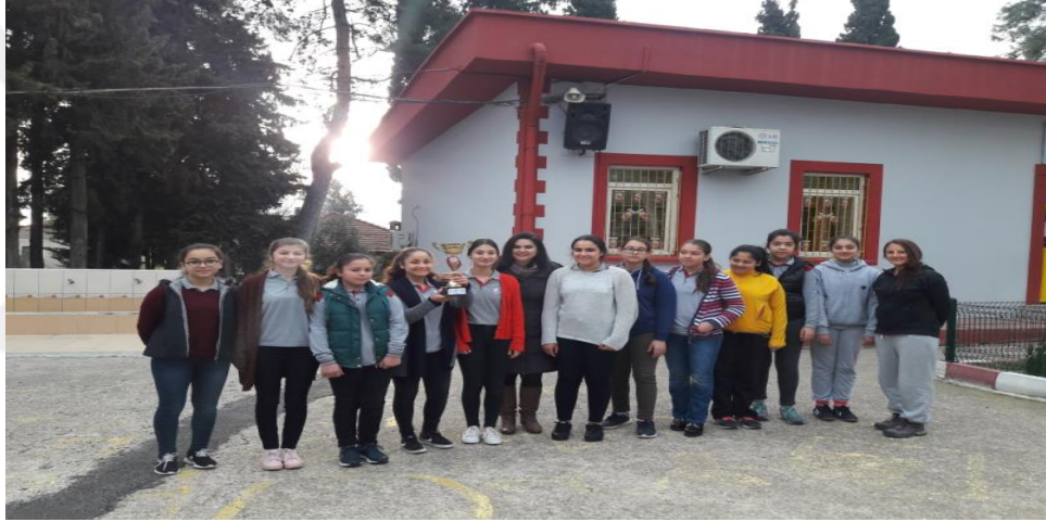
Fotoğraf 4.3.4.21. Dünya Su Günü Kompozisyon Yarışması, İl ve Bölge Birinciliği 2016-2017