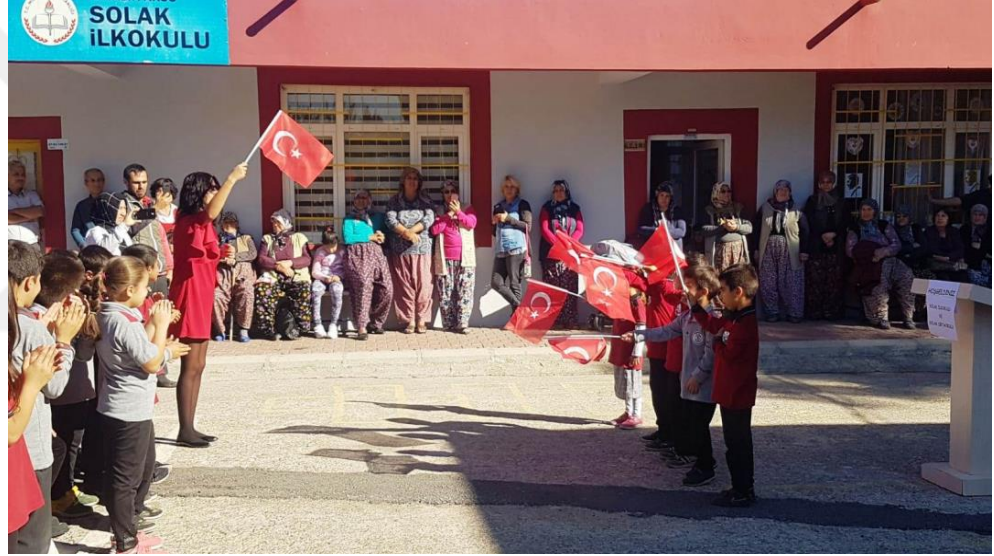
Fotoğraf 4.3.4.15. Tören ve Kutlamalara Öğretmenlerin İstekli Katılımı ve İlğisi, Bahçede Bir Öğretmenler Günü Etkinliği, 2018