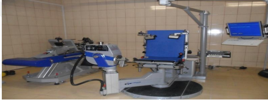
Şekil 3.3 İzokinetik Kuvvet Testi Ölçüm Cihazı

İzokinetik alt ekstremite ergometresinde kuvvet ölçümü için İSOMED 2000 marka izokinetik test ölçüm cihazı kullanılmıştır.