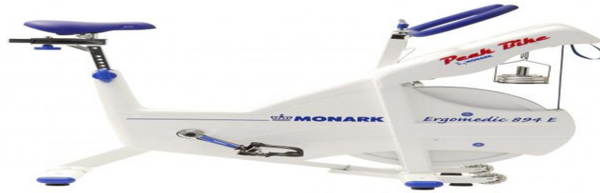
Şekil 3.4 Anaerobik Güç ve Kapasite Ölçüm Cihazı

Anaerobik performansın belirlenmesinde Wingate Anaerobik Güç Testi (WAnT) kullanılmıştır. Bu ölçümde WAnT için modifiye edilmiş, bilgisayara bağlı ve uyumlu bir yazılımla çalışan kefli bir bisiklet ergometresi (Monark Ergomedic 894E, İsveç) kullanılmıştır.