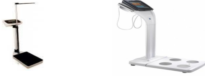
Şekil 3.1 Antropometrik Ölçüm Araçları