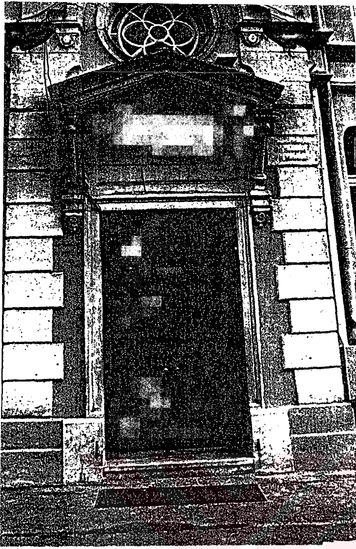
Binaya ön giriş kapısı