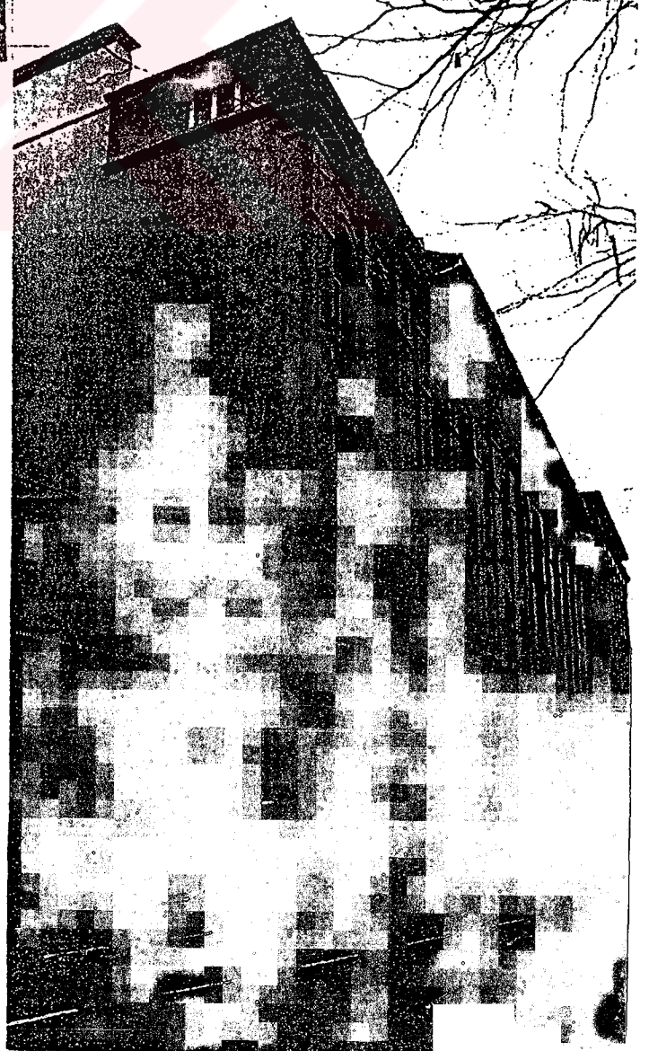
Binanın ön bölümü