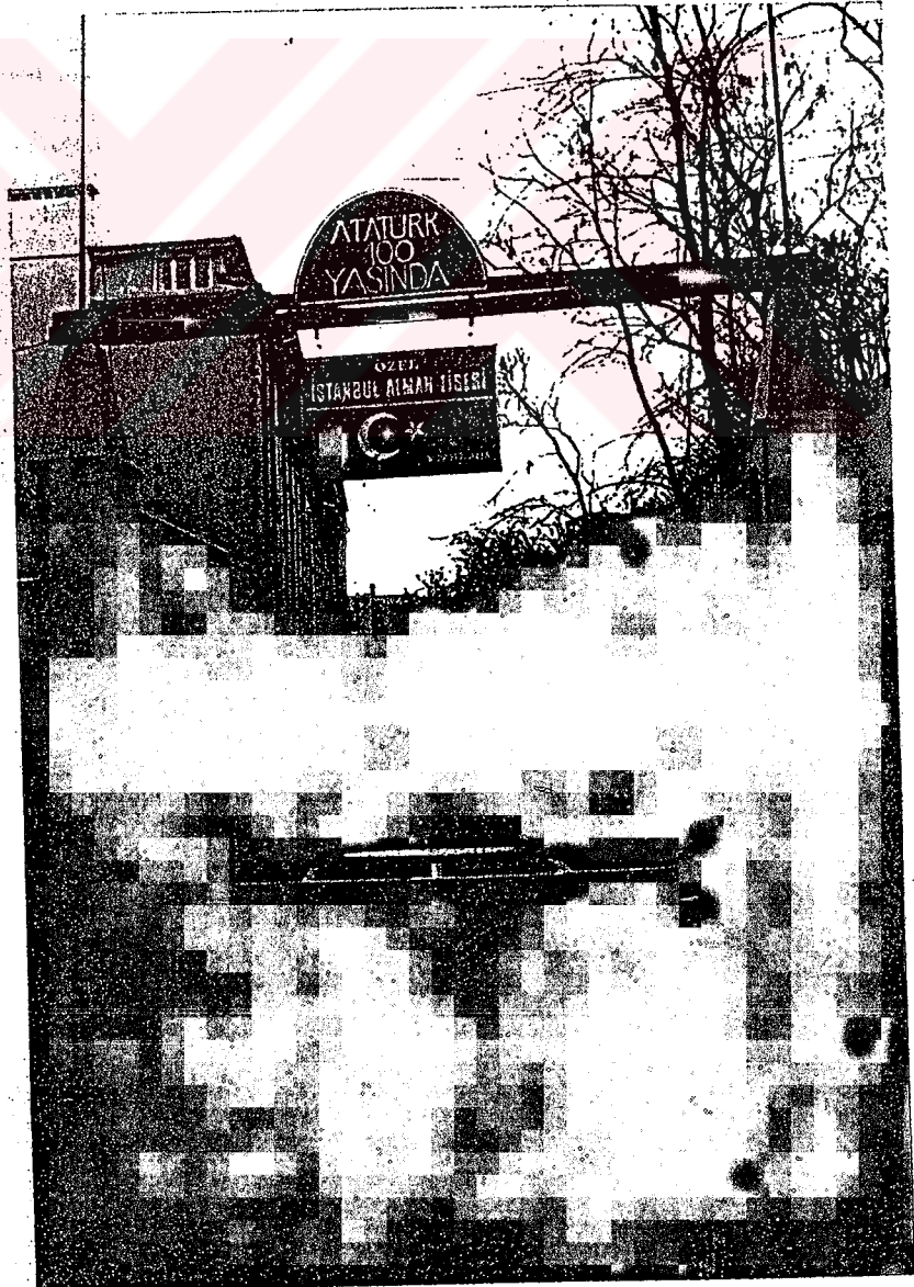
Ön giriş 192 bahçe kapısı