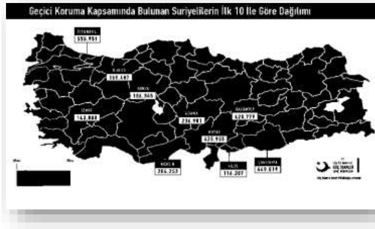
Şekil 4: Geçici Koruma Kapsamında Bulunan Suriyelilerin İlk 10 İle Göre Dağılımı

Geçici Koruma statüsünde bulunan Suriyeli Mültecilerin 139.833’ü geçici barınma merkezlerinde, 3.490.934’nün ise barınma merkezleri dışında kaldığı görülmektedir(GİGM, 2019).