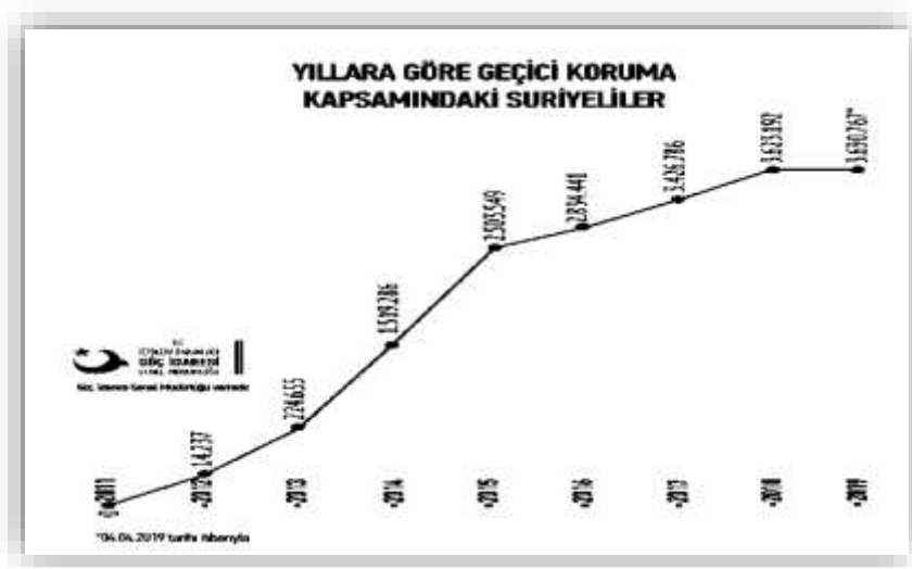
Şekil 2: Geçici Koruma Kapsamındaki Suriyeli Sayısının Yıllara Göre Değişimi

Suriye'de yaşanan Arap Baharından sonra Türkiye'ye sığınan ve Geçici Koruma altına alınan Suriyeli mültecilere ait İl Göç İdaresi Genel Müdürlüğü'nün 04.04.2019 tarihi itibari ile yayınladığı istatistik veriler aşağıdaki şekillerdeki gibidir: