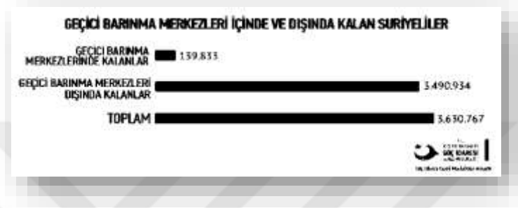
Şekil 3: Geçici Barınma Merkezlerine Dâhil Olan ve Olmayan Suriyeliler

Arap Baharı sonrası Suriye’deki iç karışıklıklar, Suriyeli halkı vatanlarından göç etmeye zorlamış, transit durumunda olan ve ‘Açık Kapı’ politikasını uygulayan Türkiye’ye ilk göç akını 29.04.2011 tarihinde Hatay Cilvegözü sınır kapısından başlamış, 2012 yılında Suriyeli Mülteci sayısı 14.237 iken yedi yıl sonra bu rakamın 3.630.767 gibi ciddi bir sayıya ulaştığı görülmüştür(GİGM, 2019).