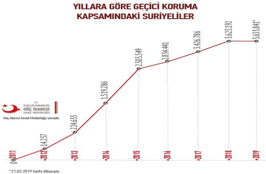
Tablo 1: Göç İdaresi Genel Müdürlüğü, 2019

(Göç İdaresi Genel Müdürlüğü Erişim Tarihi: 09.03.2019)