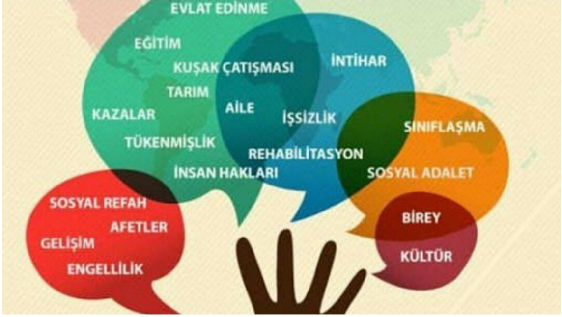
Şekil 0.2. Sosyal Hizmet Öğrencilerinin Sorumlulukları, 2018

İşçi ve okul sosyal hizmet uzmanlarının, öğrencilerin yaşamlarını iyileştirmek için bilgi, beceri ve değerlerini kullanma yöntemleri göstermeleri örnek verilecek sorumluluklarından bir tanesidir. Araştırma, okuyucunun sosyal hizmet becerilerini devlet okulu sistemine bireysel, grup ve topluluk düzeyinde nasıl dahil edeceğini anlamasına yardımcı olmaya çalışır (Yılmaz, 2012). İlişki kurma, değerlendirme, multidisipliner takımlarla çalışma, çocukların ve ergenlerin okulda iyi performans göstermelerine engel olan zorlukların üstesinden gelmelerine yardımcı olmak gibi okul sosyal hizmet uzmanı olmanın temellerine odaklanır. Bir çocuğun devlet okul yaşamının her bir gelişim düzeyindeki sorunları anaokulundan liseye geçişine kadar ele alıyor (Uluoğlu, 2009).