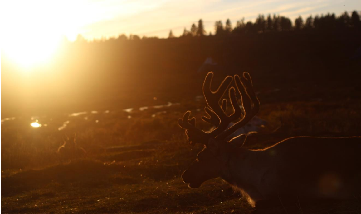
( Sonbahar, Batı Tayga, M. AZATKHAN)