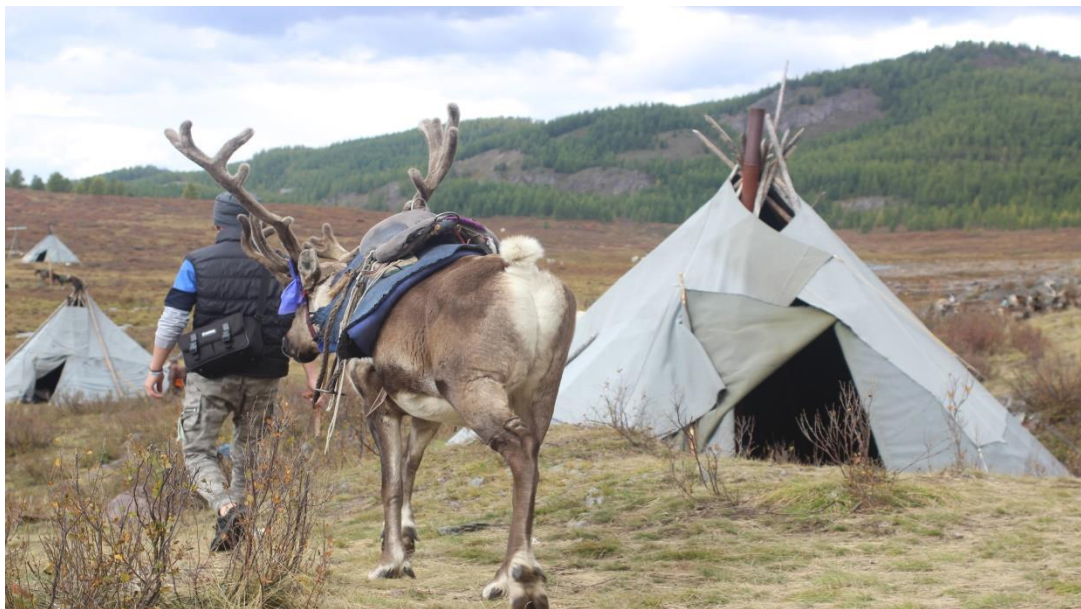
( Sonbahar, Batı Tayga, M. AZATKHAN)