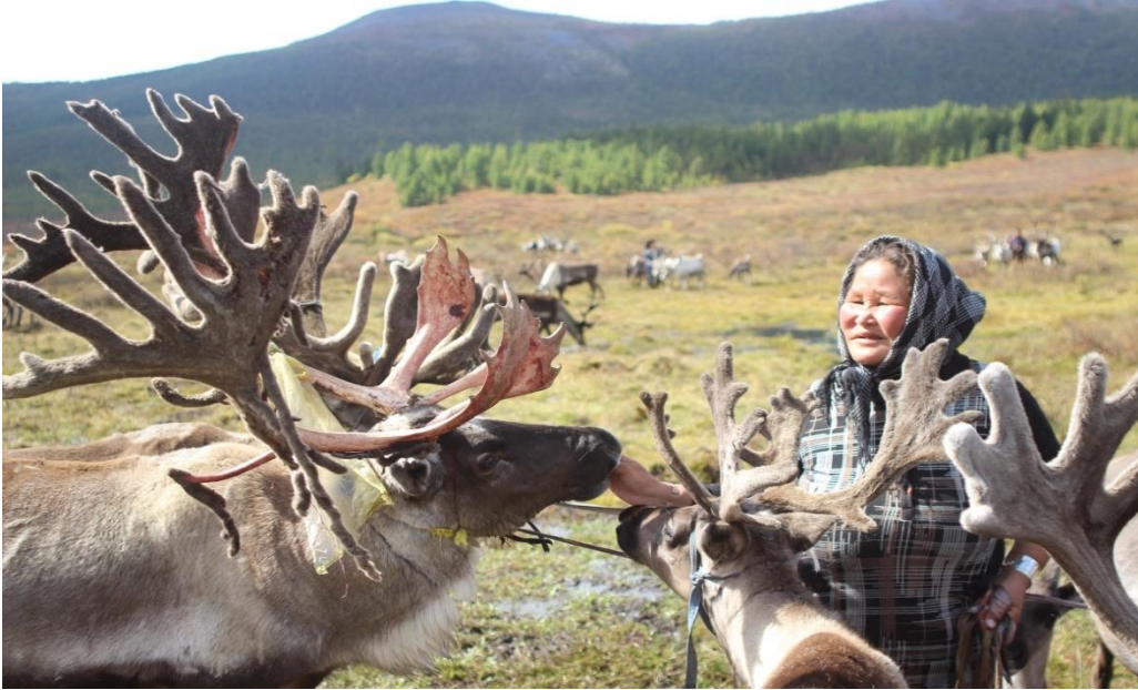
Geyik Çobanı (Sonbahar, Batı Taiga, M. AZATKHAN)