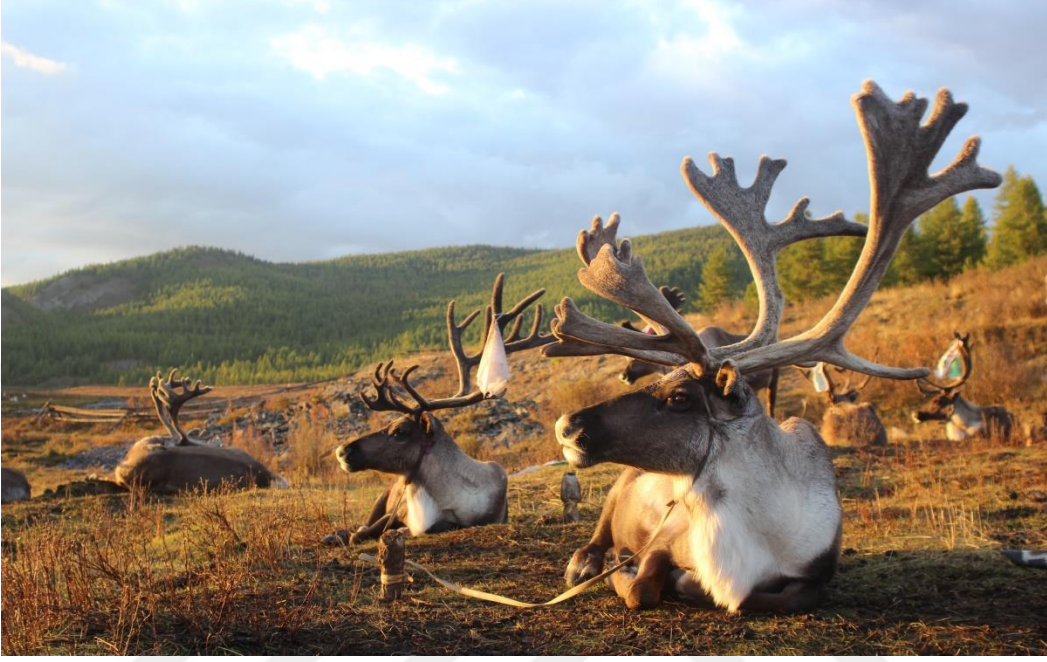
Taiga'da Gün Batımına Doğru ( Sonbahar, Batı Taiga, M. AZATKHAN)