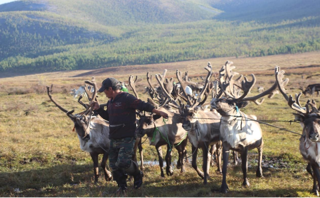
( Sonbahar, Batı Tayga, M. AZATKHAN)