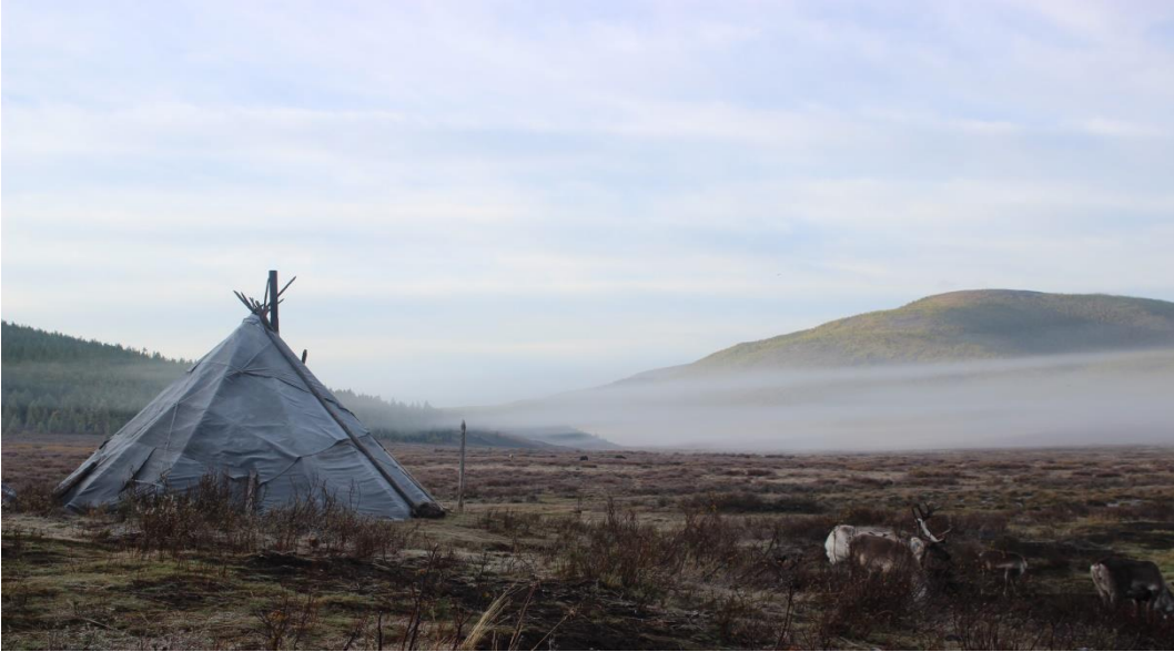
HavalarmSoğumaya Başladıđı Zaman, Sabah ( Sonbahar, Batı Taiga, M. AZATKHAN)