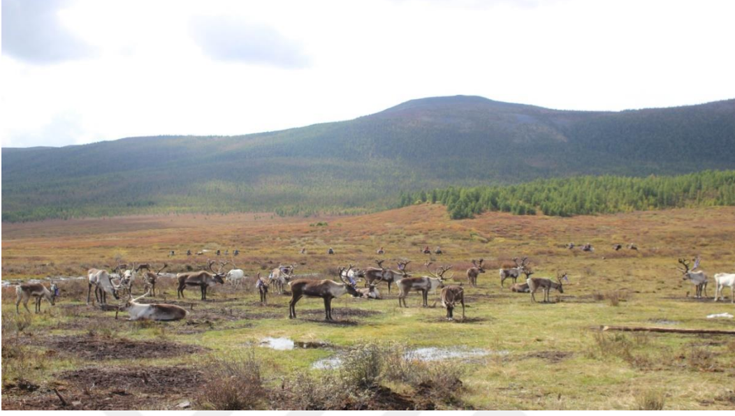
Ren Geyikleri ( Sonbahar, Batı Tayga, M. AZATKHAN)