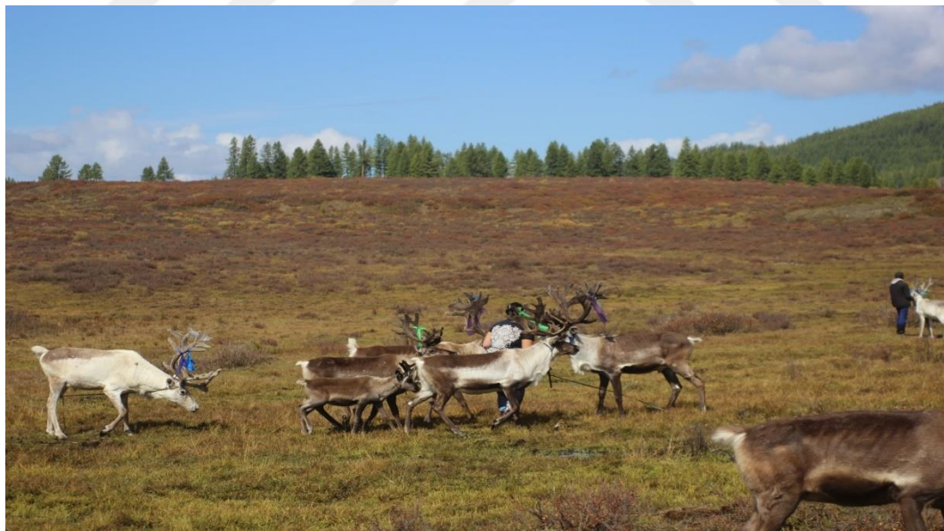
( Sonbahar, Batı Tayga, M. AZATKHAN)