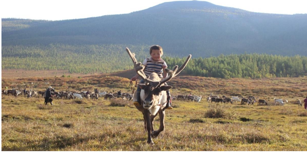
Tayga'da Çocuklara Küçüklüğünden Ren Geyiğine Binmeyi Öğretirler (Sonbahar, Batı Tayga, M. AZATKHAN)