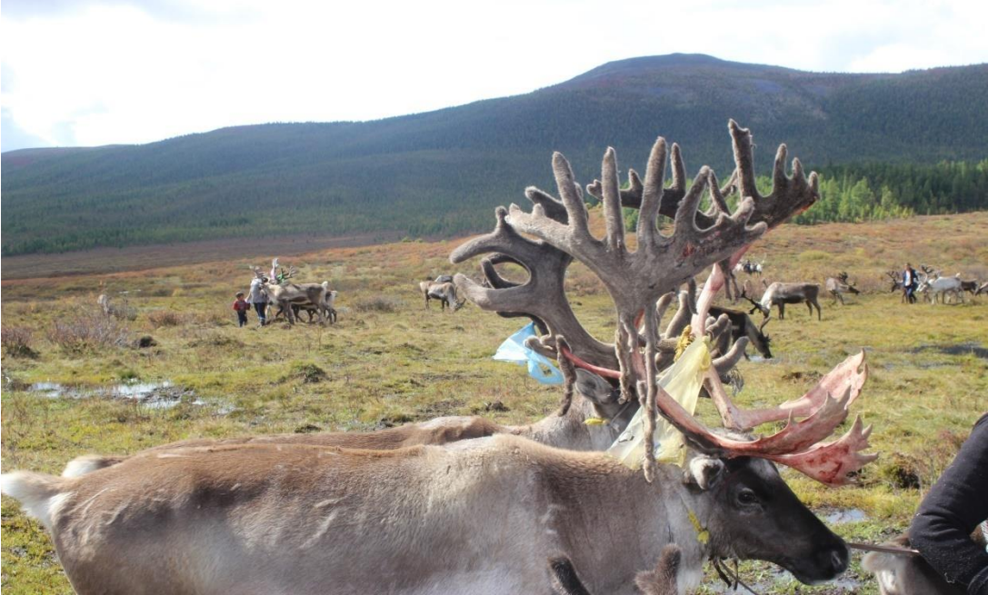
( Sonbahar, Batı Tayga, M. AZATKHAN)