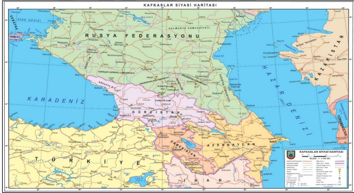
Harita 1.2. Kafkasya Coğrafyası

Serviy Gonarat (M.S. 4. yy), “ Kafkas «İskitya’da dağdır» ” diye yazmıştır. Antik tarihçilerden Pavel Orosiy’e göre Kafkas’ın birçok adı vardır. Pliniy ise İskitlerin Kafkas dağlarını Kroukas; yani « kar gibi ak » olarak tasvir eden yazardır. 2 Eski Yunanlıların “As” diye nitelendirdiği Kafkasya bölgesi bugünkü Asya Kitasının temelidir. “Asların Dağı” anlamındaki Kafkaslar, sonraları Tatarlar tarafından “Jalbuz”; yani “Buz Yelesi” diye adlandırılırken, Nogaylar tarafından ise “Yıldız Dağları” olarak adlandırılmıştır. Kafkasya adlandırılmasıyla ilgili bir görüşe göre “Kafkas” adı Farsça “dağ” anlamına gelen “kuh” kelimesiyle eski Türkçedeki “beyaz” anlamına gelen “kas” kelimelerinin birleştirilmesinden oluşmuştur. 3 Arap coğrafyacıları Kafkasya için “Arran ülkesi” “Cebelül-Elsan” veya “Hazar ülkesi” gibi çeşitli tanımlamalar yapmışlarsa da Kafkasya dedikleri bu memleket hakkındaki klasik eserler incelendiğinde Kafkasya’nın coğrafi sınırlarının tespitinin oldukça zor olduğu görülmektedir. 4