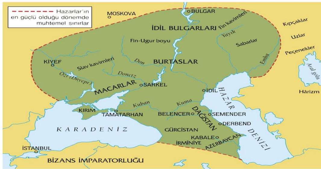
Harita 3.2. Hazar Kağanlığı

Hazarların genel siyasi tarihine bakmadan evvel Hazar ülkesinin sınırlarının verilmesi ve Kafkaslar da ne kadar sınırlarının bulunduğunu bildirmek yararlı olacaktır.