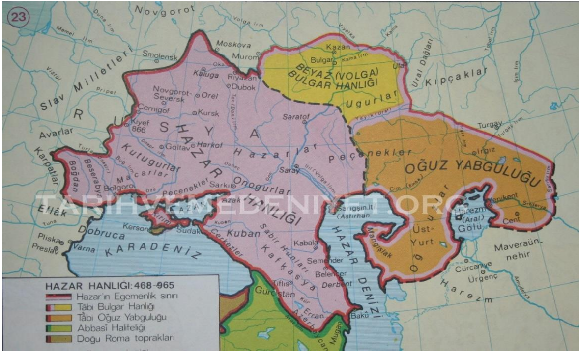
Harita 3.1. Hazar Ülkesi Siyasi Sınırları