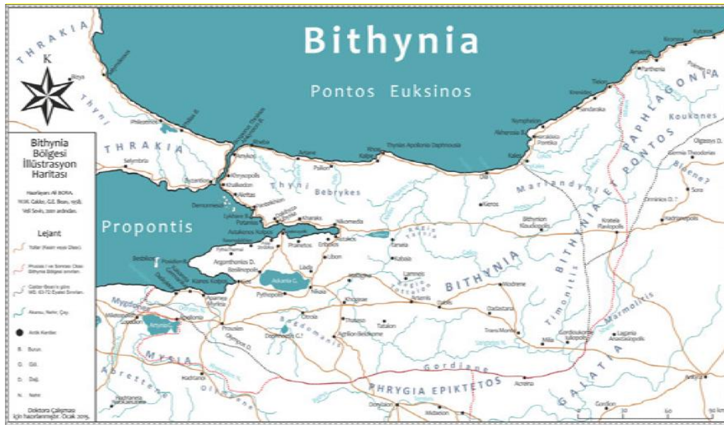
Harita 3.2. Bithynia Bölgesi coğrafyası (Bora, 2015)