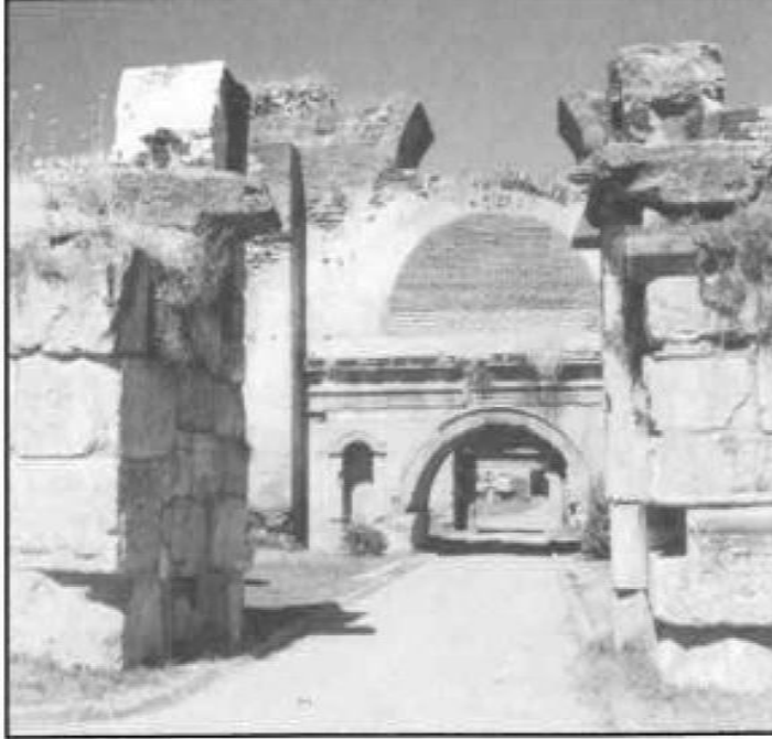
Resim 2.11. Nikaia kenti İstanbul Kapısı (Kuzey) (Holt, 2010)