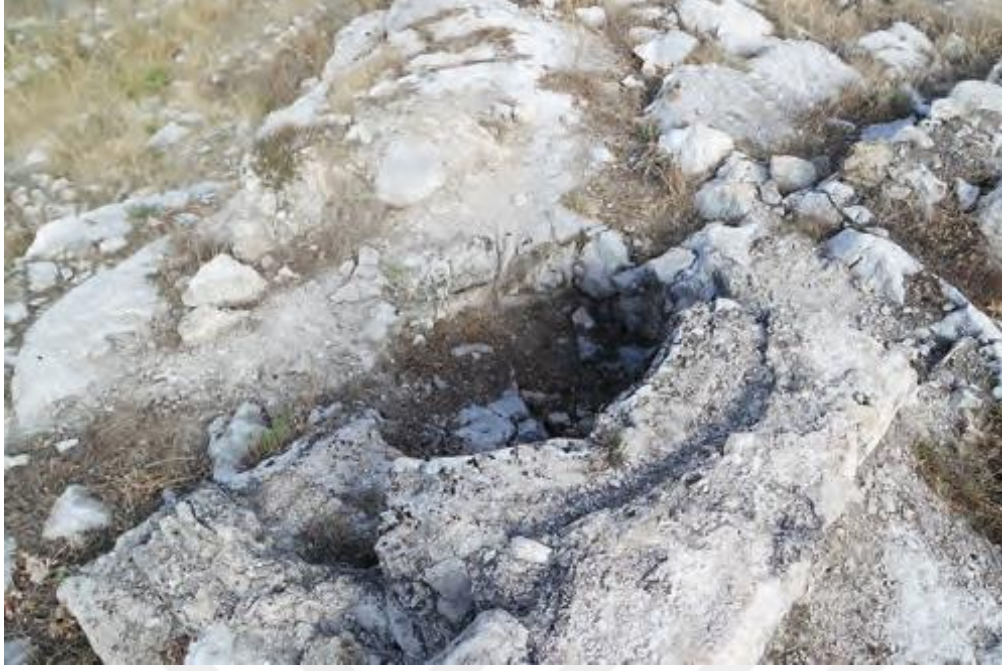
Resim 2.2. Ateş Sunağı Kaide Boşluğu (Dönmez Ş. , 2013)