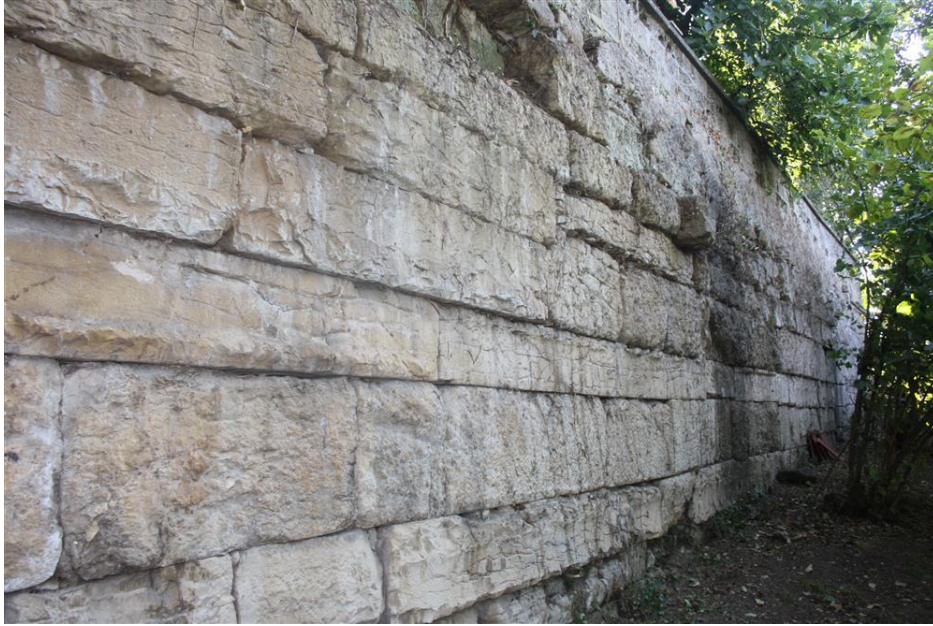
Resim 2.9. Prusias ad Hypium batı sur duvarları