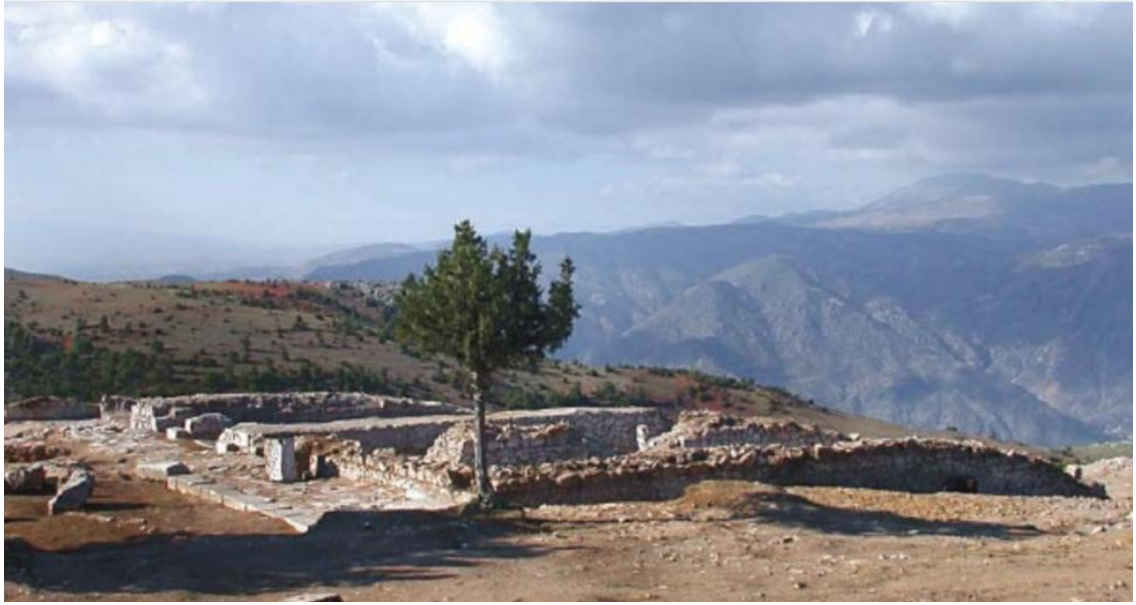
Resim 2.1. Zeus Stratios kutsal alanı (Aktaş, 2018)