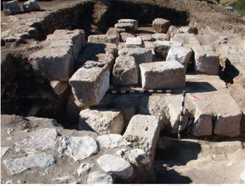
Resim 2.4. Zeus Stratios Kutsal Alanı Mimari Kalıntıları