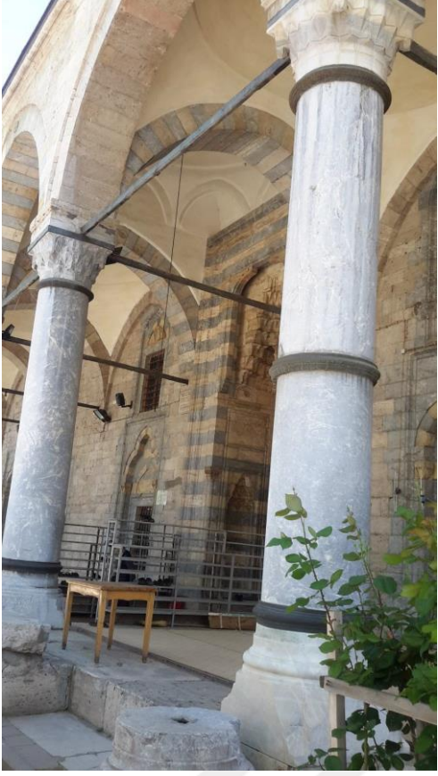
Resim 2.6. Tokat Ali Paşa Camii'nden detay (Aktaş, 2018)