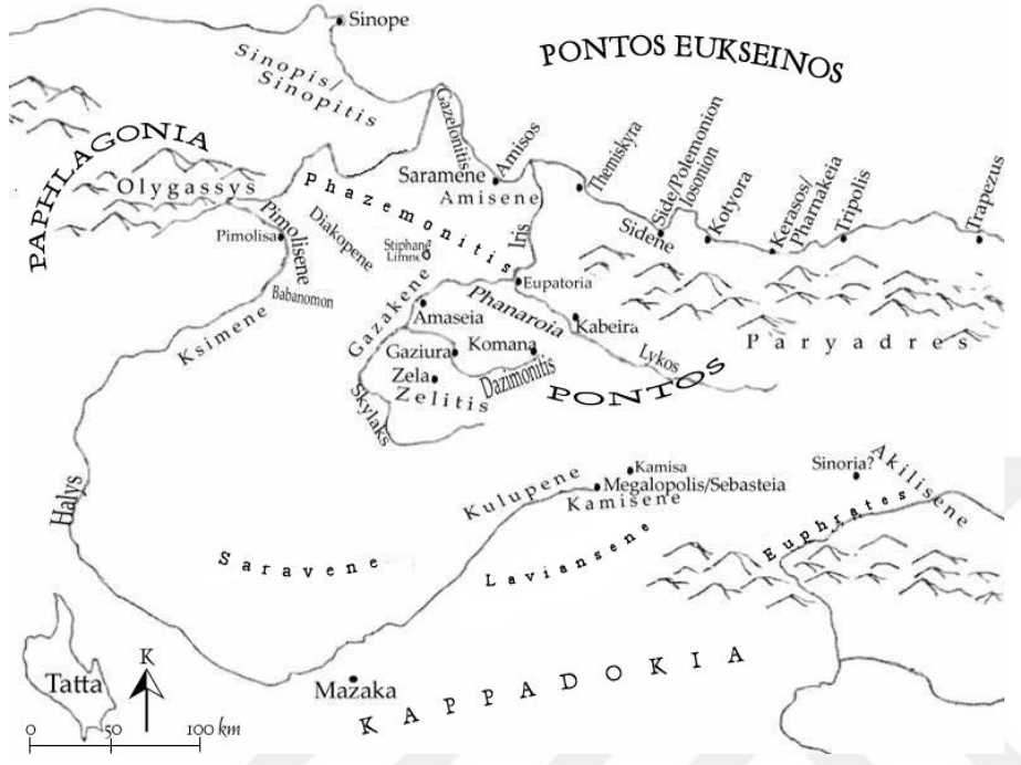
Harita 3.1. Pontos Bölgesi Coğrafyası (Arslan M. , 2007)