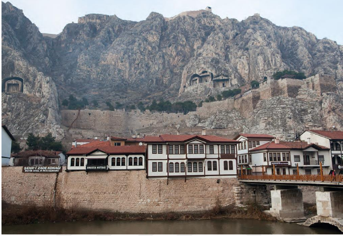
Resim 2.1. Kızlar Sarayı Mevkii ve Kral Kaya Mezarları (Dönmez Ş. , 2013)