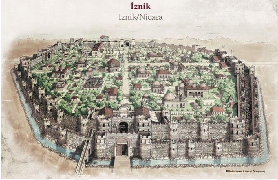
Resim 2.10. Nikaia kentini çevreleyen surlar (Bursa Valiliği- İznik)