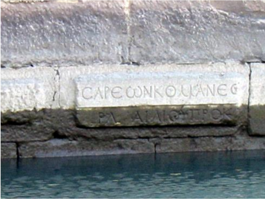
Resim 2.7. Roma köprüsünün ayağında bulunan yazıt (Sökmen, 2005)