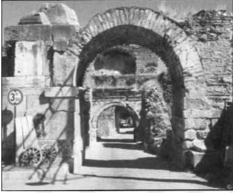
Resim 2.12. Nikaia kenti Lefke Kapısı (Doğu) (Holt, 2010)