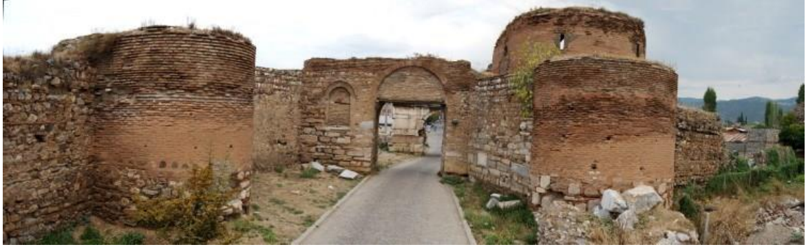
Resim 2.13. Nikaia kenti Yenişehir Kapısı (Güney)