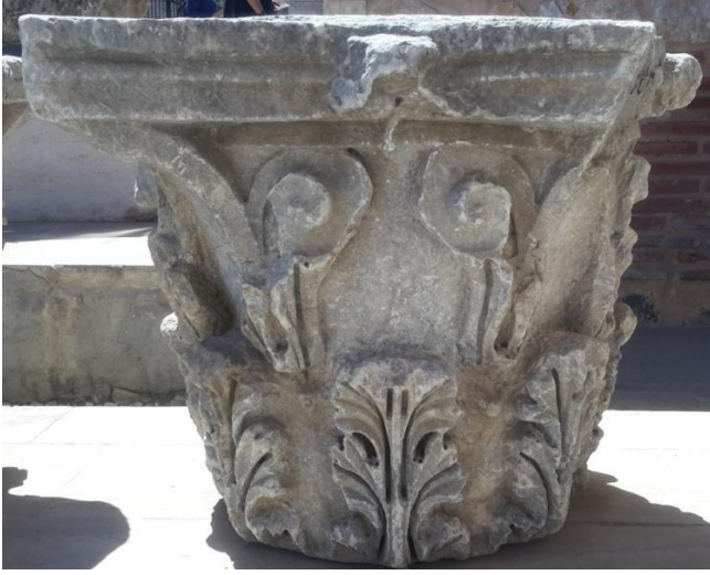
Resim 2.5. Korinth sütun başlığı-Tokat Müzesi (Aktaş, 2018)