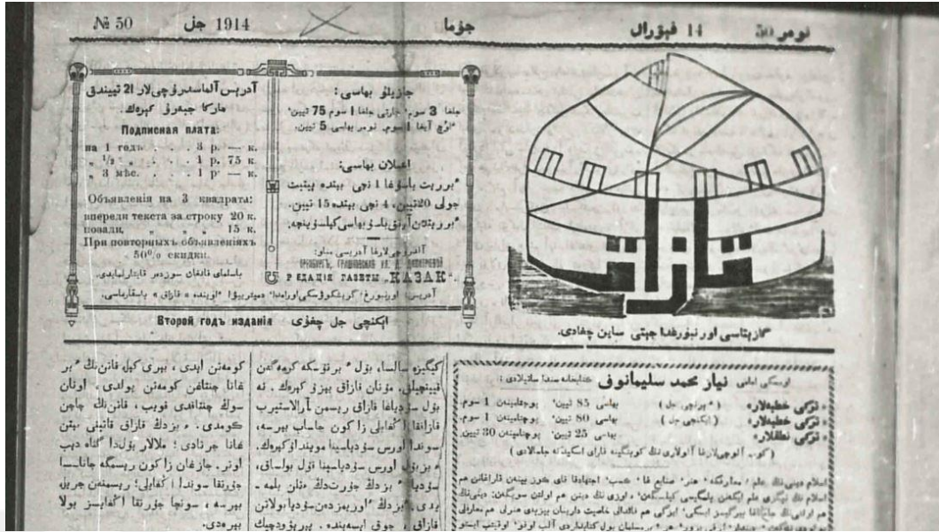
Resim 3.2. Kazak Gazetesi'nin 50. sayısı, 1914 yıl (Kaynak: https://www.azattyq.org/a/kazakhstan-the-newspaper-kazakh-100-years/24611208.html , 17.05.2019).