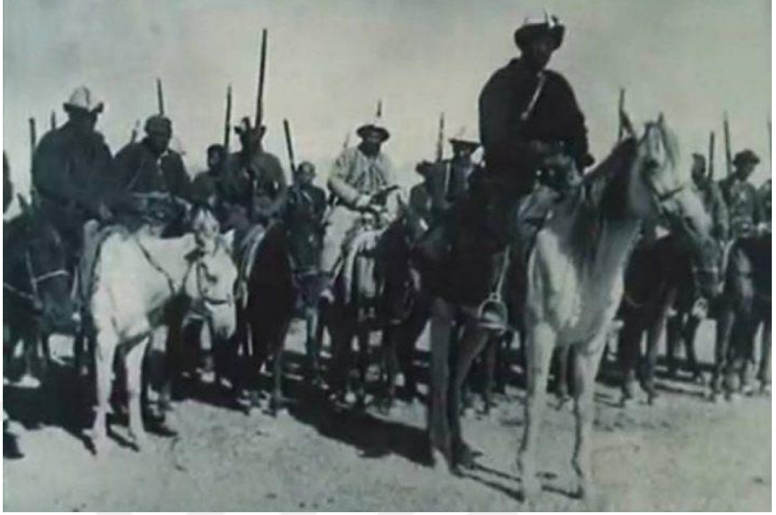
Resim 2.1. Amangeldi İmanov ve başkaldırcılar.