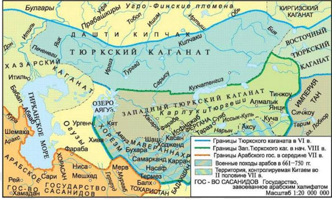
Harita 2.1. Türk Kağanatı ve Batı Türk Kağanatı haritası.