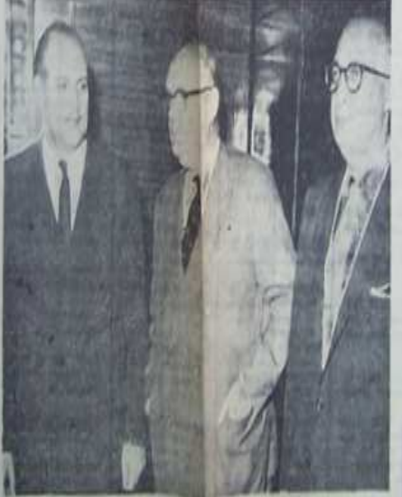
● Milyon Fatin Kızıllı, Zorlu, Hariciye Nazırı yanında yanında bulunan Zorlu üyeleri ile birlikte konuşan NATO Genel Sekreteri, Zorlu, Zorlu'nun üyeleri.

Anca, 4'ün mühakemeler esnasında tanrıyını düşürmek için çok gayret sarf etmiş olacağız. Şeref ve haysiyetimize ilgili konularda tutumumuz kendimiz tayin ederiz. Her halde bu mevzuatki dâvalar hukuki mü-