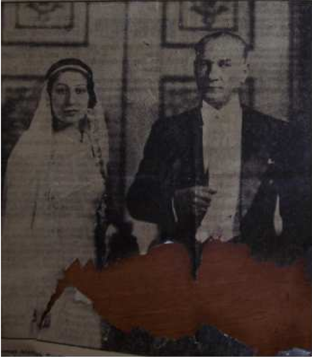
Fatin Rüştü Zorlu'nun nikâh töreninden bir resim. Atatürk ve Fatin Rüştü Zorlu'nun eşi Emel Zorlu.