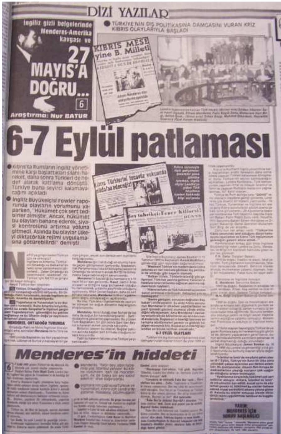
Milliyet 18 Şubat 1989