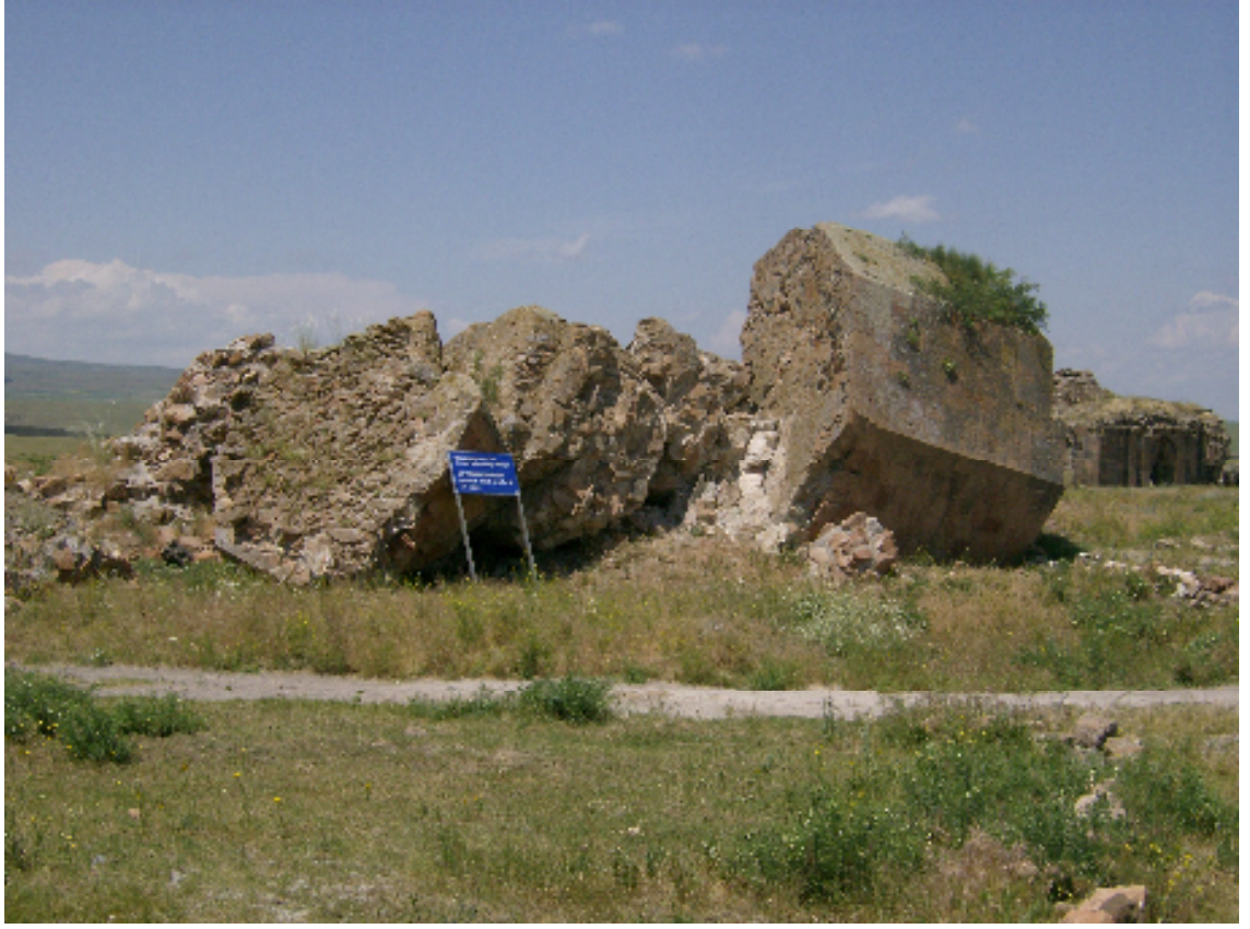
Resim 7: Ebu'l Muammeran Cami'nden Geriye Kalan Yıkık Minare