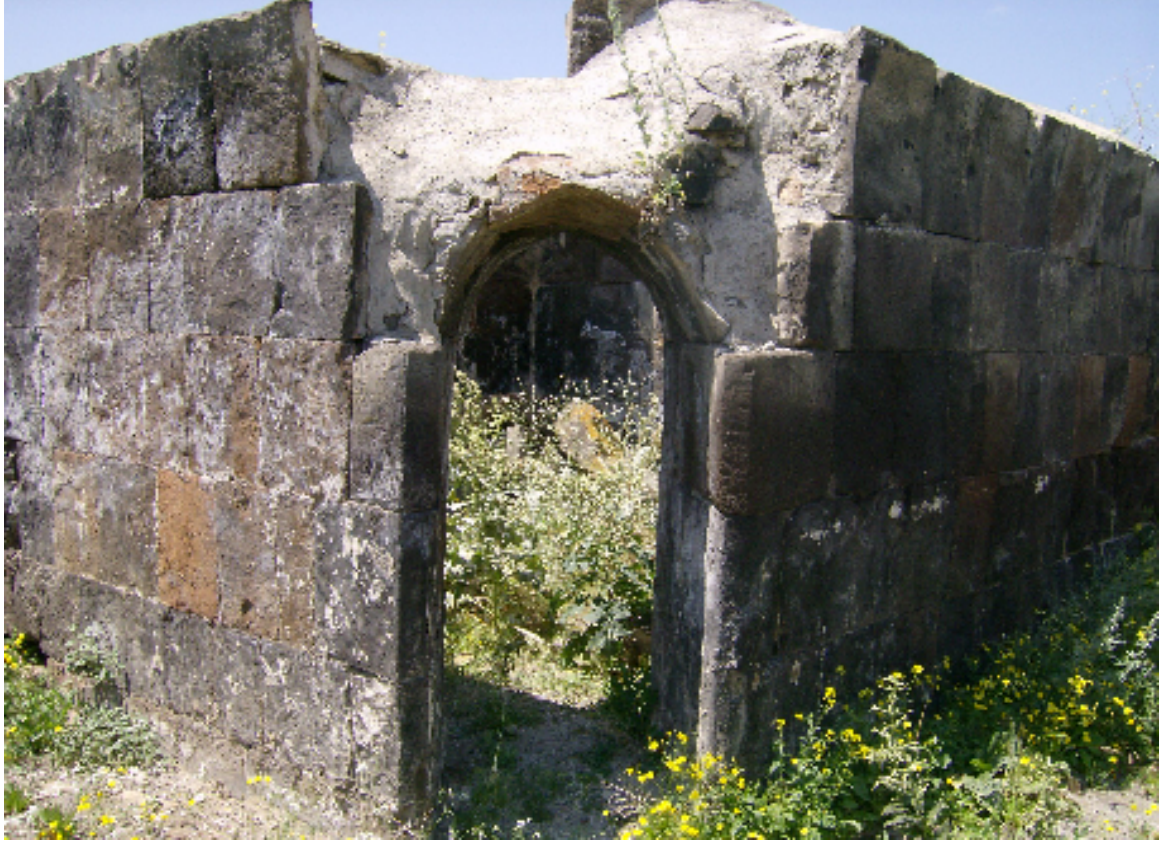
Resim 19: Küçük Hamamın Sıcaklık Bölümlerinden Birinin Giriş Kapısı