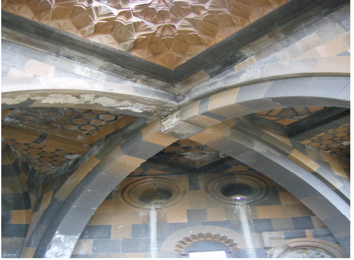
Resim 13: Mastaba Kervansaray'ının Tavanından Bir Görünüm