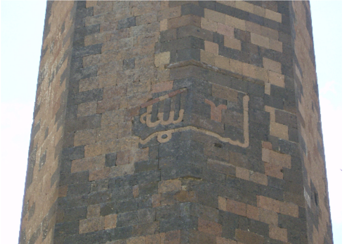
Resim 6: Menuçehr Camî'nin Minaresi ve Besmele-i Şerif