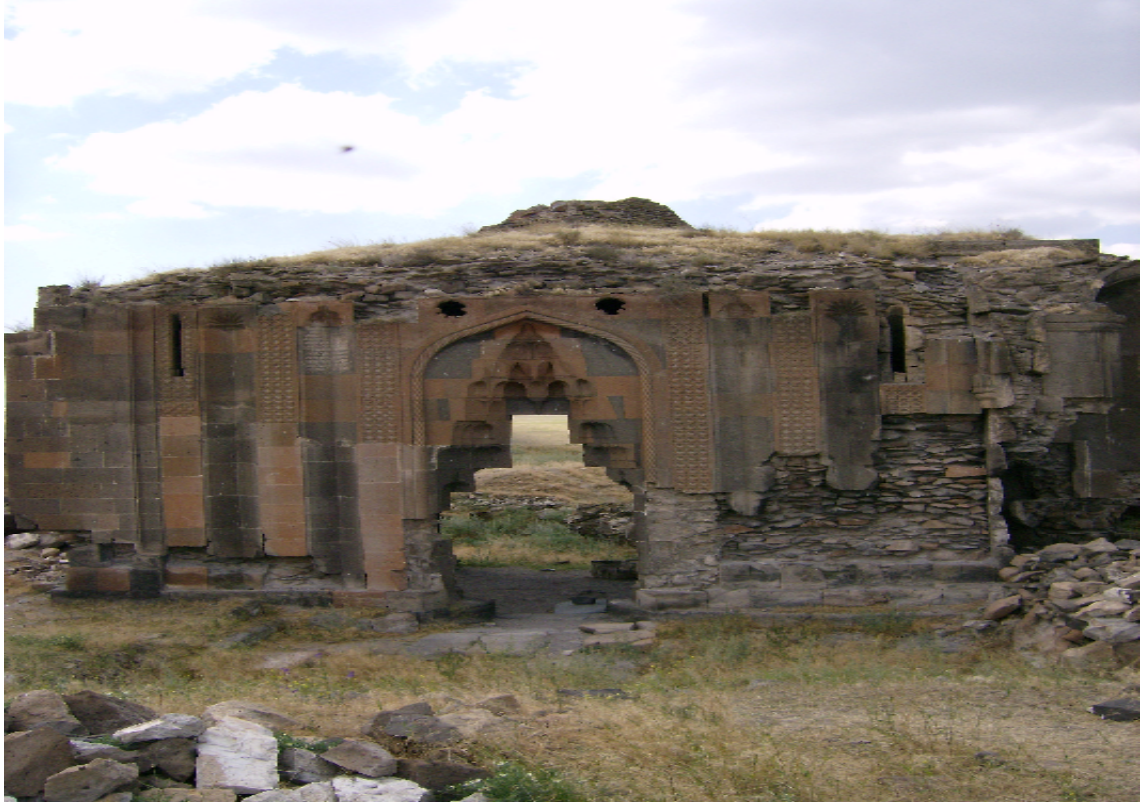
Resim 11: Menuçehr'in Yaptırdığı Mastaba Kervansarayı'nın Genel Görünümü