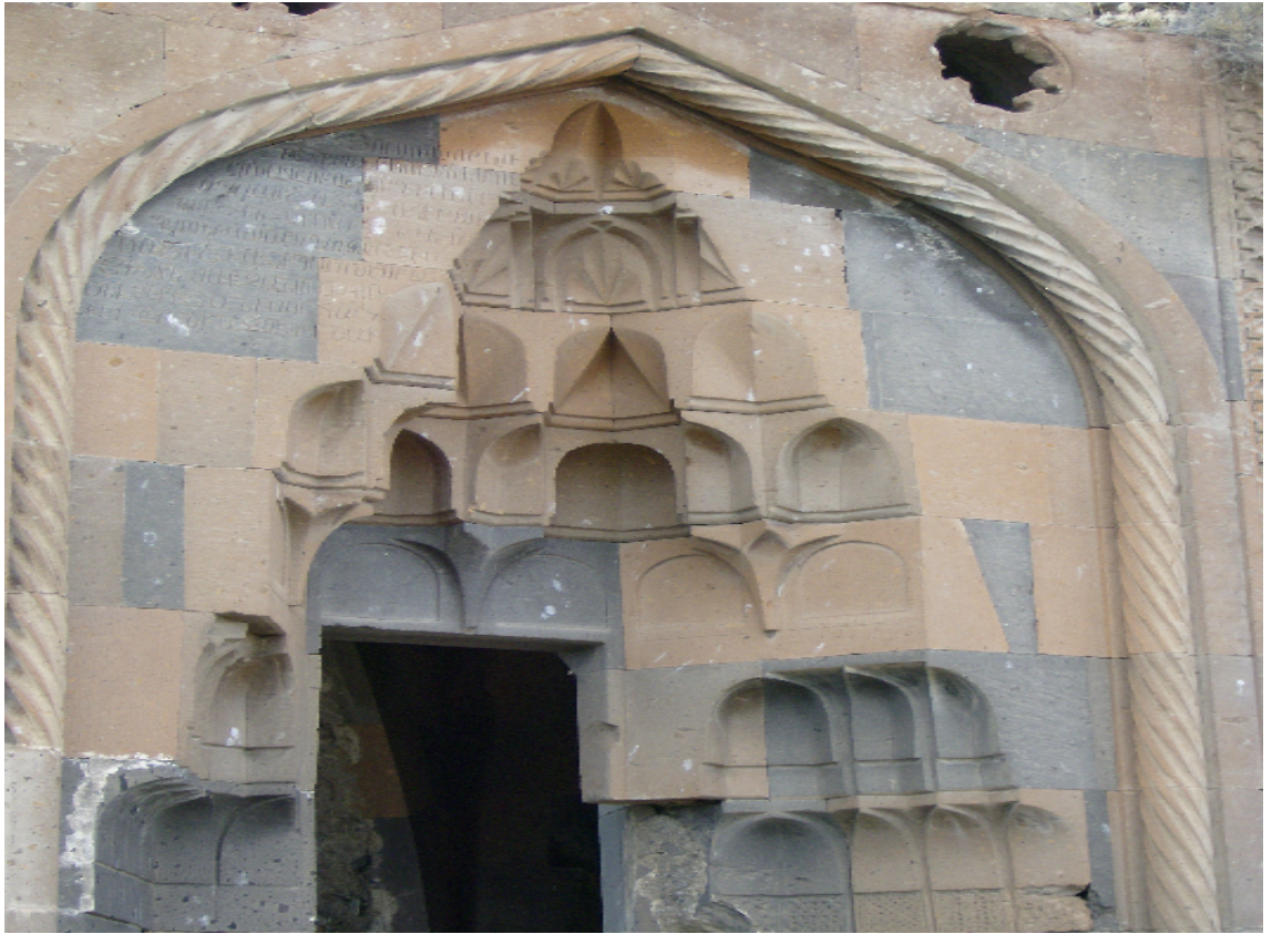
Resim 12: Mastaba Kervansarayı'nın Giriş Kapısı