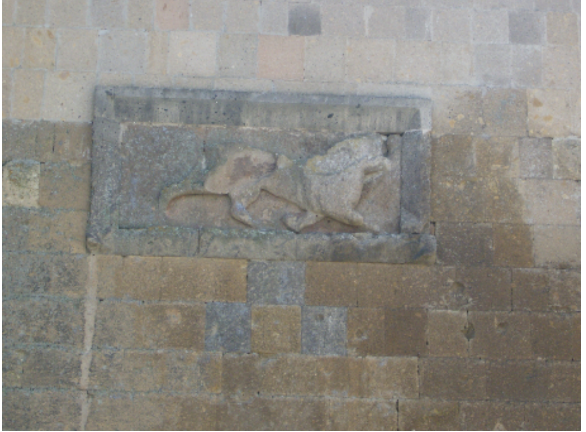
Resim 1: Aslanlı Kapı'ya Adını Veren Aslan Kabartması