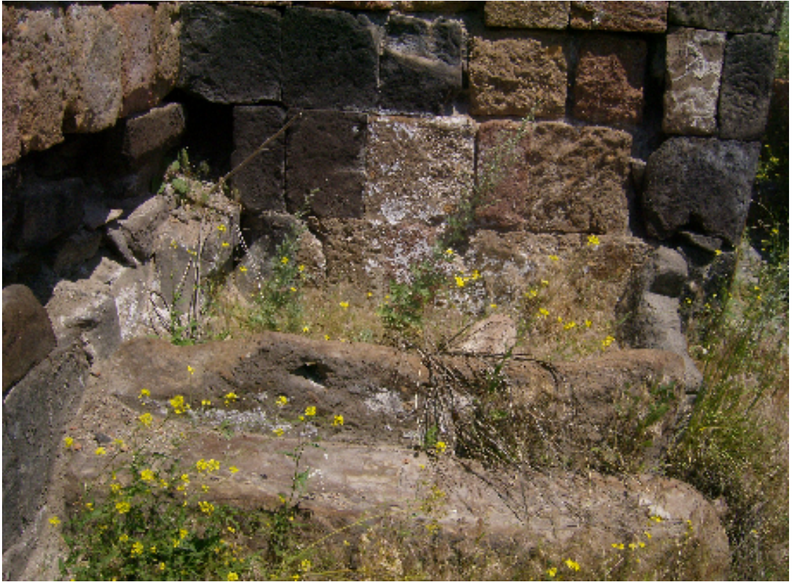
Resim 18: Küçük Hamamın İçindeki Kurnalardan Biri