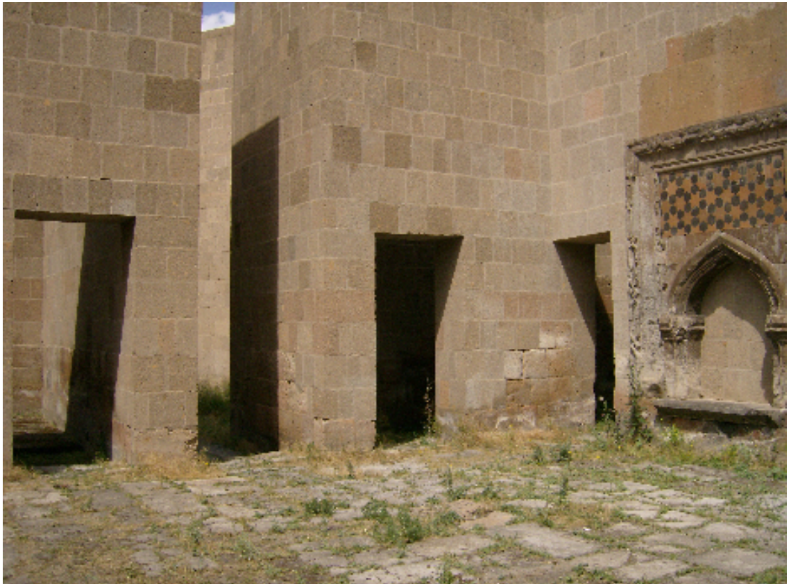
Resim 10: Şeddadi Sarayı'nın İçinden Bir Görünüm