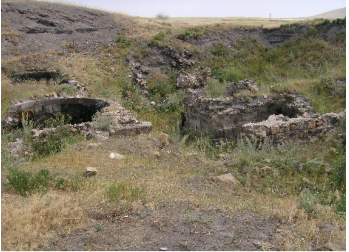
Resim 14: Kadı Burhaneddin Anevi'nin Doğduğu Büyük Hamamın Kalıntısı