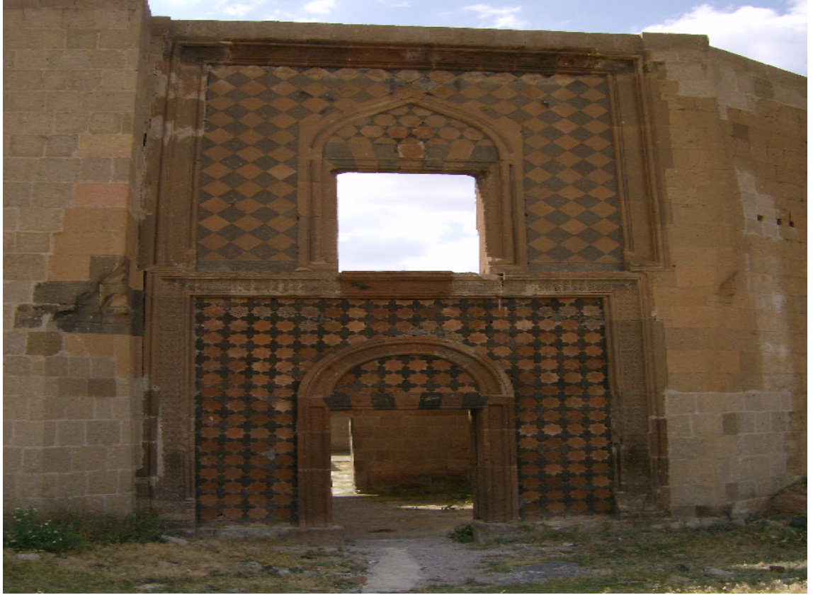
Resim 9: Şeddadi Sarayı'nın Giriş Kapısı