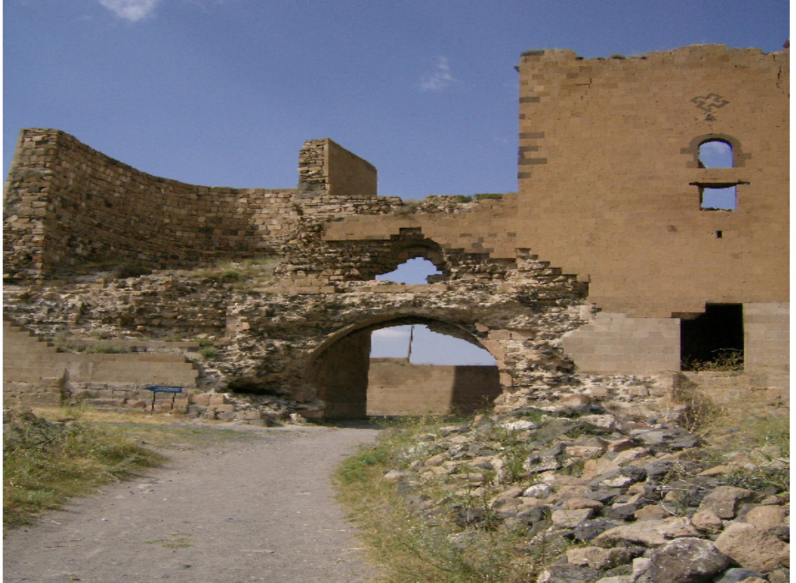
Resim 2: Aslanlı Kapı'nın İç Kısmı