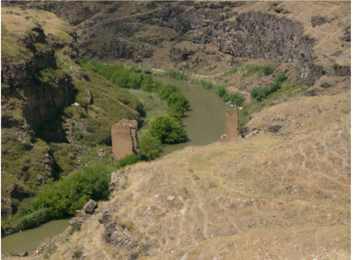
Resim 24: Arpaçay Üzerindeki Tarihi İpek Yolu Köprüsü