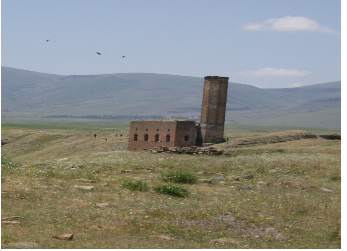
Resim 3: Menuçehr Camî'nin Uzaktan Bir Görünümü