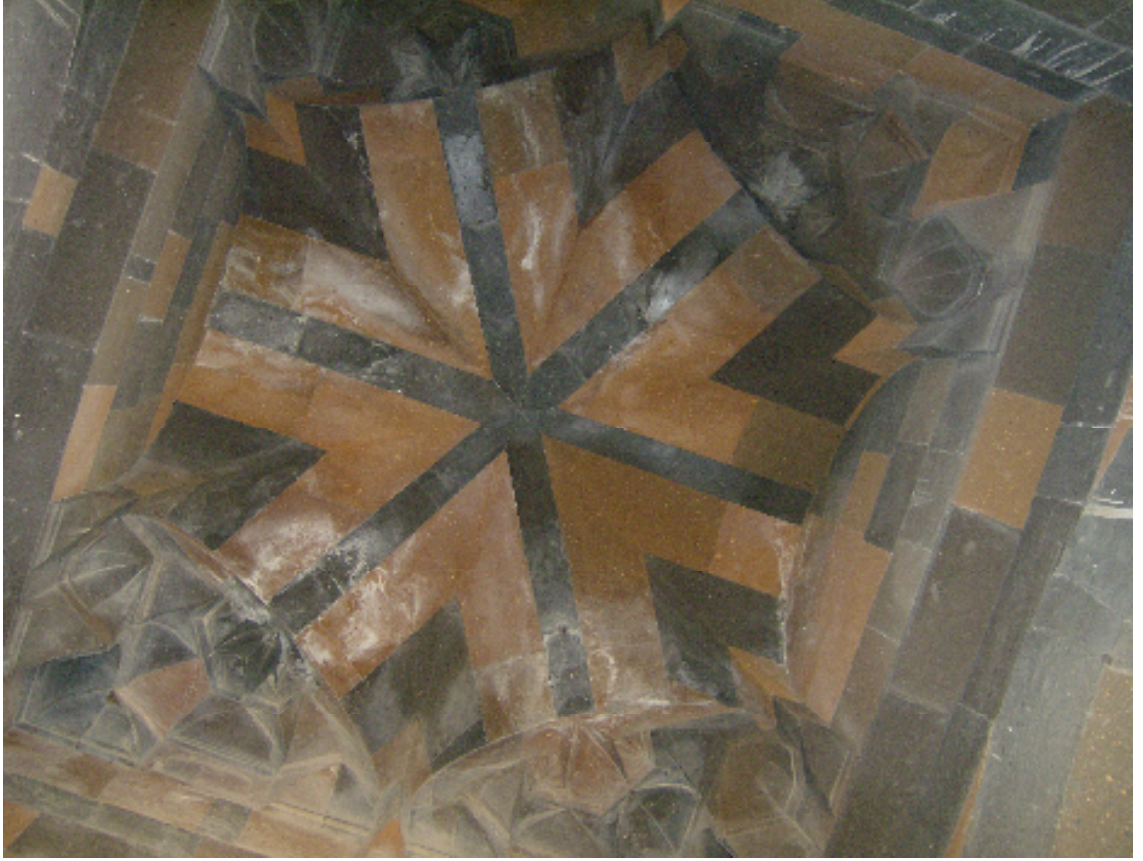
Resim 5: Menuçehr Camî'nin Tavanından Bir Görünüm