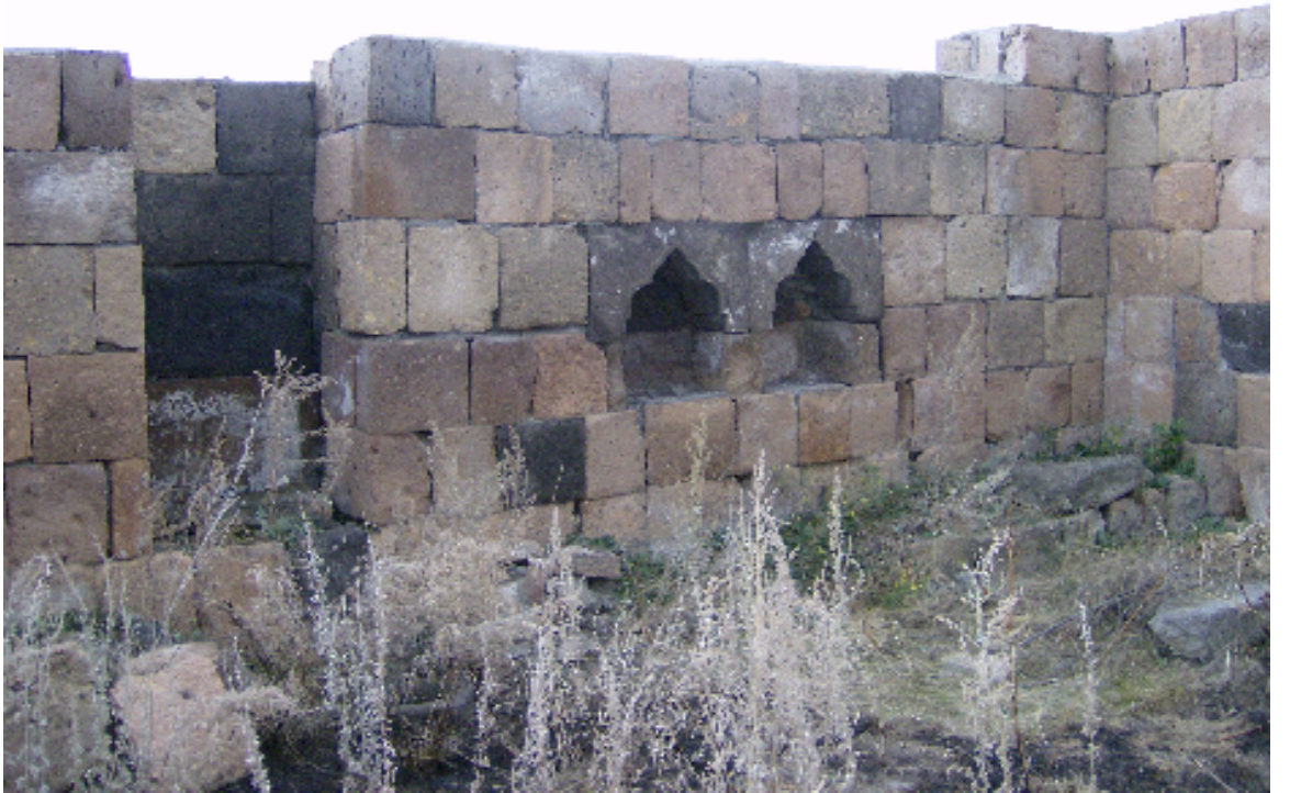
Resim 22: Konutun İçinden Bir Görünüm