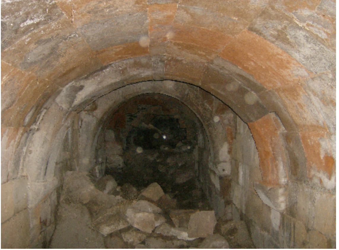
Resim 23: Konutun Altında Kiler Olarak Kullanılan Kısım