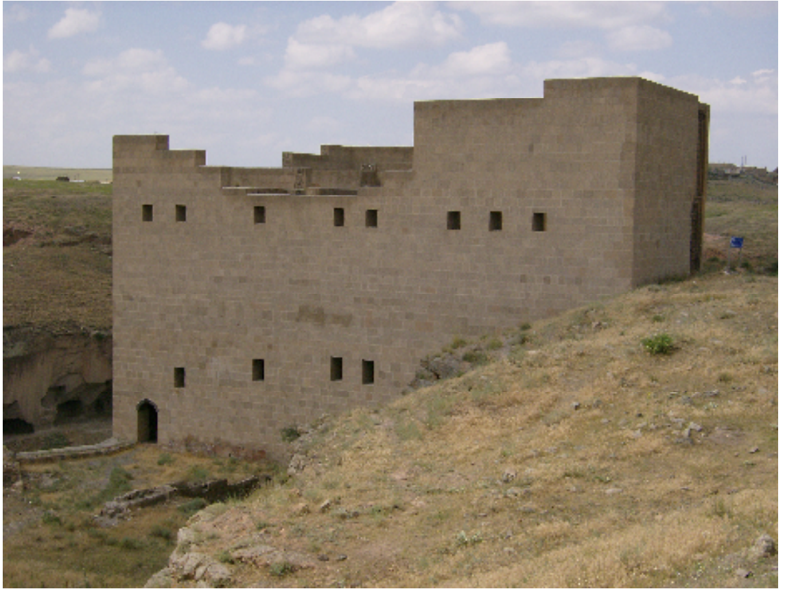
Resim 8: Şeddadi Sarayı'nın Genel Görünümü