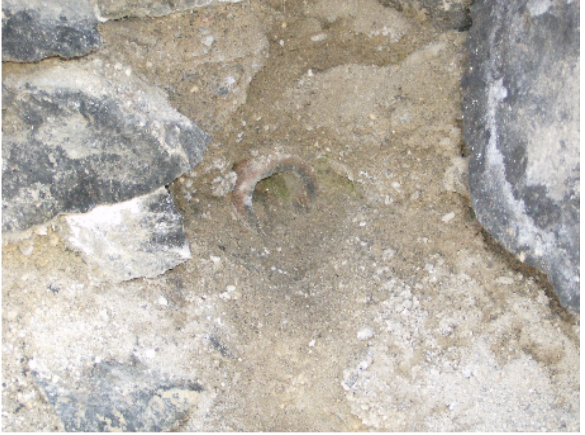
Resim 17: Küçük Hamama Su Getiren, Duvar İçindeki Künk Borulardan Biri