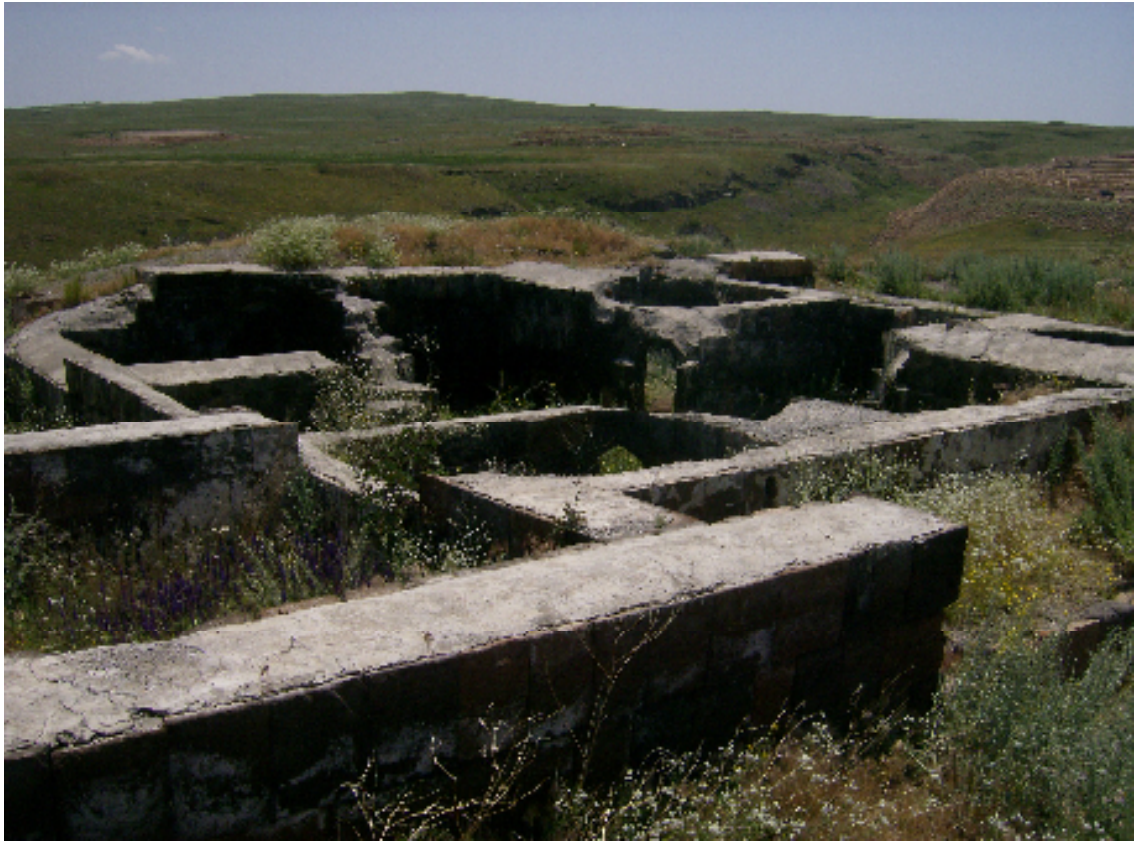
Resim 16: Küçük Hamamın Genel Görünümü