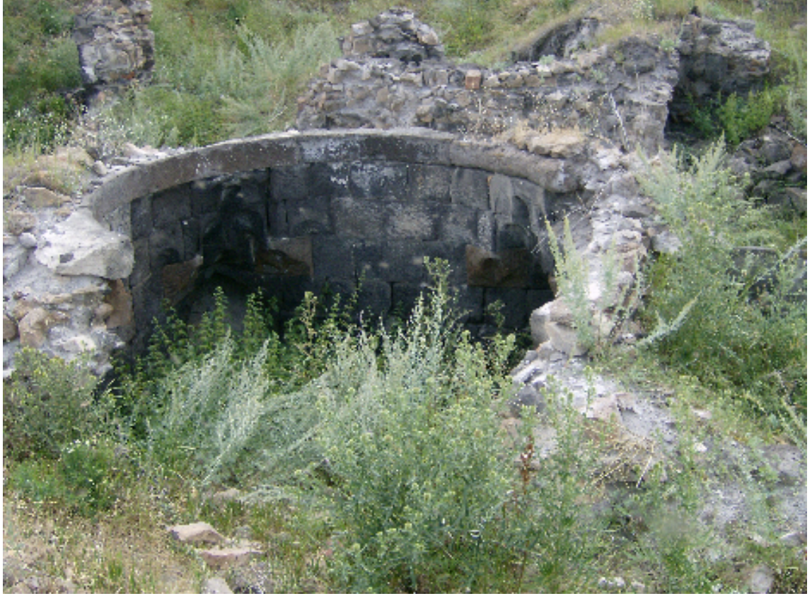
Resim 15: Büyük Hamamdan Bir Görünüm