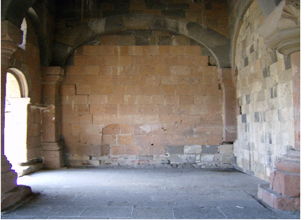
Resim 4: Menuçehr Camî'nin İçinden Bir Görünüm