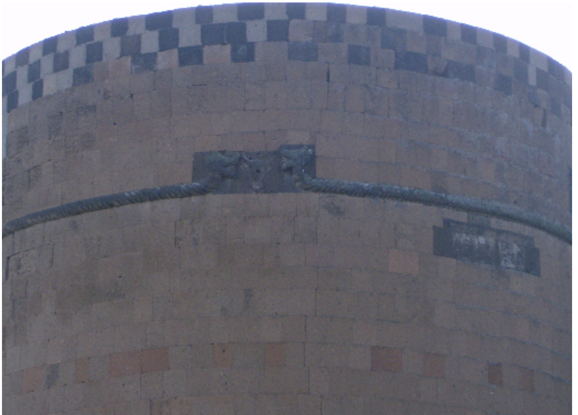
Resim 20: Menuçehr'in Yaptırılmış Olduğu Ejderha Burcu (Ani'nin Sağlık Tılsımı)