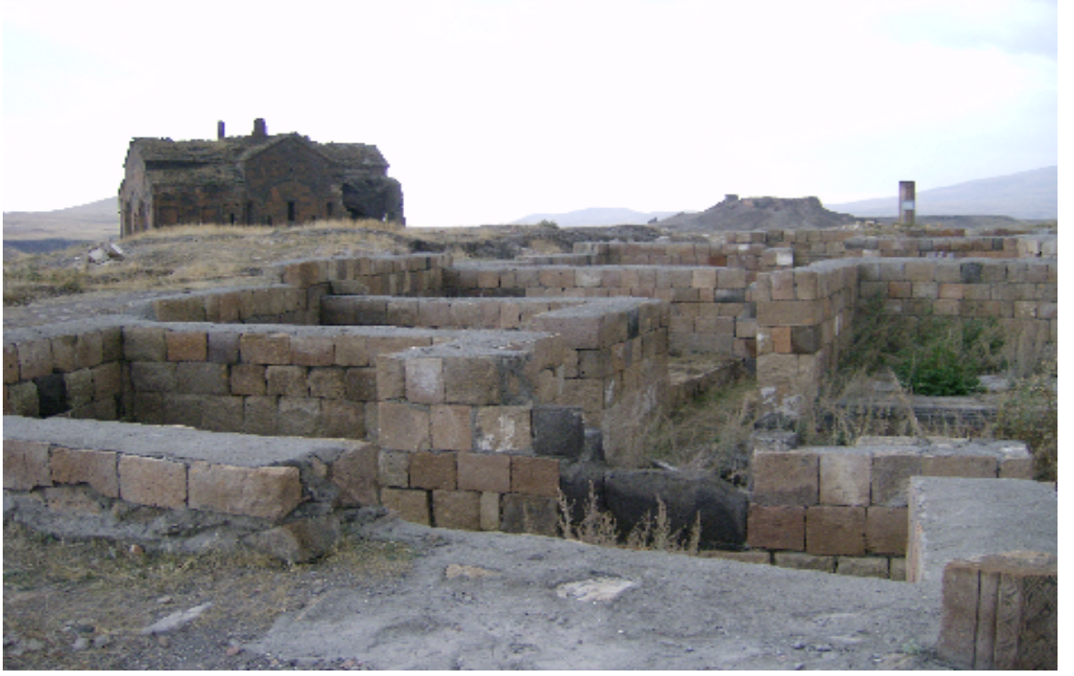
Resim 21: XII. Yüzyılda Ani'de Yapılan Konutlardan Birinin Üstten Görünümü