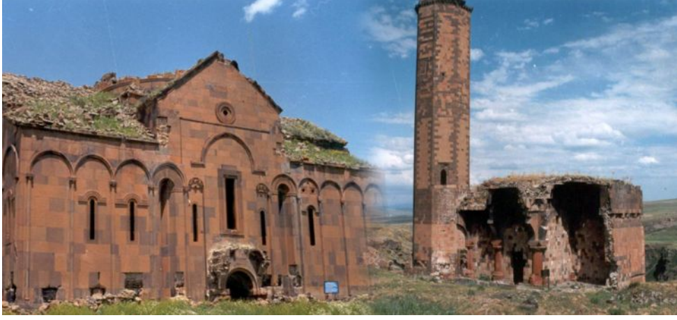
11- KANLI TABYA