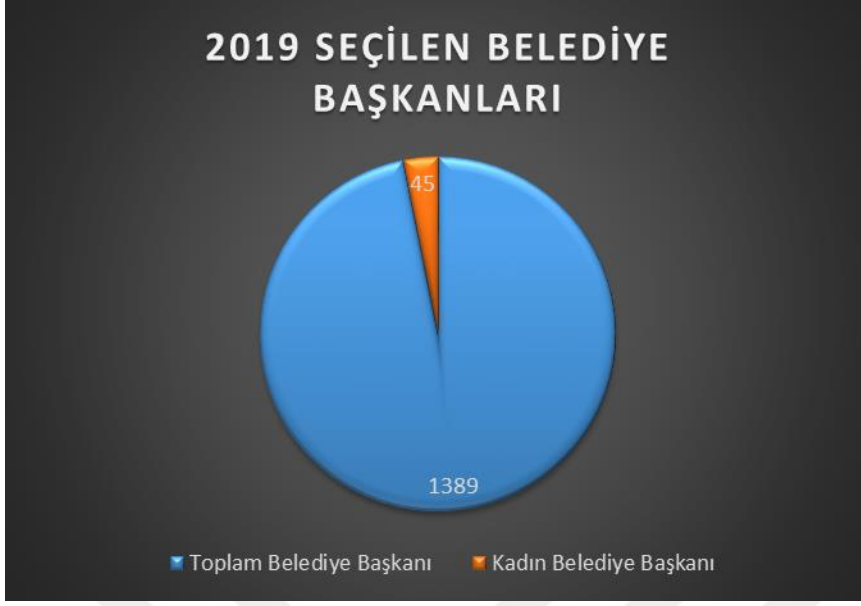
Şekil 3.3. 2019 Yerel seçimleri kadın belediye başkanları

Seçilen 45 kadın adayın, Büyükşehir düzeyinde başkanlık sayısı 3'tür. Bunların partilere dağılımına bakıldığında birinin Adalet ve kalkınma partisinden, birinin Cumhuriyet halk partisinden birinin ise Halkların demokratik partisindedir. İl düzeyinde 2 başkanlık, ilçe düzeyinde 38 başkanlık ve belde düzeyinde 2 başkanlık olarak dağılım sergilemesi İlçe Belediyelerinde kadın etkinliğinin nispeten daha iyi olduğu sonucuna götürmektedir. Ancak yüzde olarak orantılandığında %10 ile Büyükşehir düzeyinde daha yüksek sonuca ulaşılmıştır.