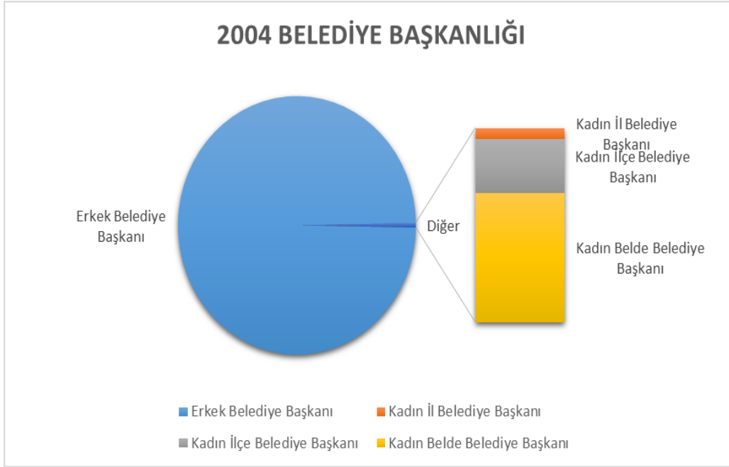
Şekil 3.1. 2004 Yerel seçimleri kadın belediye başkanları

Yukarıdaki şekilden de fark edildiği üzere 2004 yerel seçimleri tamamlandığında 18 adet kadın belediye başkanı seçildiği görülmektedir. Bunlardan yalnızca 1 tanesi il düzeyinde başkanlık elde ederken 5 tanesi de ilçe düzeyinde başkanlığa seçilmişlerdir. Sayının 18 olmasında büyük paya sahip olan belde belediye başkanlığıdır ve kadınların burada elde ettiği başkanlık sayısı 12dir.