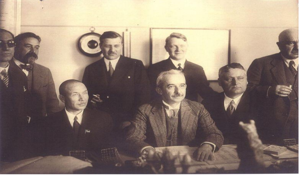
Türkiye Başbakanı İ. İnönü başkanlığındaki Türk hükümet heyetinin SSCB'yi ziyareti, 1932.