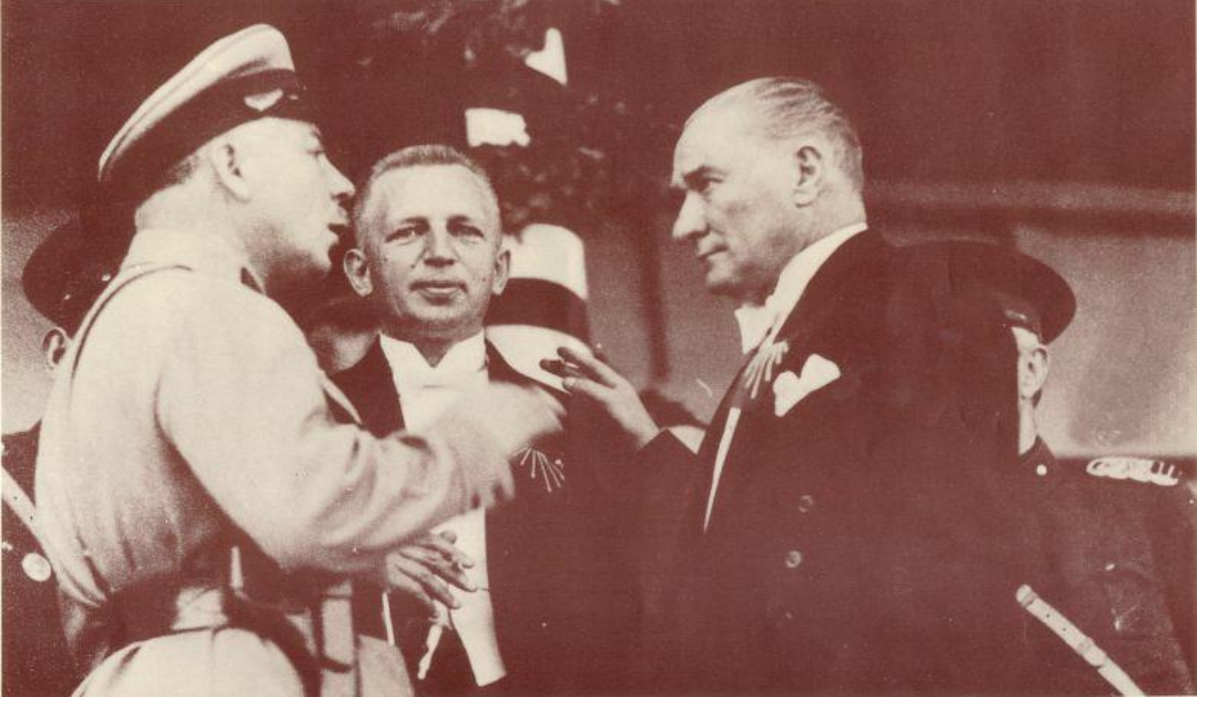
SSCB Askeri ve Deniz işleri Halk Komiseri K. E. Voroşilov başkanlığındaki Sovyet hükümet heyetinin Türkiye'yi ziyareti. M. Kemal Atatürk ve K. E. Voroşilov tribünde görüşürken, Ankara, 29 Ekim 1933.