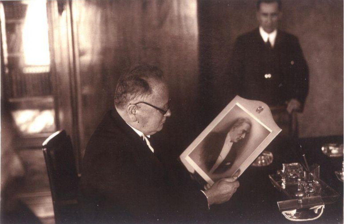
SSCB Dışişleri Halk Komiseri M. M. Litvinov'un Türkiye'yi ziyareti. M. M. Litvinov'un elinde Türkiye Cumhuriyeti Cumhurbaşkanı M. Kemal Atatürk'ün portresi, Ekim 1931.