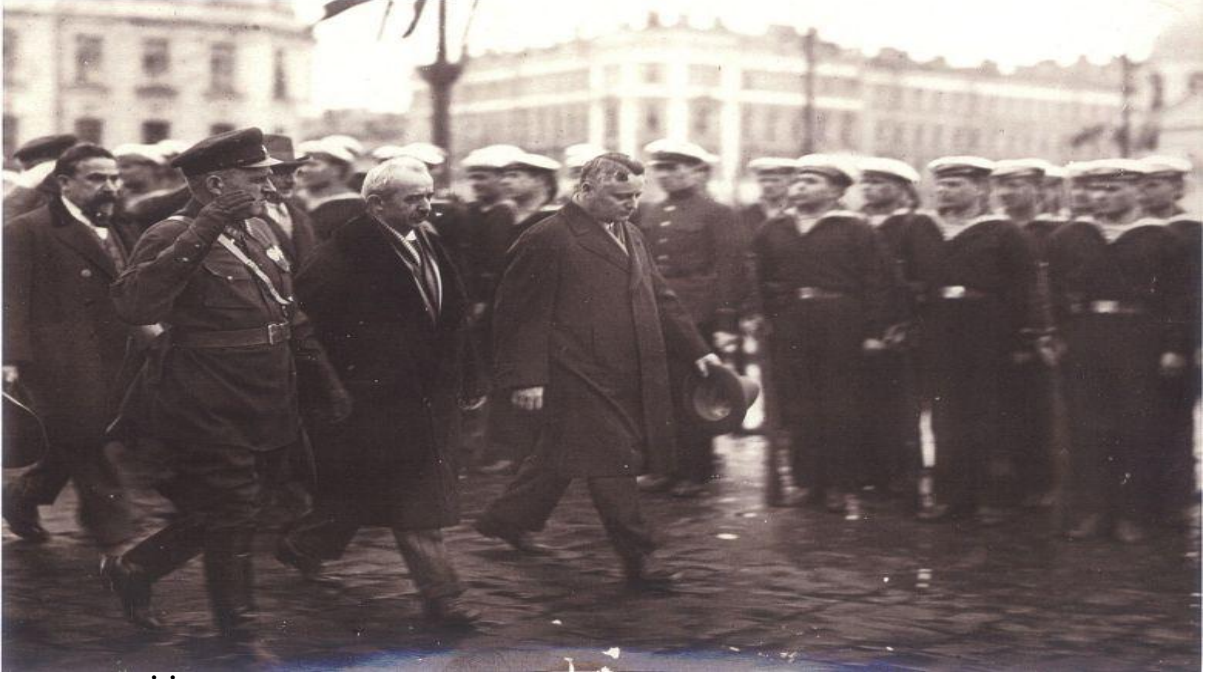
Başbakanı İ. İnönü Leningrad'ı ziyaret ederken, 1932, Solda Türkiye Dışişleri Bakanı Tevfik Rüştü Aras ve SSCB'nin Türkiye Büyükelçisi Y. Z. Surits.