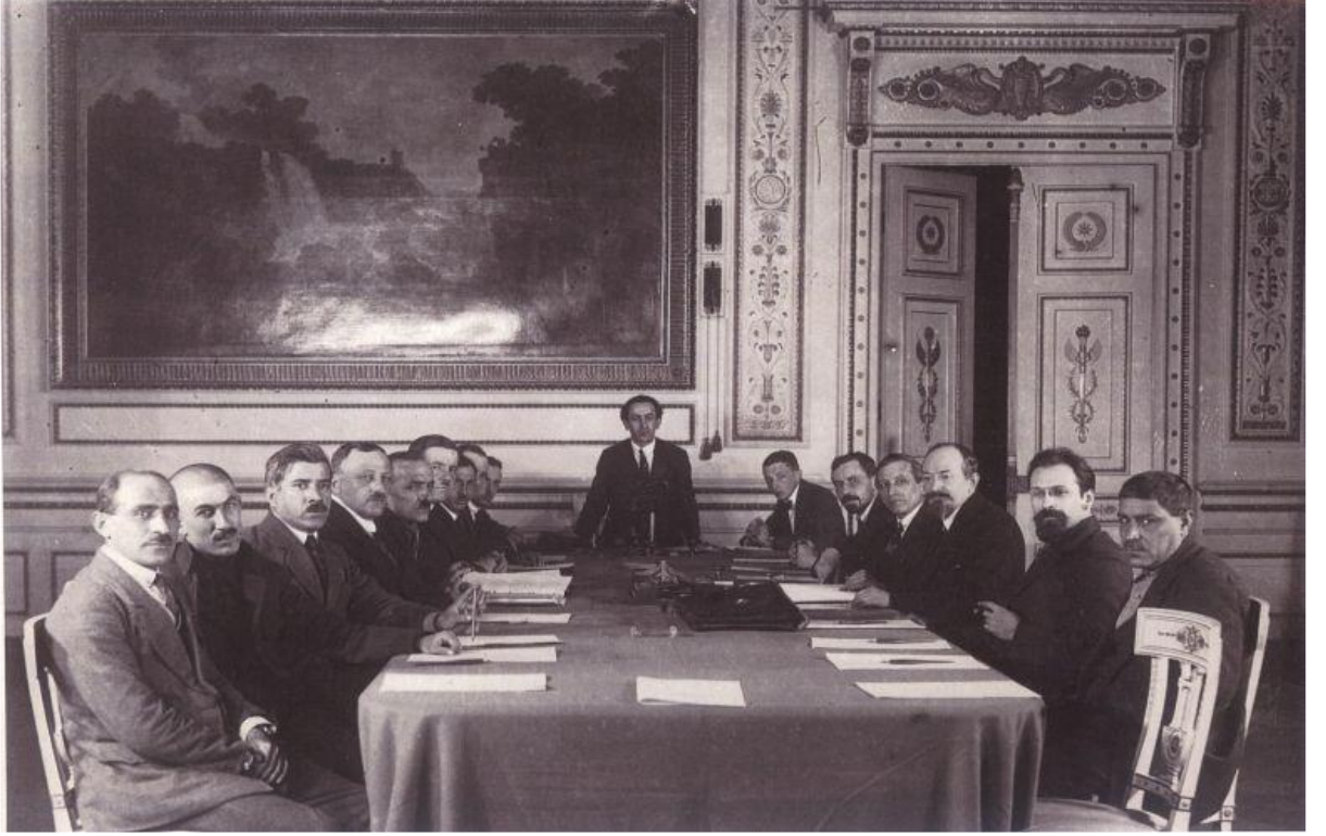
Rusya ve Türkiye arasında dostluk ve kardeşlik Antlaşması'nın imzalama töreninde, 16 Mart 1921, Moskova.