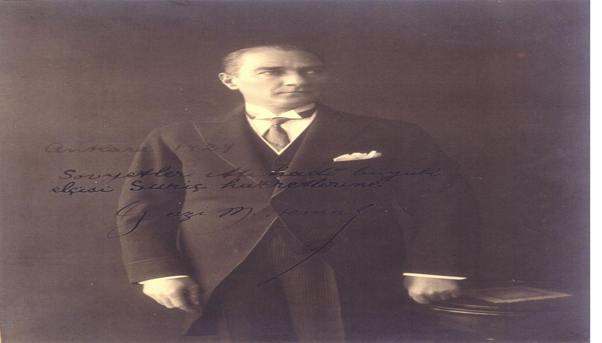
Türkiye Cumhurbaşkanı Mustafa Kemal Atatürk, "Ankara, 1929, Sovyetler İttihadi büyük elçisi Suriç Hazretlerine, Gazi M. Kemal" imzalı fotoğraf.