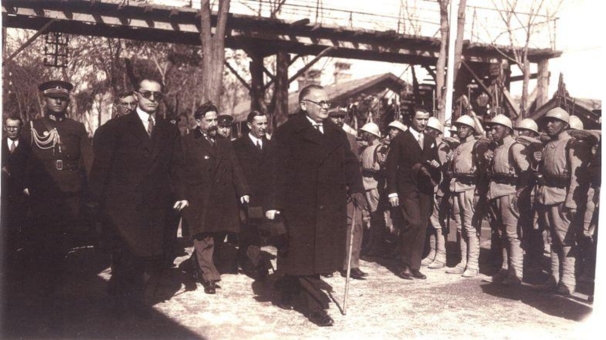
SSCB Dışişleri Halk Komiseri M. M. Litvinov'un Türkiye'yi ziyareti. M. M. Litvinov, Türkiye Dışişleri Bakanı Tefik Rüştü Aras ve SSCB'nin Türkiye'deki Büyükelçisi Y. Z. Surits onursal kıta önünden geçerken, Ekim 1931.