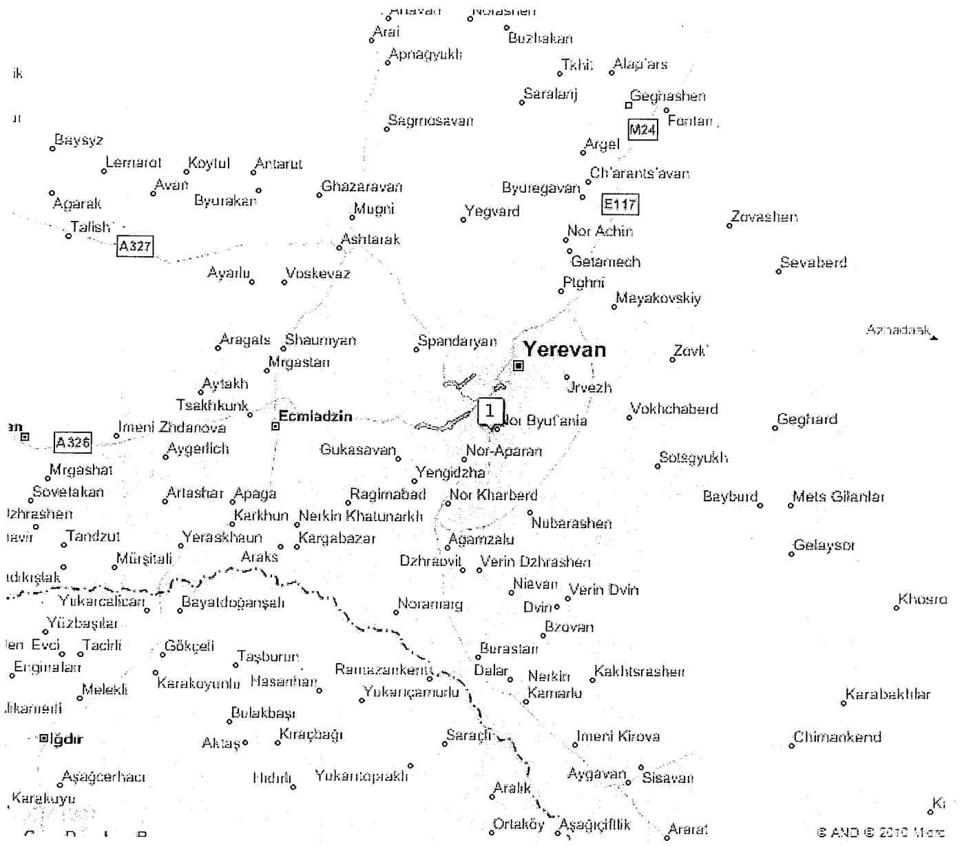
Yerevan Bölgesi Haritası