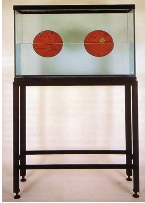
Resim 4- Jeff Koons, "Two Ball 50/50 Tank", 1985