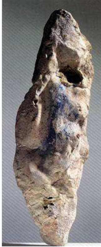
Resim 7-Soyut Özgün Form –Ewen HANDERSON

Modern seramik sanatı içinde, son yönelim olarak karşımıza çıkan ‘Seraamik Heykel’, salt ve yetkin sanat niteliğine ulaşmakla, resim ve heykel sanatının karşılaştığı estetik ve görsel plastik sorunlarıyla karşı karşıya kalmaktadır. Seraamik Heykel yöneliminde seramik artık bir malzeme niteliğiyle plastik sanatlarda yer edinmiştir denebilir. Seraamik, sadece sanatsal ileti aracı olarak malzeme niteliğiyle kullanımının yanında, ayrıca eserde verilmek istenen iletiye bağlı olarak, mesajı güçlendirmek için başka malzemelerle de kullanılır. Özellikle son yıllarda, seramiği heykele dönüştürücü ya da seramiğe özgü yöntemleri,diğer sanat dalarlıda da uygulamaya başladığı görülmektedir (Galatalı.2001. s. 47)