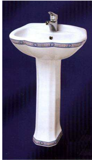
Resim 9-Endüstriyel Seramik - Lavabo

Küreselleşmenin de etkisiyle Endüstri devrimi ile seramik el sanatı-zanaatı konumundan endüstriyel seramik sanatı konumuna yönelerek yeni bir alana kavuşmuş ve endüstriyel seramik sanatı, gündelik ihtiyaca dönük işlevlere hizmet eden, tamamen seri üretime yönelik piyasa koşulları içinde gerçekleşen bir alan daha ortaya çıkar.