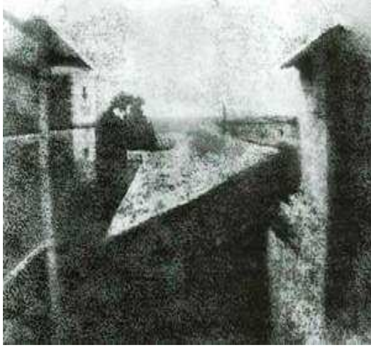
Resim 2 Joseph Nicéphore Niépce 1826 "çekilen ilk fotoğraf"

Fotoğrafın 1850'lerde yaygın olarak kullanılmaya başlanılmasının dışında, geniş kitlelerin, ürünlerin düşük nitelikli versiyonlarına ulaşmalarına olanak sağlayan röprodüksiyonlar sayesinde resim, düşük gelirli insanların evlerine de girmeye başladı.