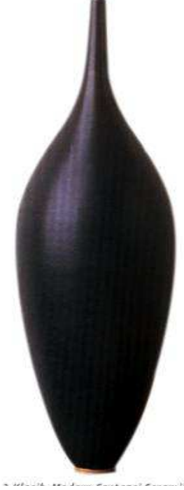
Resim 6- Klasik –Modern Sentezci Seramik –Elsa RADU

beceri sahibi, zanaatkar, usta kimliği taşır. Küreselleşmeyle birlikte ortaya çıkan modern seramik sanatçısı ise, eleştirici tavrı, biçim ve içerik yaratıcısı olarak, kendine özgü anlatım dilini oluşturmuş, gerçek sanatçı niteliğine sahiptir.