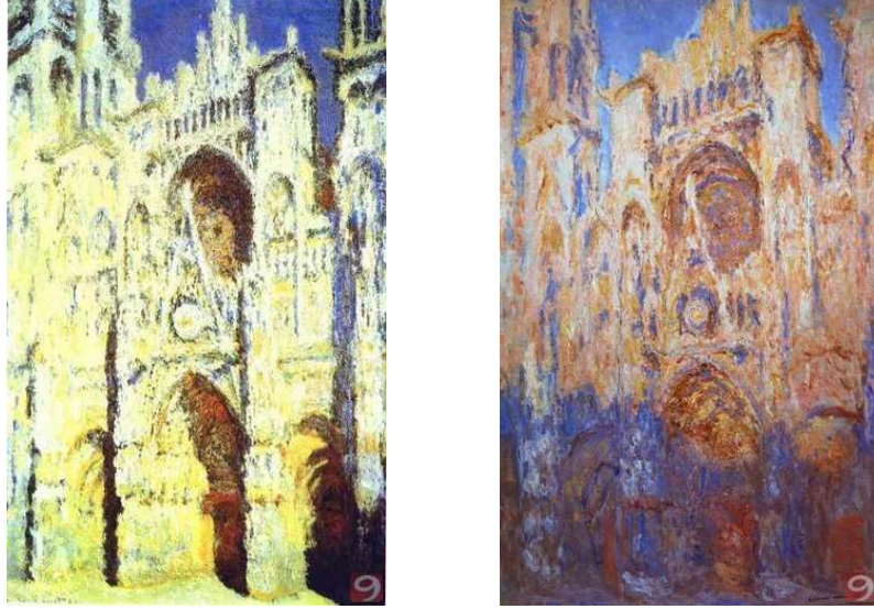
Resim 3- Rouen Cathedral Effects of Sun End of Day

Fotoğraf, aynı zamanda resmin, izleyici gözündeki anlamını da değiştirdi. Resim, bulunduğu mekanla da anlam kazanan, aynı anda iki yerde görülmesinin olanaksız olduğu ve dünya üzerinde bir tane olduğu bilinen bir şeydi. Bunlar, fotoğrafla değişti, resim artık evlere girmeye başladı, günlük hayatın bir parçası oldu (Berger, 1986, s.20)