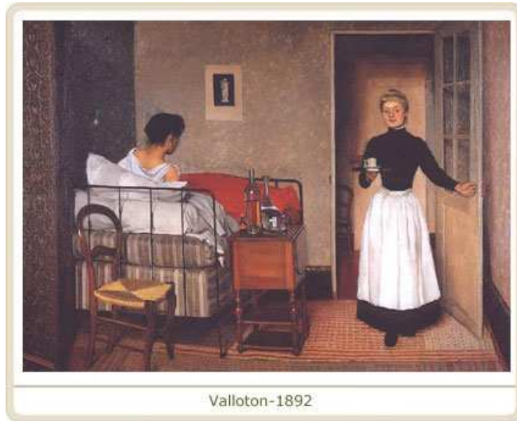
Resim 1- İlk afiş örneği

Küreselleşme ile gelişen iletişim birçok alanda olduğu gibi , sanat alanında da yenilikler getirdi. Sergiler, sanat hayatından haberlerin katkısının yanında, yeni ortaya çıkan reklam sektörüne sanatçılar hakim oldu. Reklamcılık, 1890’larda görsel sanatlarda afiş gibi yeni bir form da yarattı.