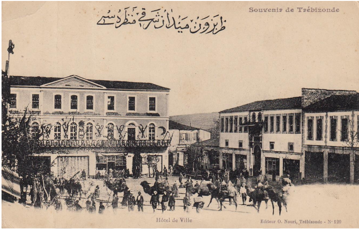
Trabzon'da Şark Meydanı'nda bir deve kervanı, 1890'lar (üstte)

Tarihi İpek yolunun başlangıcı veya bitişi, Tarih boyunca şark cephesine gönderilmek üzere askeri malzemenin çıkarıldığı Çömlekçi Limanı, 1930'lar (altta)