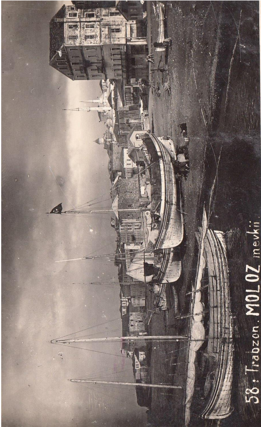
58: Trabzon. MOLOZ mevkii.