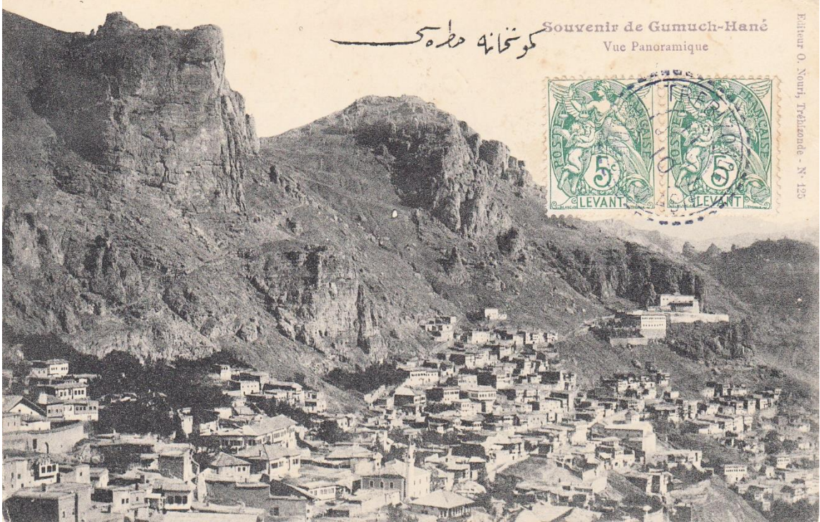
Erzurum ile Trabzon'un İpek Yolu üzerindeki bağlantı noktası Gümüşhane, 1900'ler (altta)