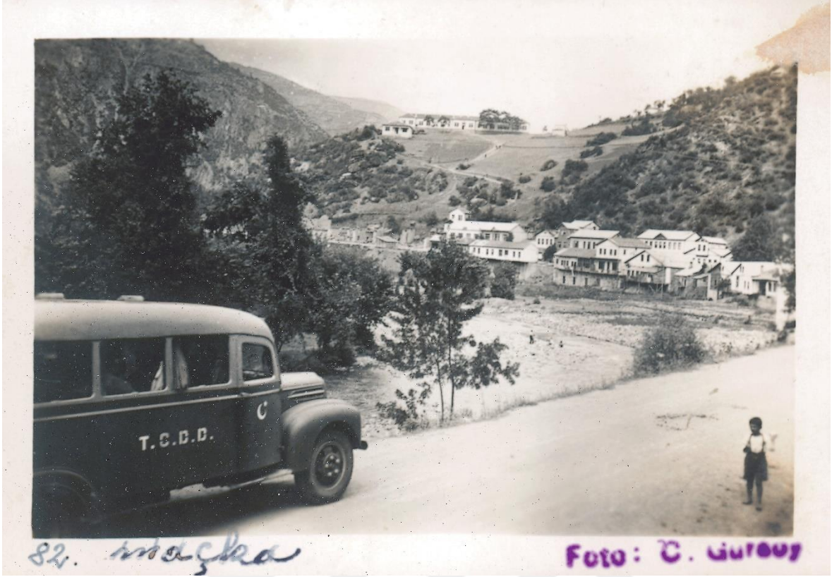
Karadeniz Sahili ile Kara Anadolu'sunun İpek Yolu üzerindeki tarihi buluşma noktası, Maçka 1930'lar (üstte)