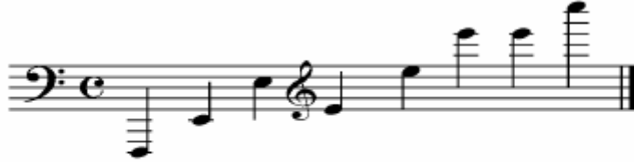
Şekil 1 Armoni Orkestrası Ses Genişliği ( Pares )

Armoni orkestrasının ses genişliği, Si b. Kontrbas Sakshornun en kalın Fa diyezinden, Do Küçük Flütün en ince Do sesine kadardır. Bütün kromatik derecelerde 6/5 oktavdır.