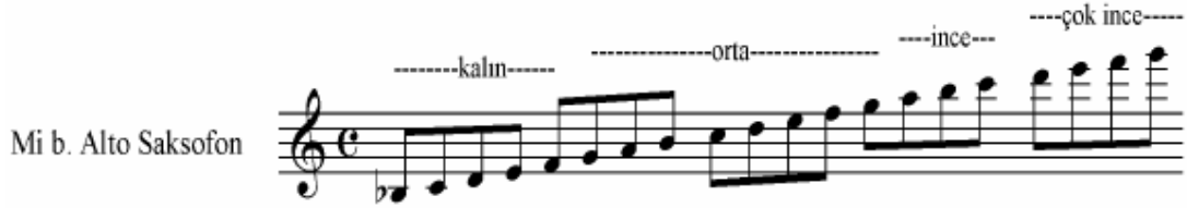
Şekil 11 Mi b. Alto Saksofon Ses Genişliği ( Çalıştır )

Diğer sazlarda olduğu gibi ses dizisi dörde ayrılır ve aşağıdaki gibidir: