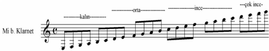
Şekil 8 Mi b. Klarnet Ses Genişliği ( Pares )

Ses dizisi genişliği bütün “kromatik” derecelerde 3 oktavdır ve aşağıda gösterilmiştir.