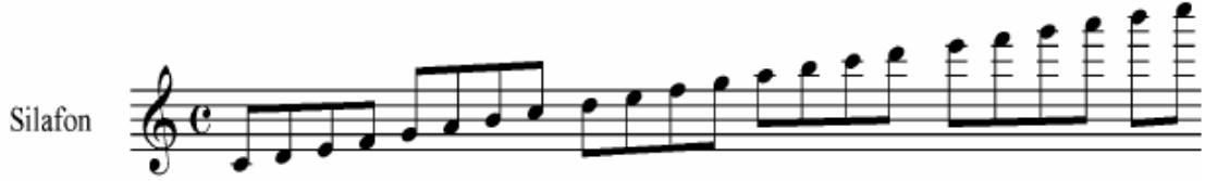
Şekil 23 Silafon Ses Genişliği ( Korsakov )

Silafon özellikle Piccolo ile kullanımı yaygın olan bir sazdır. Bunun dışındaki kullanımları tamamen bestecinin renk olarak düşündüğü noktalarda gerçekleşir (Pares 1951:110).