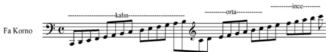
Şekil 17 Fa Korno Ses Genişliği ( Korsakov )

Ses dizisi üç bölümlüdür ve aşağıdaki gibidir: