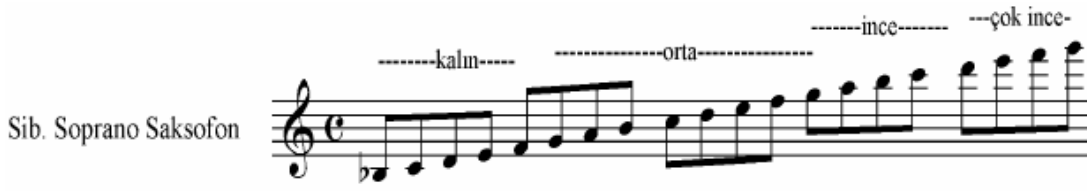
Şekil 10 Soprano Saksofon Ses Genişliği ( Çalıştır )