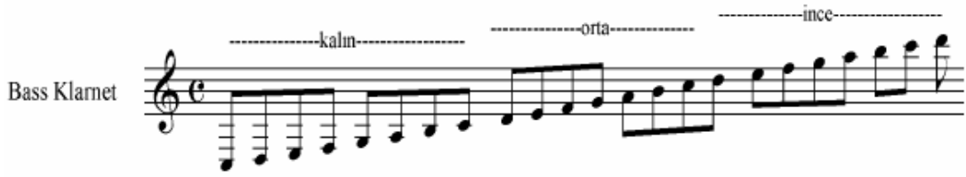
Şekil 9 Bas Klarnet Ses Genişliği ( Korsakov )

Diğer bütün Klarnetlerde olduğu gibi Bas Klarnetin ses dizisi de üç ana bölüme ayrılır.