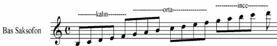
Şekil 14 Bas Saksofon Ses Genişliği ( Çalıştır )

Bas Saksofon Si b. Kontrbas ile aynı ses tınısına sahiptir. Bas Klarnetten ve Tenor Saksofondan “bir”, Si b. Klarnet ve Soprano Saksofondan “iki oktav” aşağıdan duyulur. Notası “ ikinci çizgi sol anahtarı” yazılır. Diya pazona göre “iki oktav” artı “ bir büyük ikili” aşağıdan duyulur ( Pares 1951:64 ). Ses dizisi üç bölümden oluşur ve aşağıdaki gibidir: