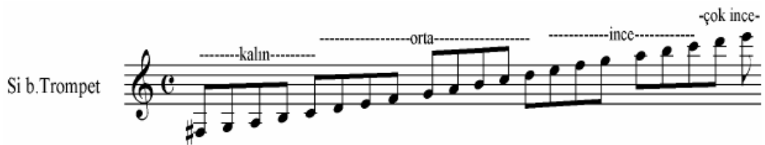
Şekil 15 Si b. Trompet Ses Genişliği

Eski Armoni Orkestralarında Fa ve Mi b. tonunda kullanılır. Trompetin yerini bugün Si b. Trompetler almıştır. Notası “ikinci çizgi sol anahtarı” ile yazılır. Diya pazona göre notası “ bir büyük ikili” aşağıdan duyulur ( Çalışır 1969:67 ). Ses dizisi genişli dört bölümdür ve aşağıdaki gibidir: