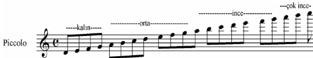
Şekil 4 Piccolo Ses Genişliği ( Korsakov )

Küçük Flütün tutuş, çalış durumu ve aranan özellikleri Büyük Flüt gibidir. Bu çalgı yapılışı bakımından büyük flütle aynı özellikleri taşır. Yalnız perde delikleri daha küçüktür ( Çalşır 1969:12 ). Büyük Flüte göre bir oktav ince olan bu saz, aşağıdaki ses dizisi genişliğine sahiptir.