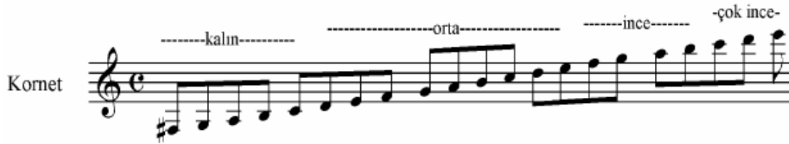
Şekil 16 Kornet Ses Genişliği ( Korsakov )

Kornetler Si b. tonunda imal edilir. “İkinci çizgi sol anahtarı” ile yazılır. Diyapazona göre duyuluşu “bir büyük ikili” aşağıdandır ( Çalışır 1969:70 ). Kornetin ses dizi genişliği aşağıdaki gibidir: