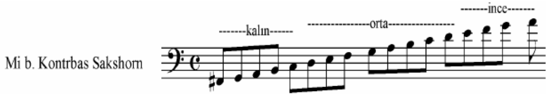
Şekil 22 Mi b . Kontrbas Sakshorn ( Pares )

Mi b Kontrbas Sakshorn yada yalnızca Mi b. Kontrbas, Si b. Basların “bir beşli” altından duyulur. Notası “dördüncü çizgi fa anahtarı” ile yazılır ( Çalışır 1969:1969 ). Ses dizisi genişliği aşağıdaki gibidir: