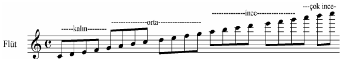
Şekil 3 Flüt Ses Genişliği ( Korsakov )