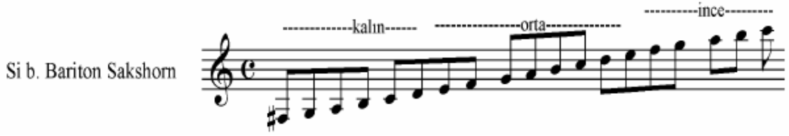
Şekil 20 Si b. Bariton Sakshorn ( Pares )

Sesi Baritona denk gelen ve mekanizma olarak Si b. Büğlünün aynısı olan bu enstrümanın Armonide kullanım şekilleri Pares' e (1951) göre şöyledir: