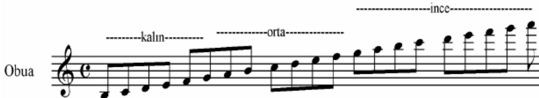
Şekil 5 Obua Ses Genişliği ( Korsakov )

Obuanın tonu Do’dur. Ses genişliği aşağıdaki gibidir: