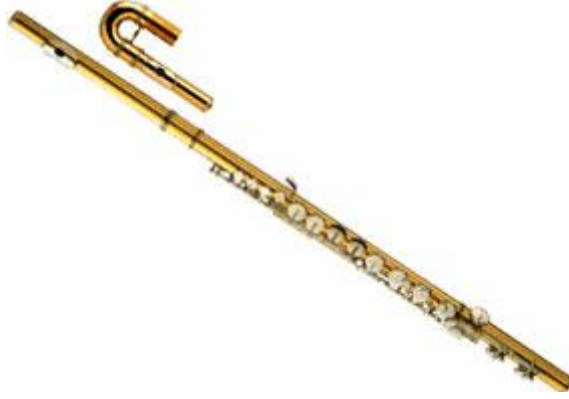
Resim 4 Alto Flüt

Alto flüt soprano flütten biraz daha uzundur ve daha kalın bir sese sahiptir. Diyaazona göre dörtlü aşığıdan tınlar, sol anahtarı kullanılır. Daha çok flüt toplulukları ve bandolarda kullanılan bir çalgıdır.