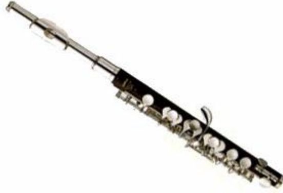
Resim 2. Piccolo (Küçük Flüt)

Flüt ailesi dört çeşit flütten oluşmaktadır. Bunlar küçükten büyüğe; piccolo (küçük flüt), soprano flüt, alto flüt ve bas flüttür. Müzik öğretmeni yetiştiren kurumlarda yaygın olarak kullanılan flüt çeşidi soprano flüttür. Piccolo flüt, flüt ailesinin en küçük üyesidir. Soprano flütün yarısı kadar bir uzunluktadır. Uzunluğu 31,3 cm. çapı ise 1,1 cm.dir. 17 Orkestranın en tiz sesli çalgısıdır. Sol anahtarı kullanılır. Diyapazona göre bir oktav üstten duyulur. Yaygın olarak orkestra ve bandolarda kullanılır.