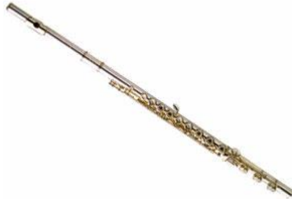
Resim 3 Soprano Flüt

Soprano flüt, günümüzde, özellikle müzik eğitiminde yaygın olarak kullanılan flüt çeşididir. Sol anahtarı kullanılır. Tınısı diyapazonla aynıdır. Orkestra ve bandolarda kullanılmasının yanı sıra, iyi bir solo çalgı görevini üstlenmektedir.