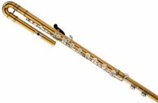
Resim 5 Bas Flüt

Bas flüt, flüt ailesinin en kalın sesli üyesidir. Diyaazona göre bir oktav aşığıdan tınlar. Sol anahtarı kullanılır. Alto flüte benzer olarak flüt toplulukları ve bandolarda kullanılan bir çalgıdır. 18 Alto ve bas flüt, piccolo ve soprano flüte göre daha az yaygındır. Günümüz senfoni orkestralarında ve müzik eğitimi veren kurumlarda piccolo ve soprano flüt kullanılmaktadır. Alto ve bas flütün ise caz gruplarında ve flüt topluluklarında kullanıldığı görülmektedir.