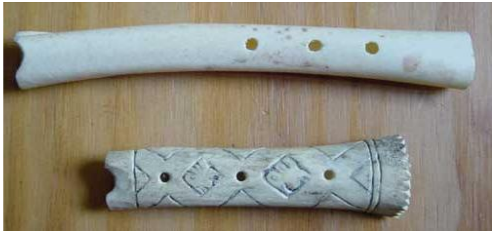
Resim 1 İlk Flüt Örneği

yy.lardan kalma birkaç kemik flüt örneği bulunmuştur. 7 Flüt ile ilgili eski çağlara dayanan bu bulgular, flütün insanlık tarihi kadar eski bir çalgı olduğunu göstermektedir (Gençel,2005).