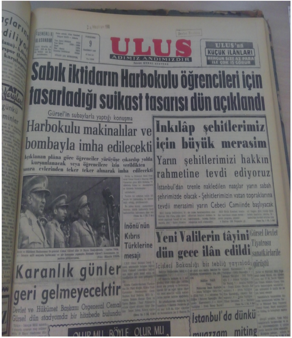
EK-4; Ulus, 9 Haziran 1960, s.1.