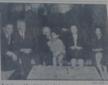
İnönü sergide - Başbakan İnönü, olayları evinden izledi, zaman zaman komutanlar kendisine bilgi verdi.

Başbakan İnönü, olayları evinden izledi, zaman zaman komutanlar kendisine bilgi verdi. Başbakan İnönü, olayları evinden izledi, zaman zaman komutanlar kendisine bilgi verdi.