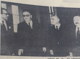
SUNAY DP İLERİLE GÖRÜŞTÜ

Ortak Pazar az gelişmiş ülke olmaya karşı çıktı