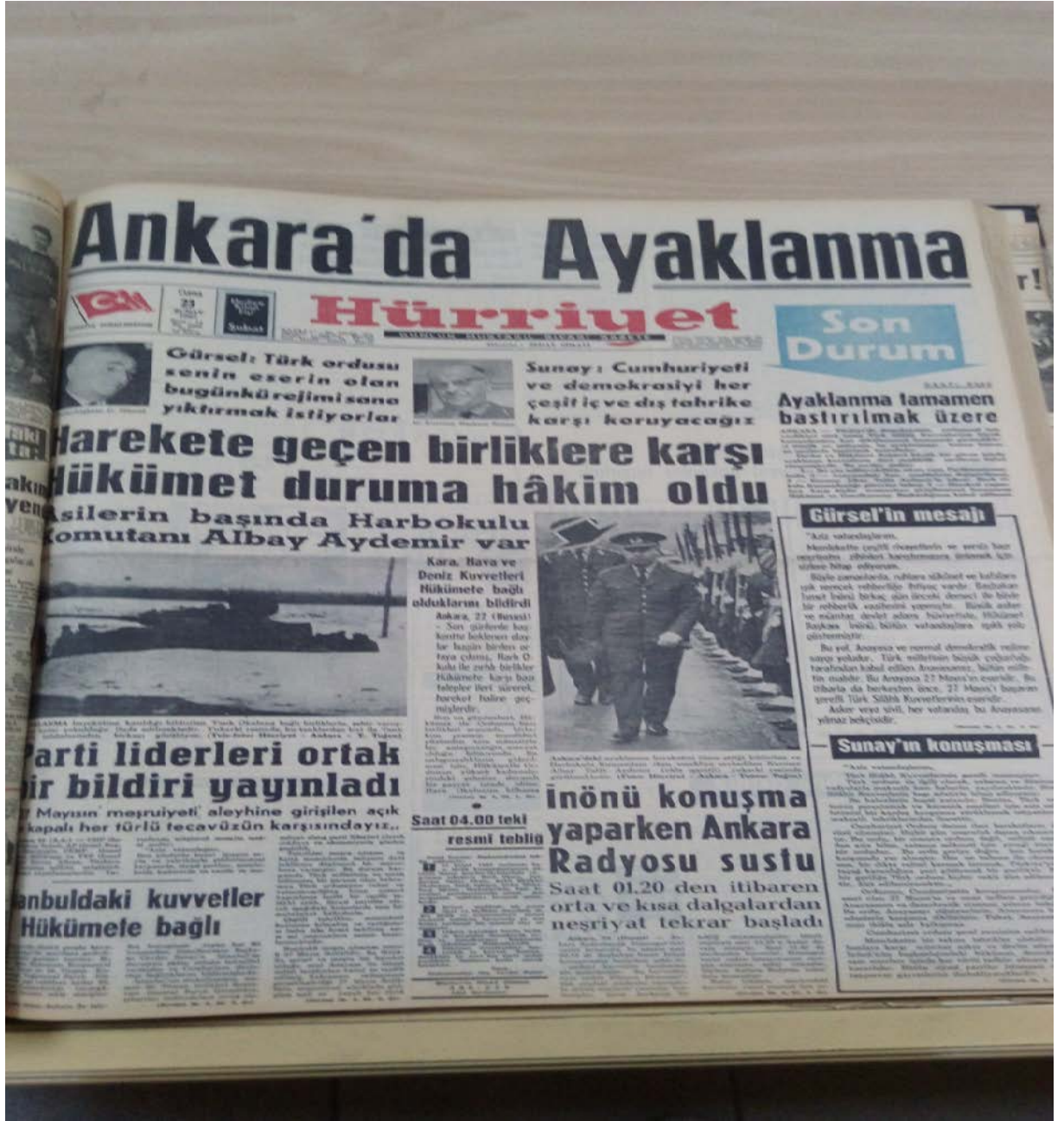
EK-7; Hürriyet, 23 Şubat 1962, s.1.