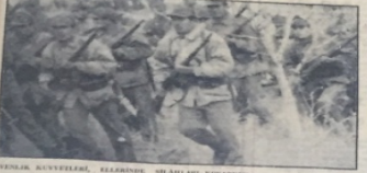
ELİFİDAR KUVVETLERİ, ELİZİNDİ SİBAHILARI MİNİNDİ...