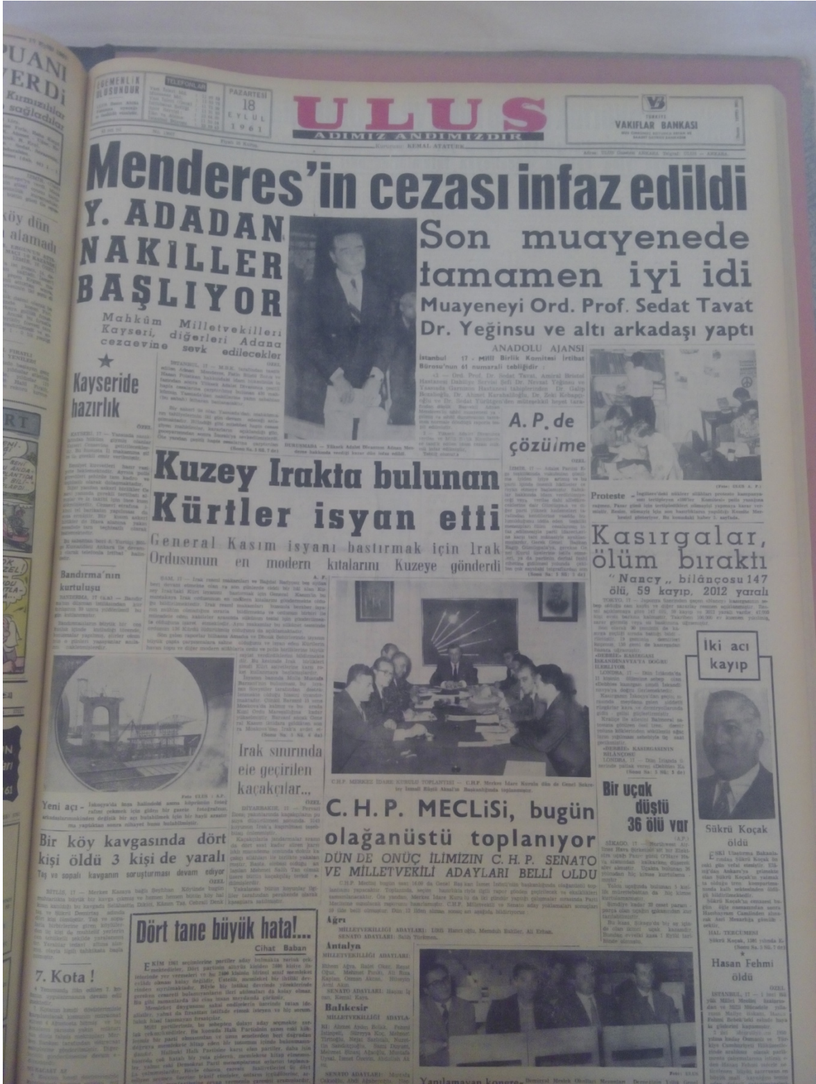
EK-6; Ulus, 18 Eylül 1961, s.1.