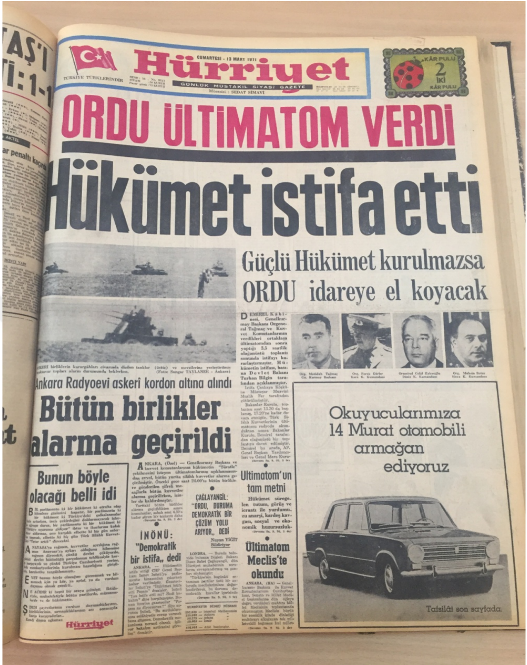
EK-12; Hürriyet, 13 Mart 1971, s.1.