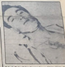
Erkek Teknikçi 3 yaralı — Ankara Erkek Teknikçi, Erkek Teknikçi, Erkek Teknikçi...

İSTANBUL HABER SERVİSİ A... (Text continues with details of the bank robbery)