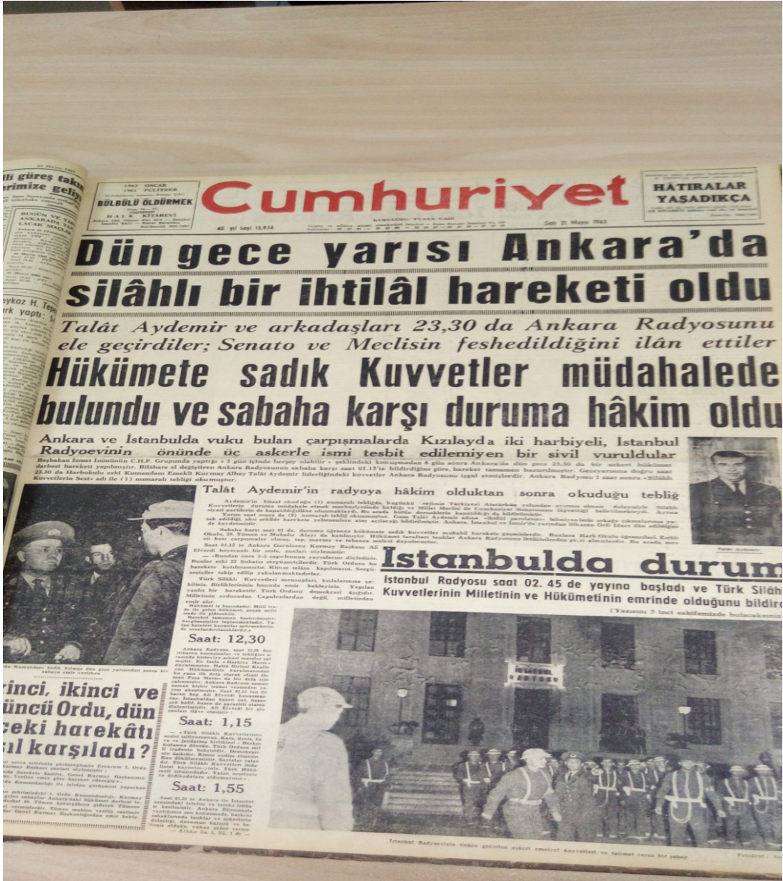
EK-8; Cumhuriyet, 21 Mayıs 1963, s.1.