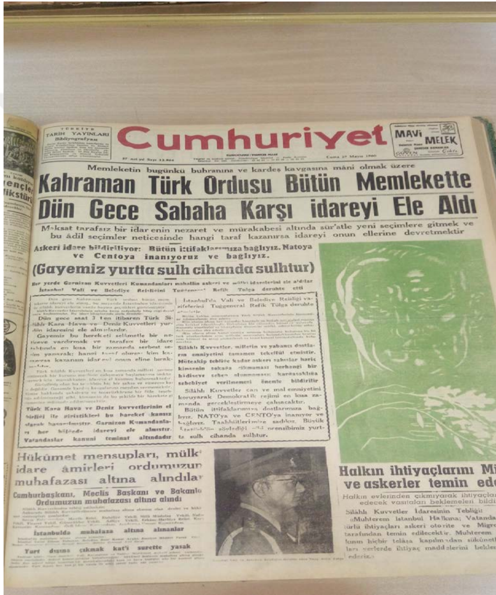
EK-1; Cumhuriyet, 27 Mayıs 1960, s.1.