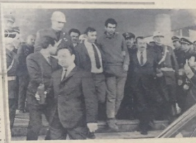
EMNİYET SARAYINDAN BOYLE ÇIKARILDI

ANKARA, 18 MART (TAN) - Başbakan Erim, dün gece Ankara'ya çağrılarak, İnönü'ye istifasını bildirdi. Erim, İnönü'ye giderek, istifasını bildirdi. İnönü, Erim'in istifasını kabul etmediğini bildirdi.