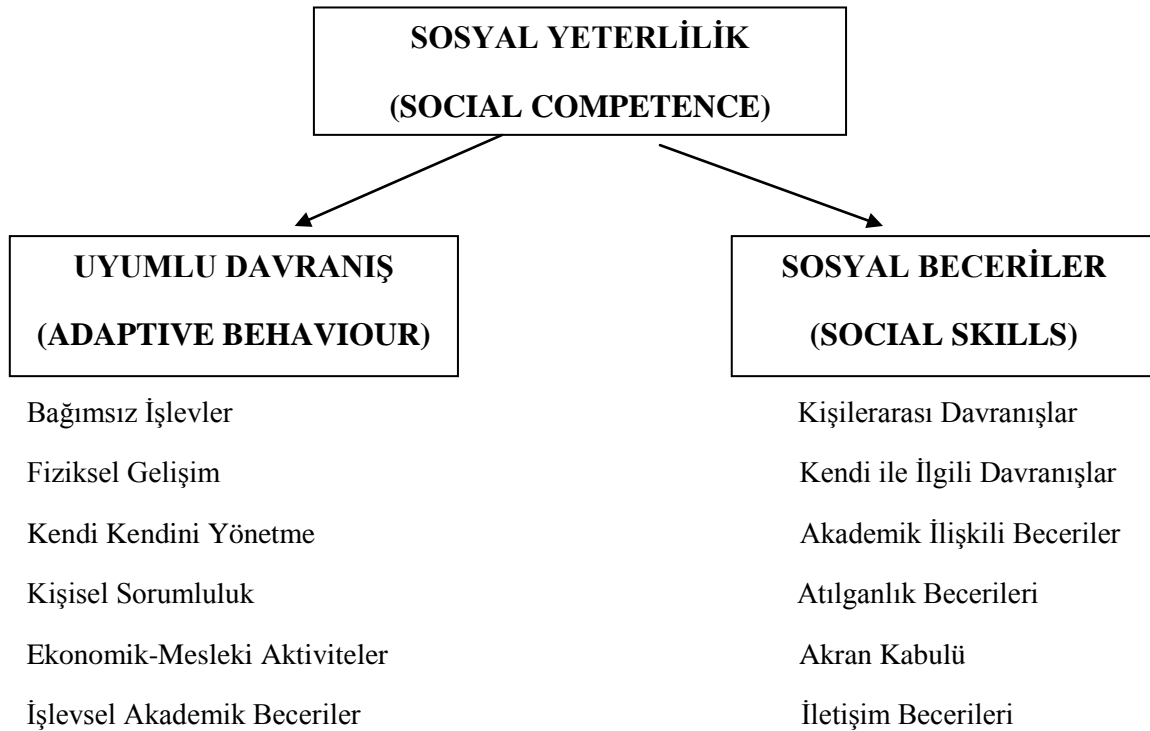
Şekil 1. Sosyal Yeterliliğin Kapsamı (Gresham ve Elliott, 2001:169).

Sosyal yeterlilik, insan gelişiminin birbiriyle bağlantılı iki yönünü tanımlamaktadır. Bunlardan ilki başkaları tarafından sevmek iken, ikincisi sosyal ortamlarda etkin bir şekilde iletişim kurmaya olanak sağlayan becerilere sahip olmaktır (Trawick Smith, 2006:300).