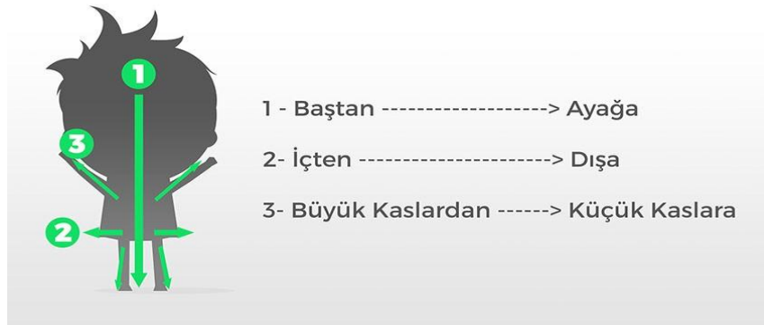
Resim 1. Psikomotor gelişimin temel mantığı.

Psikomotor gelişim, merkezi sinir sisteminin gelişmesiyle birlikte aynı ölçüde fiziksel büyüme ve sinir sisteminin gelişmesine bağlı hareketlilik kazanması olarak tanımlanmaktadır. Bir başka anlatımla, becerilerin temelinde hareket olan yönlerini ele alan ve doğumdan önceki zaman diliminden başlayıp yaşam boyu devam eden bir süreci ifade etmektedir. Yaşam boyu devam eden sürece yönelik iki hareket türü kazanılır. Bu zaman diliminde büyük ve küçük kas hareketleri olmak üzere tanımlayabiliriz. Büyük kas hareketini bedeni kullanmaya yönelik, küçük kas hareketine yönelik ise nesne kullanmaya yönelik olarak tanımlanır. Bu gelişim bireyde baştan ayağa, merkezden dışa doğru ve büyük kas, küçük kas gelişimi olmak üzere incelenir (MEB, 2013).