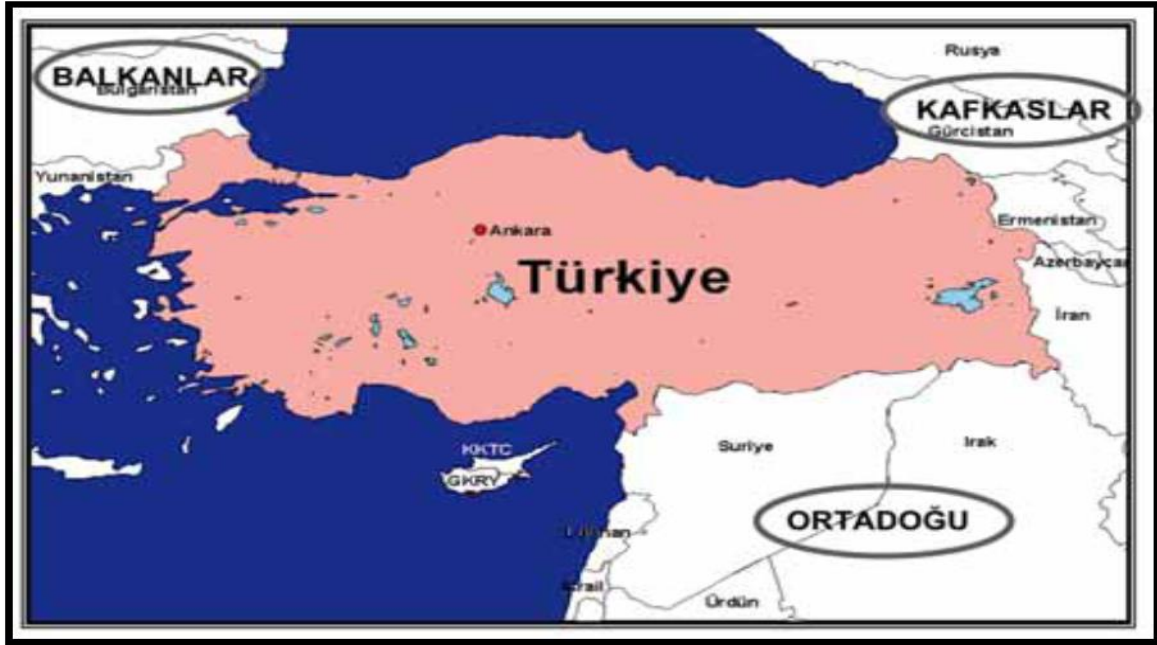
Şekil 5. Türkiye'nin jeopolitik konumu (Adaklı, 2014)

"Türkiye'nin Jeopolitik Konumu" ile ilgili belirlemeler Şekil 5.'de yer almaktadır.