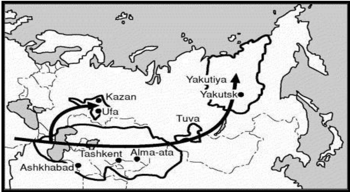
Şekil 4. Aleksandr Dugin'e göre Pan – Türkçü tehlike (Yılmaz, 2009)

"Aleksandr Dugin'e Göre Pan – Türkçü Tehlike" ile ilgili belirlemeler Şekil 4.'de yer almaktadır.