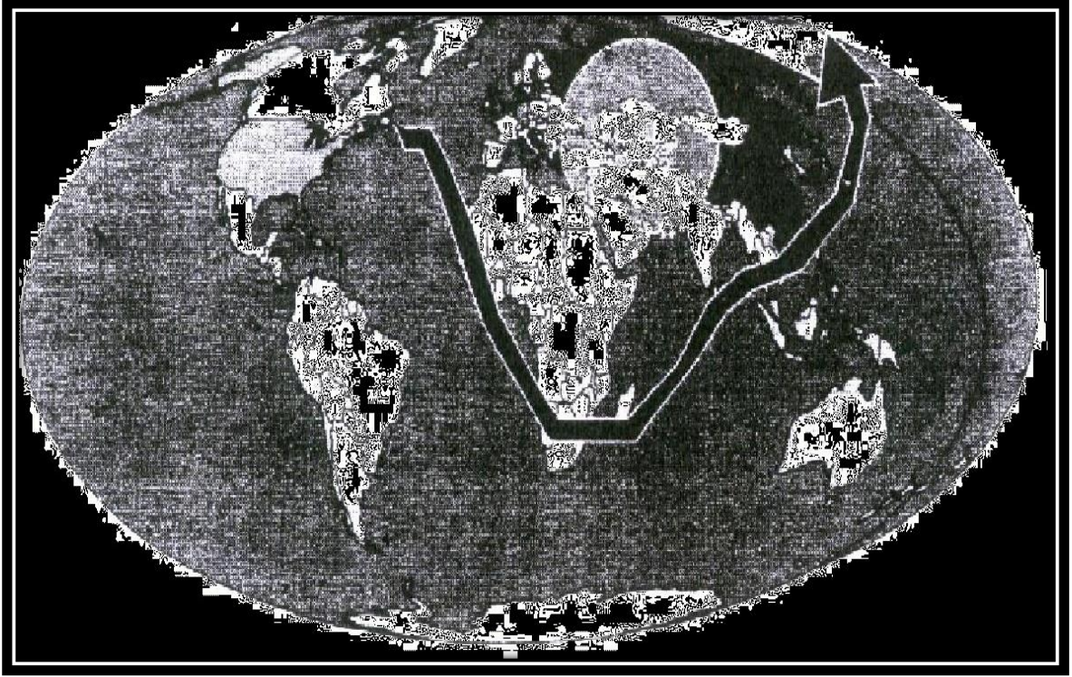
Şekil 3. Mahan'ın Deniz Hâkimiyet Teorisi kapsamında önemli gördüğü denizyolları ve su geçitleri (Arslan ve Karadoğan, 2004)

Bu temelde Mahan'ın Deniz Hâkimiyet Teorisi bağlamındaki düşünceleri; özellikle de deniz hâkimiyeti konusunda İngiltere ile mücadele edebilmek adına ve teritoryal ve ticari yayılma politikasına hizmet etmek amacıyla, Theodore Roosevelt Dönemi'nde ABD'nin büyük filolar inşa etmeye başlamasının temelini oluşturmuş ve ABD'nin bu yöndeki siyasi girişimlerinin de teorik altyapısına yerleştirilmiştir (Tezkan ve Taşar, 2013, s. 27).