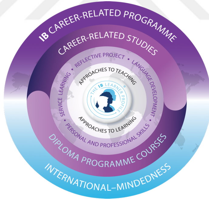
Şekil 4. UB Kariyer Odaklı Program (International Baccalaureate Organization, 2007).

Kariyer Odaklı Sertifika Programı, 16-19 yaş arasındaki öğrencilere yönelik bir program olarak tanımlanmakta ve öğrencileri kendi hayatlarında tercih ettikleri yollara hazırlamayı amaçlayan bir program olarak nitelendirilmektedir (International Baccalaureate Organization, 2015). Kariyer Odaklı Programda, UB'nin vizyonunu ve eğitim ilkelerini, barındırdığı görülmektedir. Kariyer Odaklı Programın esnek bir eğitim anlayışı vardır. Okullar öğrencilerin gereksinimlerine uygun olarak tasarlanır. Her okul kendi Kariyer Odaklı Programını oluşturur (International Baccalaureate Organization, 2015).