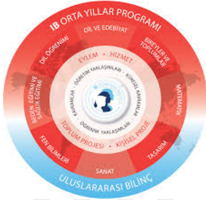
Şekil 2. Uluslararası Bakalorya Orta Yıllar Programı (International Baccalaureate Organization, 2007).

UB Organizasyonu'nun Orta Yıllar Programı'nda projelerin önemli bir yer tuttuğu görülmektedir. Projeler, öğrencilerin programda öğrendiklerini göstermelerine olanak sağlayan etkinlikler olarak değerlendirilmektedir. Projeler, okulların Orta Yıllar Programı'nın kaçınılmazını uyguladıklarına göre çeşitlenmektedir. (Büyükgeç, 2014).