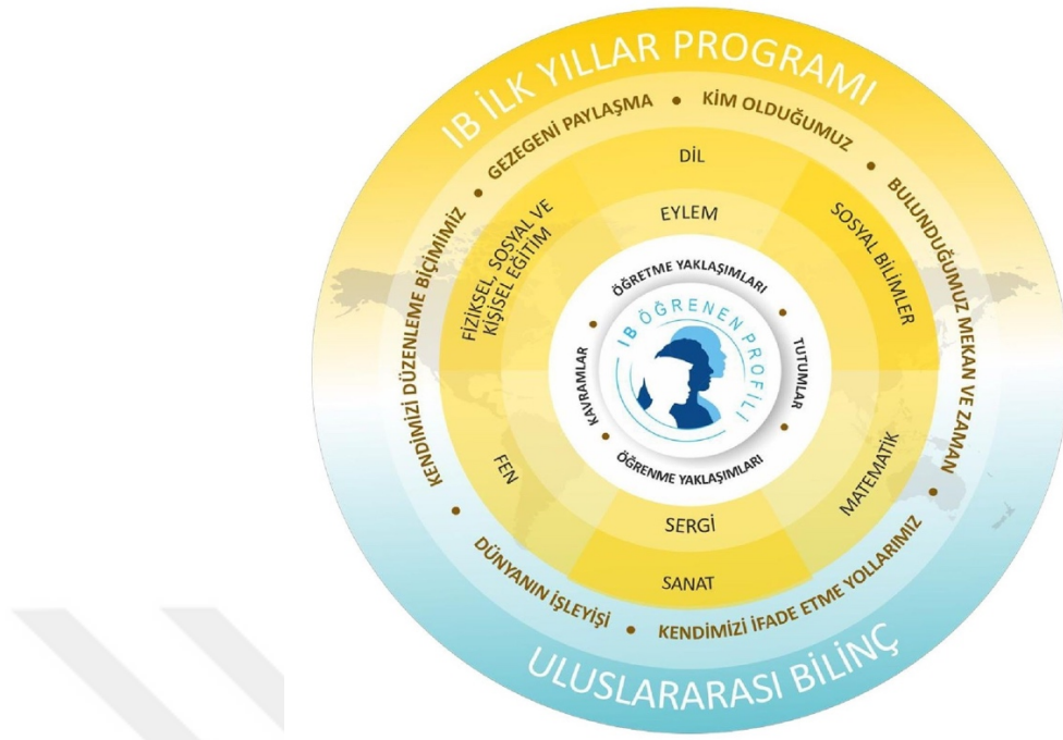
Şekil 1. Uluslararası Bakalorya İlk Yıllar Programı (International Baccalaureate Organization, 2007).

Programda bu altı dersin altında başka altı tema daha bulunmaktadır. Bu temaların amacı öğrencilerin uluslararası bilince sahip olup dünyaya açılmalarını sağlamaktır. Bu altı tema,