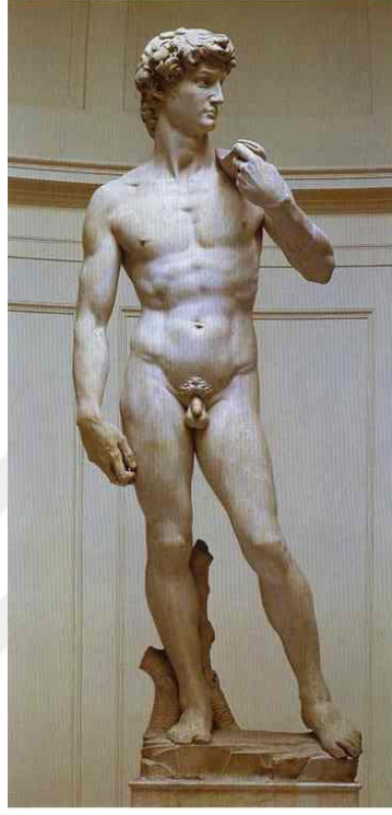
Şekil 5. Michelangelo, Davut Heykeli, 1501-1504