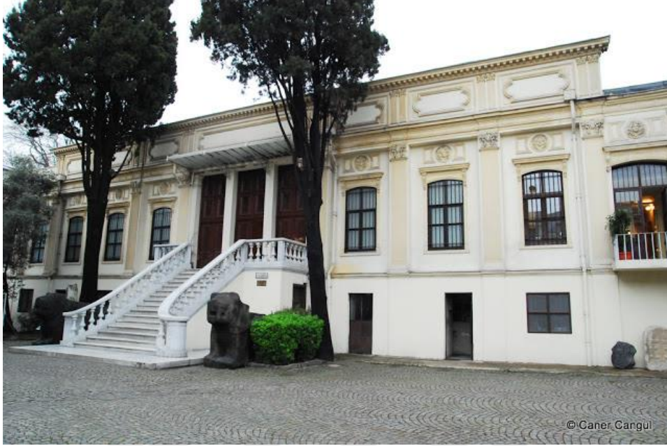
Şekil 1. Sanayi-i Nefise Mektebi İlk Binası (Günümüzde Eski Şark Eserleri Müzesi olarak kullanılmaktadır)