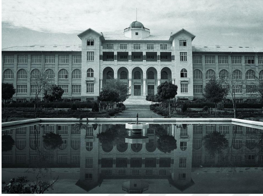
Şekil 2. Gazi Eğitim Enstitüsü (Temeli 1927’de atılan bina günümüzde G. Ü. Rektörlük binası olarak kullanılmaktadır)

1927 yılında Sanayi-i Nefise Mektebi’nin adı Güzel Sanatlar Akademisi olarak değiştirilir. Cumhuriyetin ilanından sonraki on beş yıl Milli Eğitim Bakanlığının Güzel Sanatlar Akademisine yönelik icraatları yukarıya yönelik düz bir çizgi biçiminden daha ziyade aşağı yukarıya zikzaklar şeklinde olmuştur. Bu durum Güzel Sanatlar Akademisine alınacak öğrenci şartlarını da etkilemiştir. Ülkede liseden ziyade ortaokulun bile çok az sayıda öğrenci mezun ettiği o dönemde Akademi’ye girecek olan öğrencilerin lise mezunu olmalarında ısrar edilmesi Akademinin öğrencisiz kalma sonucunu doğurabileceği düşüncesiyle 1924’te alınan yeni bir karar ile Akademiye alınacak öğrencilerde aranan şartlar şu şekilde düzeltilir (Cezar,1983, s.22).