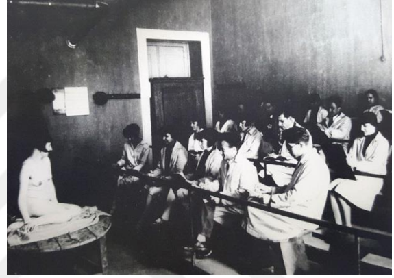
Şekil 6. Sanayi-İ Nefise Mektebinde İbrahim Çallı Atölyesi ve Model, 1928.