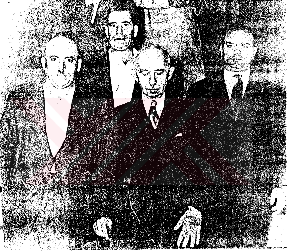
İsmet İnönü bir İzmir seyahatinde Necdet Öklem'le birlikte