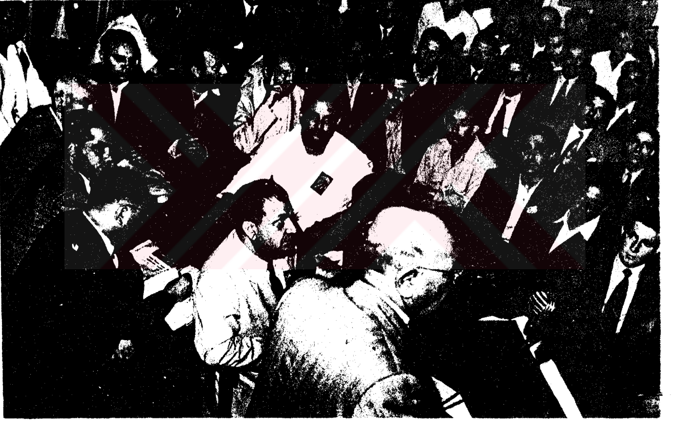
Necdet Öklem ve Şemsettin Günaltay bir C.H.P. kongresinde.