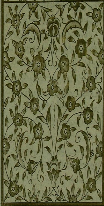
اللوحه الأخيرة من نسخة خالت أفندي

الشفاعة الغائب المأمونون • ربنا اغفر لنا ذنوبنا التي لم نذكرها باليمين واليمين في قلبنا غداً للذين آمنوا • ربنا انك رؤوف رحيم • ربنا عليك توكلنا واليك المصير • ربنا اجعلنا قسمة للذين كفروا واغفر لنا ربنا انك انت العزيز الحكيم • ربنا انم لنا نوراً واغفر لنا انك على كل شئ قدير • سبحان ربنا رب العزة عما يصفون وسلام على المرسلين والحمد لله رب العالمين • وكان تاريخ تمام في ليلة السبت العاشر ونهاية الفرج •