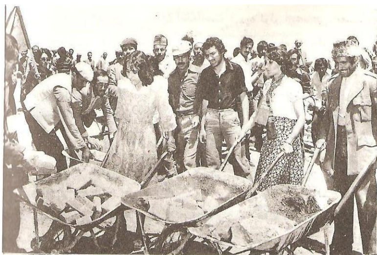
زنان در شهر کابل تاریخی با مردان یکجا در کارهای داوطلبانه سهیم بودند.