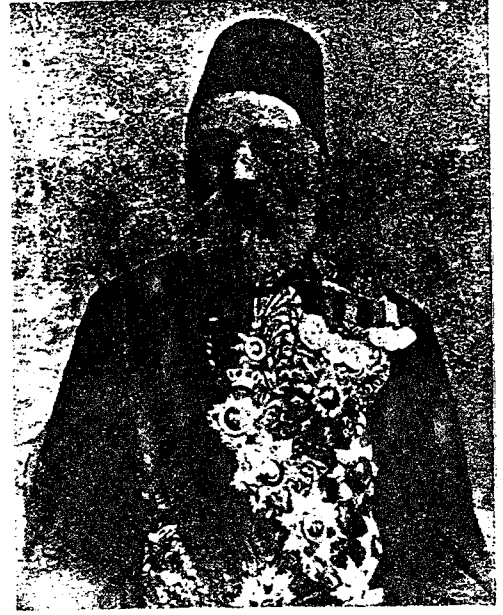
Halil Rifat Paşa