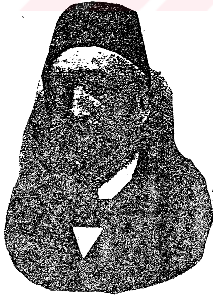
Midhat Paşa (İtalyada iken)