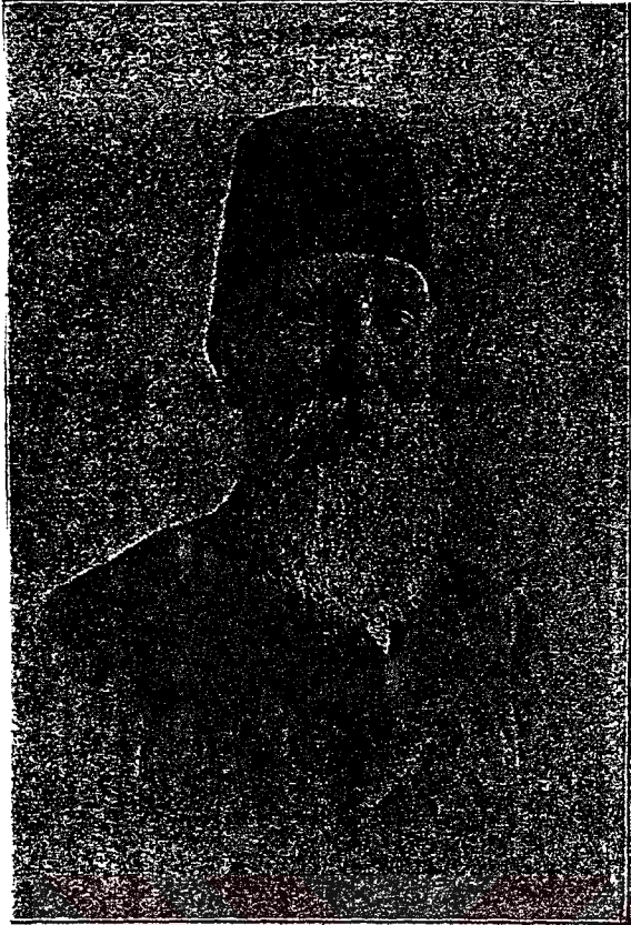
آبدۇرراھمان رىفات پاشا