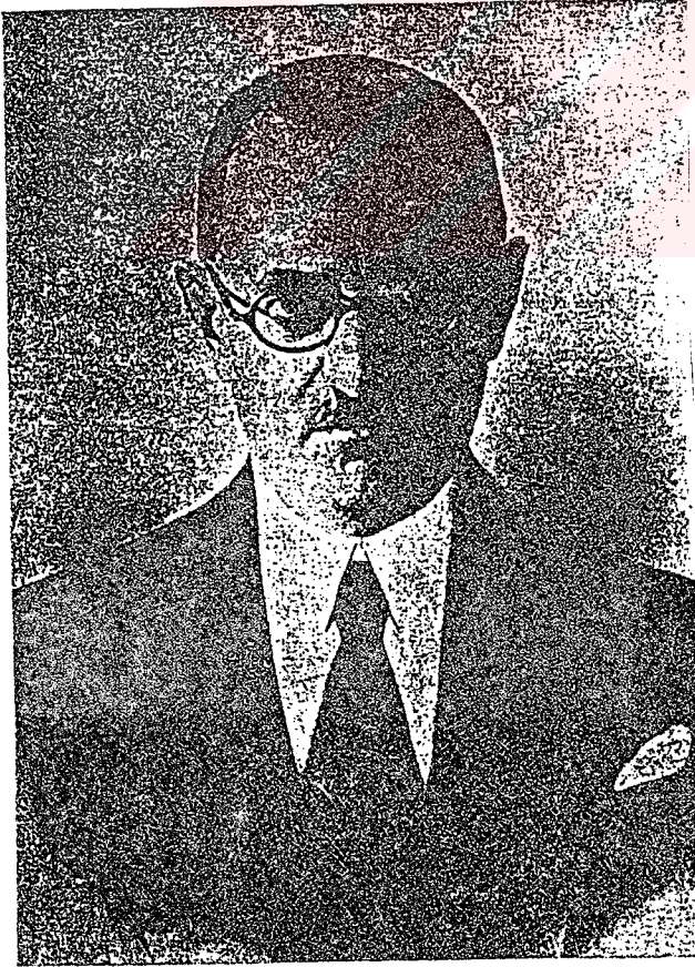
Büyük Millet Meclisi Reisi ABULHALİK RENDA