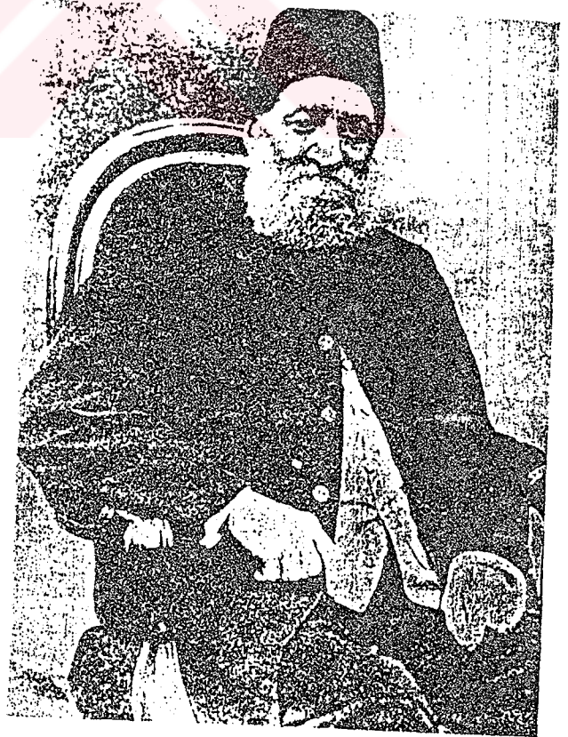
MEHMET KÂMİL PAŞA (1832 - 1919)