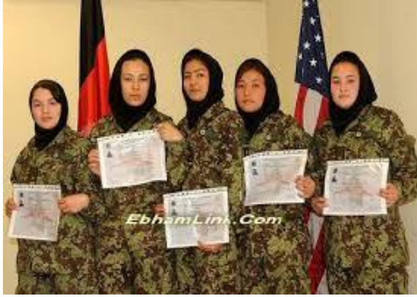
Günümüz Afganistan Bayan Ordu Mensupları