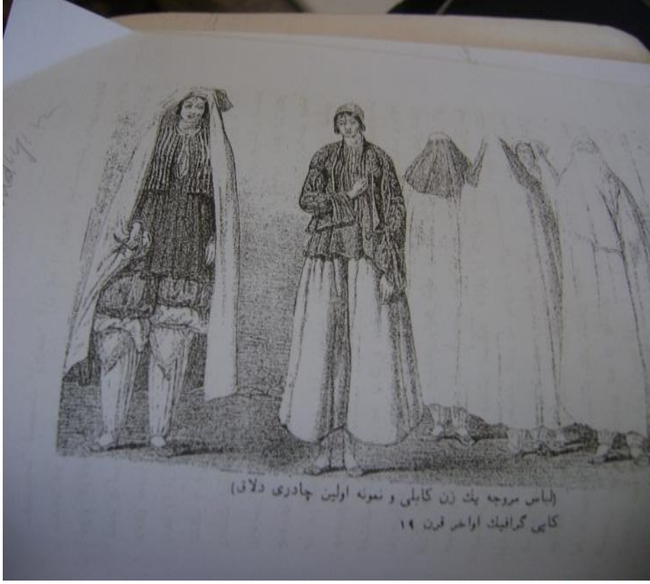
18. Yüzyılın Sonlarındaki İlk Burka Şekli