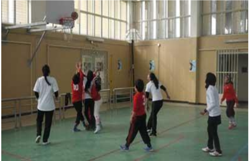
Afganistan Bayan Basketbol Takımı