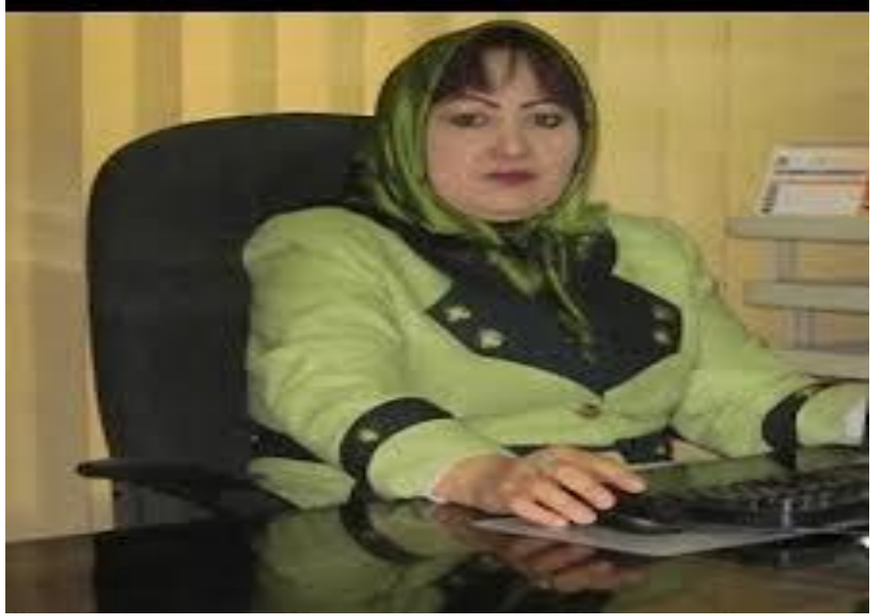
Afganistan İlk Bayan Kaymakam