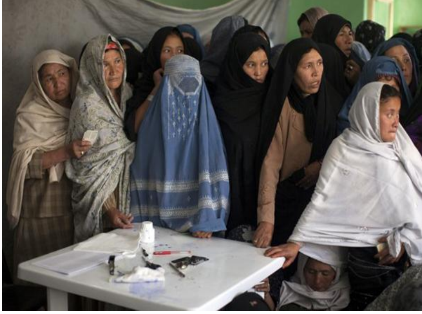
Türkiye Devleti Yardımı İçin Sıraya Giren Bayanlar