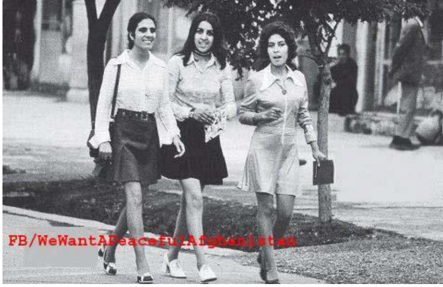
1970'lerdeki Kabil Üniversitesi Kız Öğrencileri