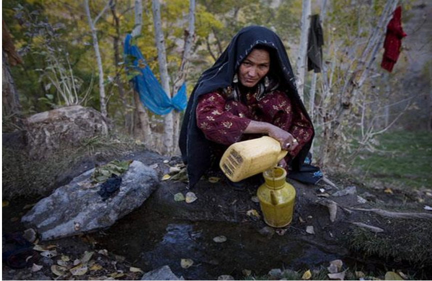
Kırsal Kesimde Su Taşımakta Olan Bir Bayan