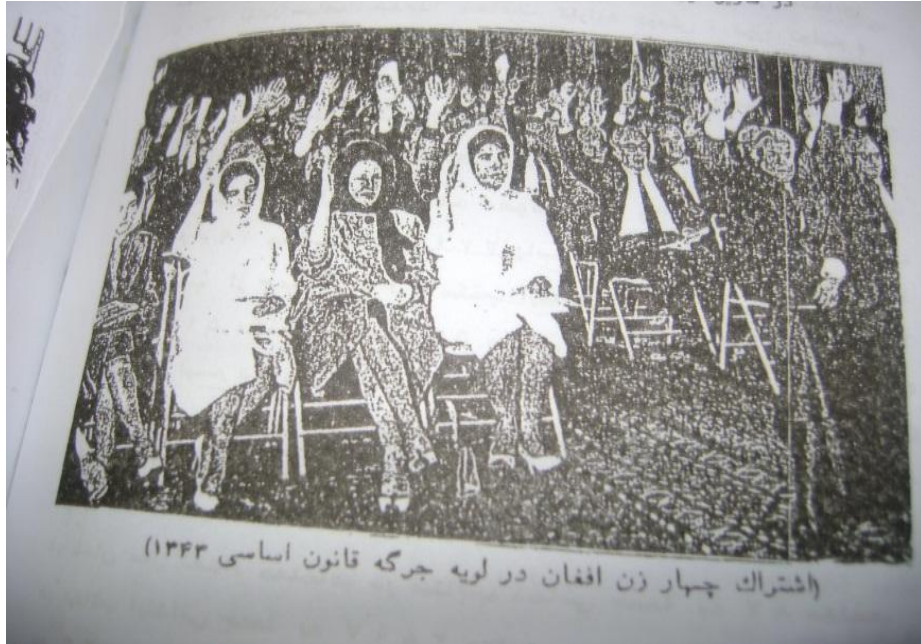
Loye Cirge (Parlamento)'ya Katılan İlk Dört Kadın (1965)