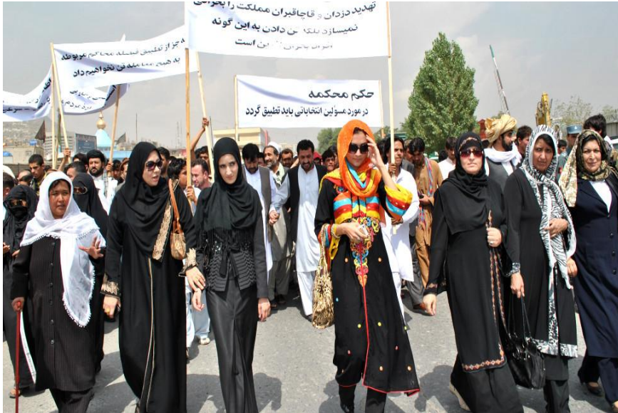
Seçimle İlgili Yapılan Yürüyüşte Bir Görüntü