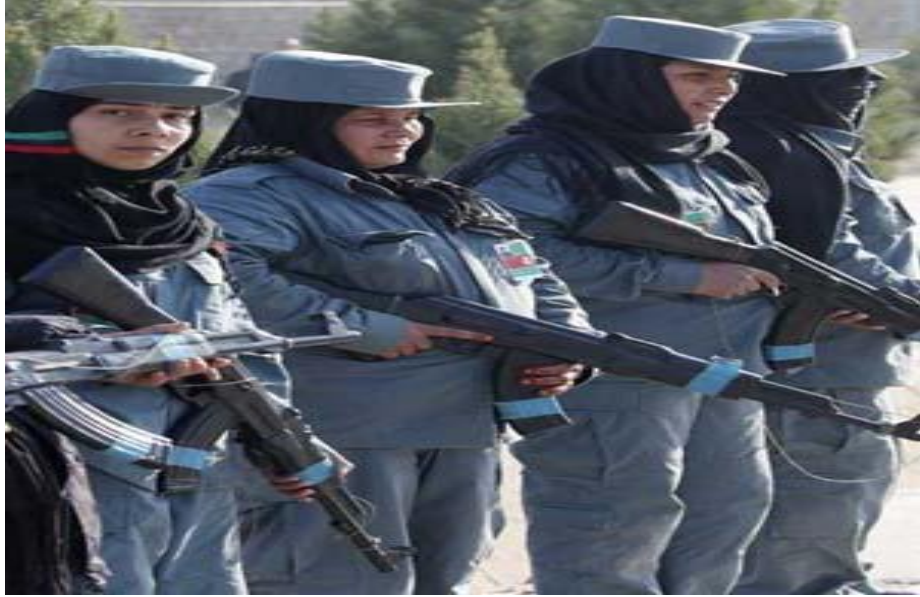
Günümüz Afganistan Bayan Polisler