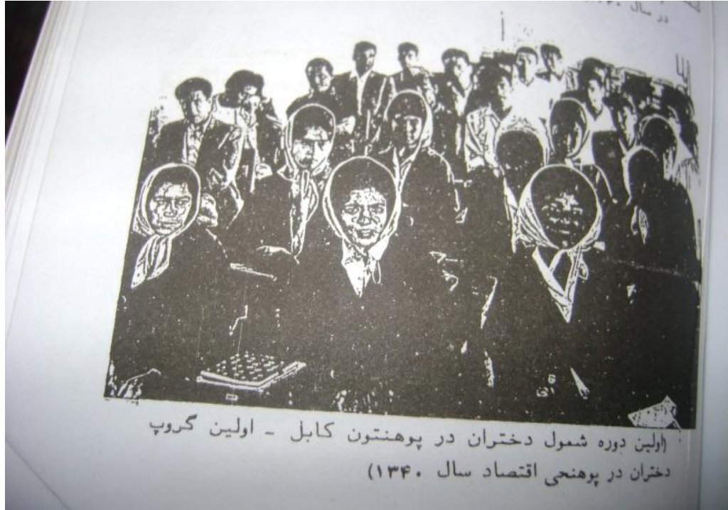
Kâbil Üniversitesi'nin İlk Kız Öğrenciler (1962)