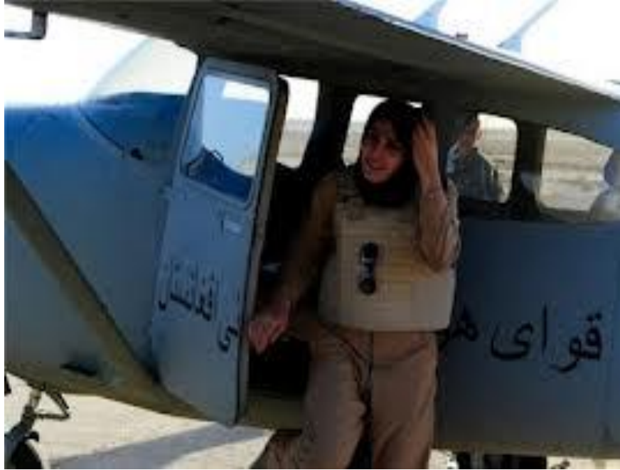
İlk Afgan Bayan Asker Pilotu