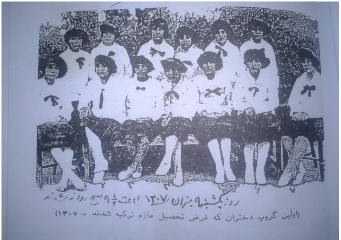
Türkiye'ye Gönderilen İlk Kız Öğrenciler (1929)