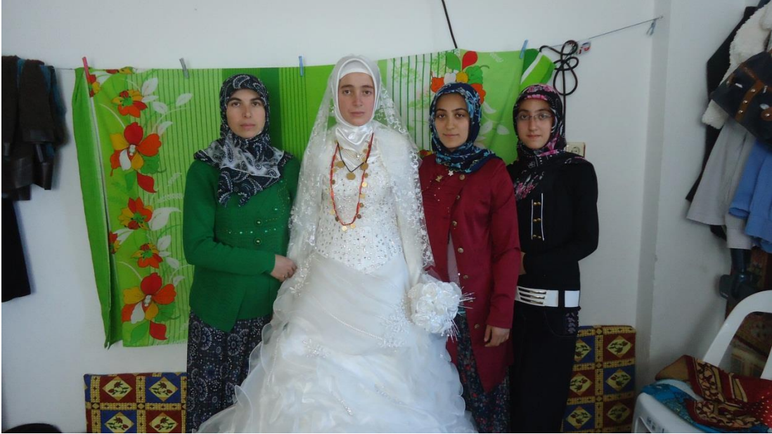
Kestel'de son altı aydır kullanılmaya başlanan gelinlik