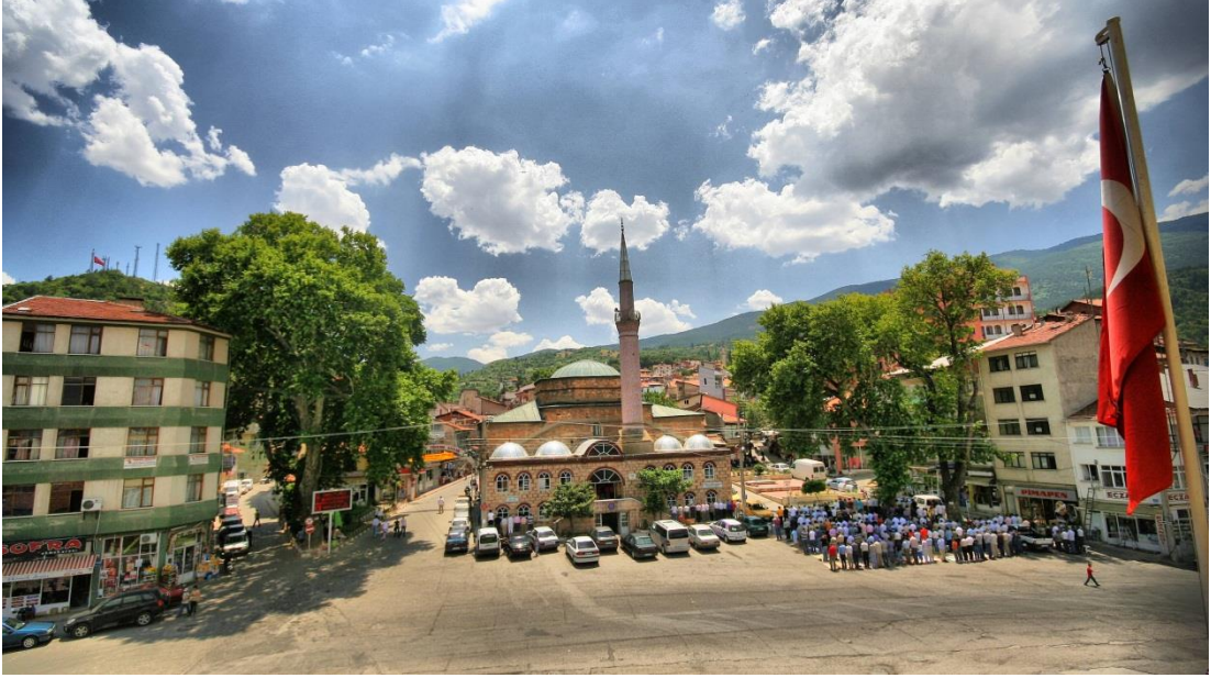
Eski Hükümet Meydanı