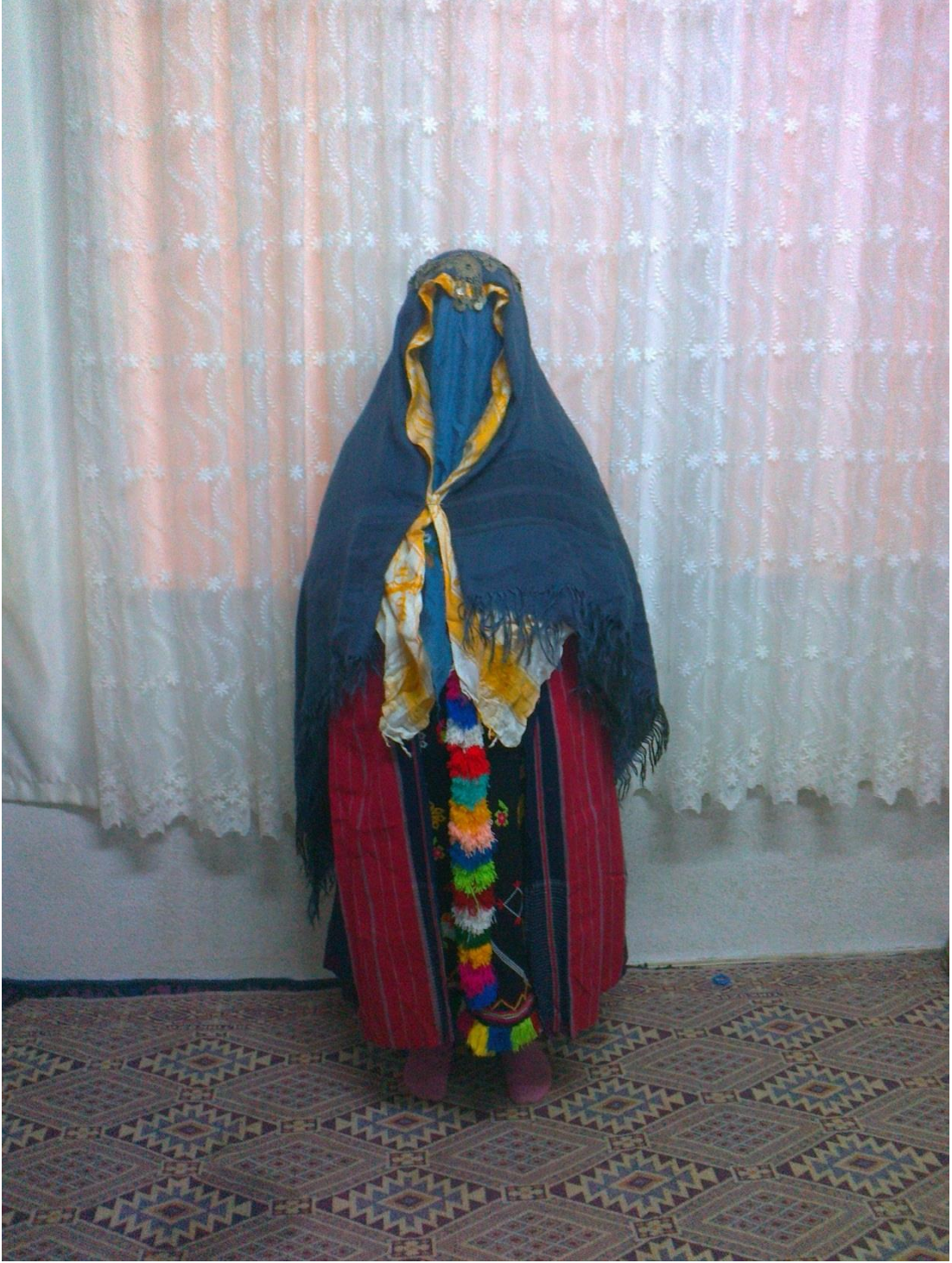
Kestel düğünlerinde bulunan dügürüş