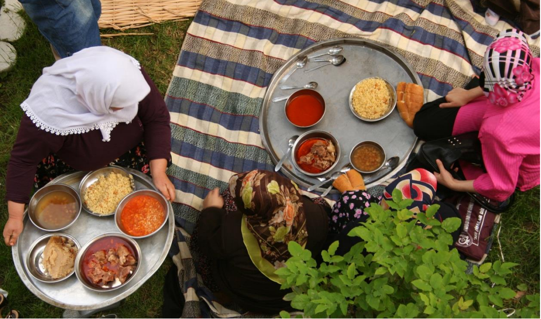
Simav'da Düğün Yemeği