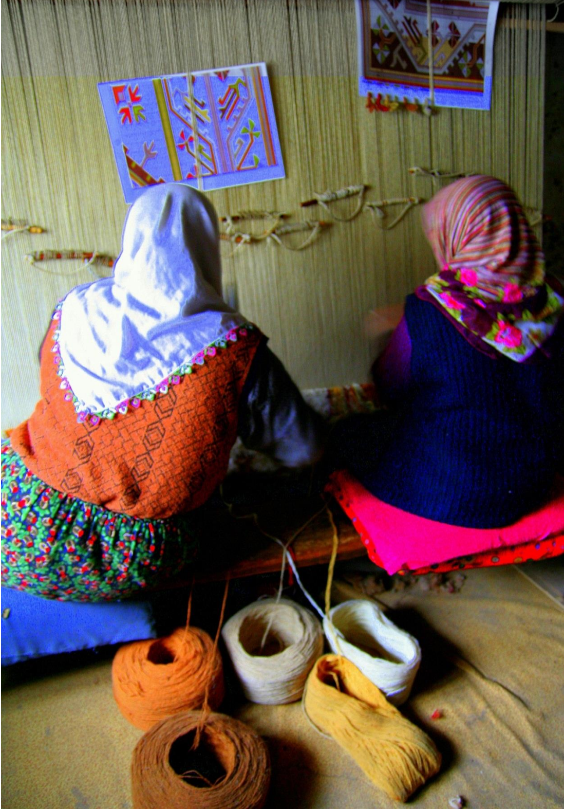
Halı Dokuyan Kadınlar