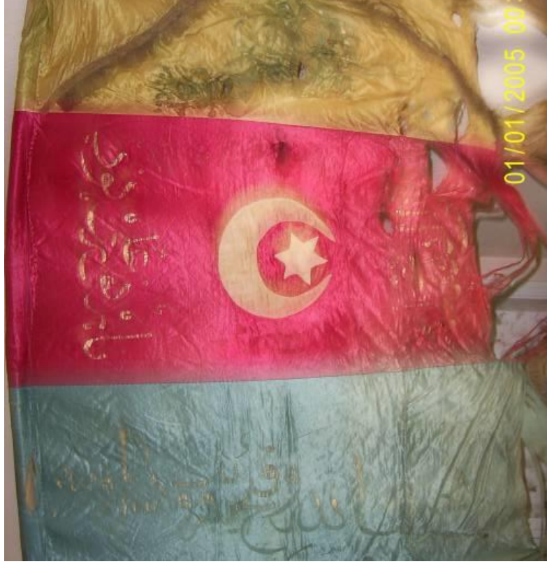
Kestel'de Bulunan Tarihi Sancak