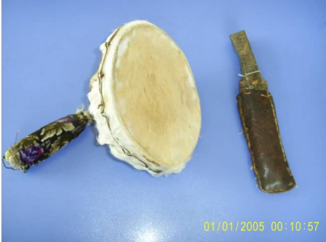
Kestel Kasabasında Bulunan Tarihi Kudüm