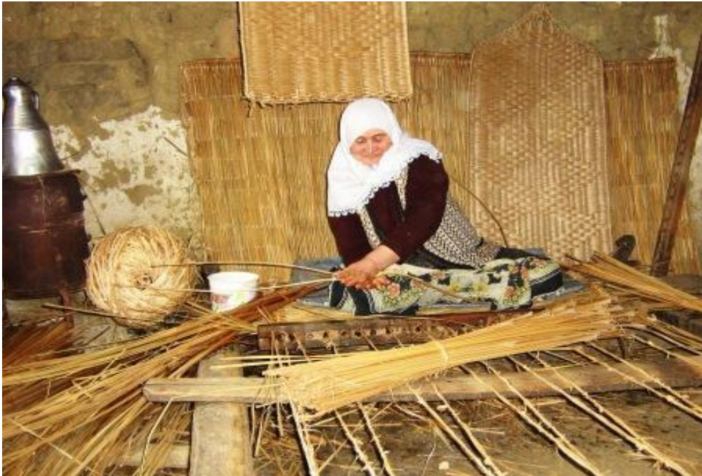
Çitgöl'de hasır yapımı