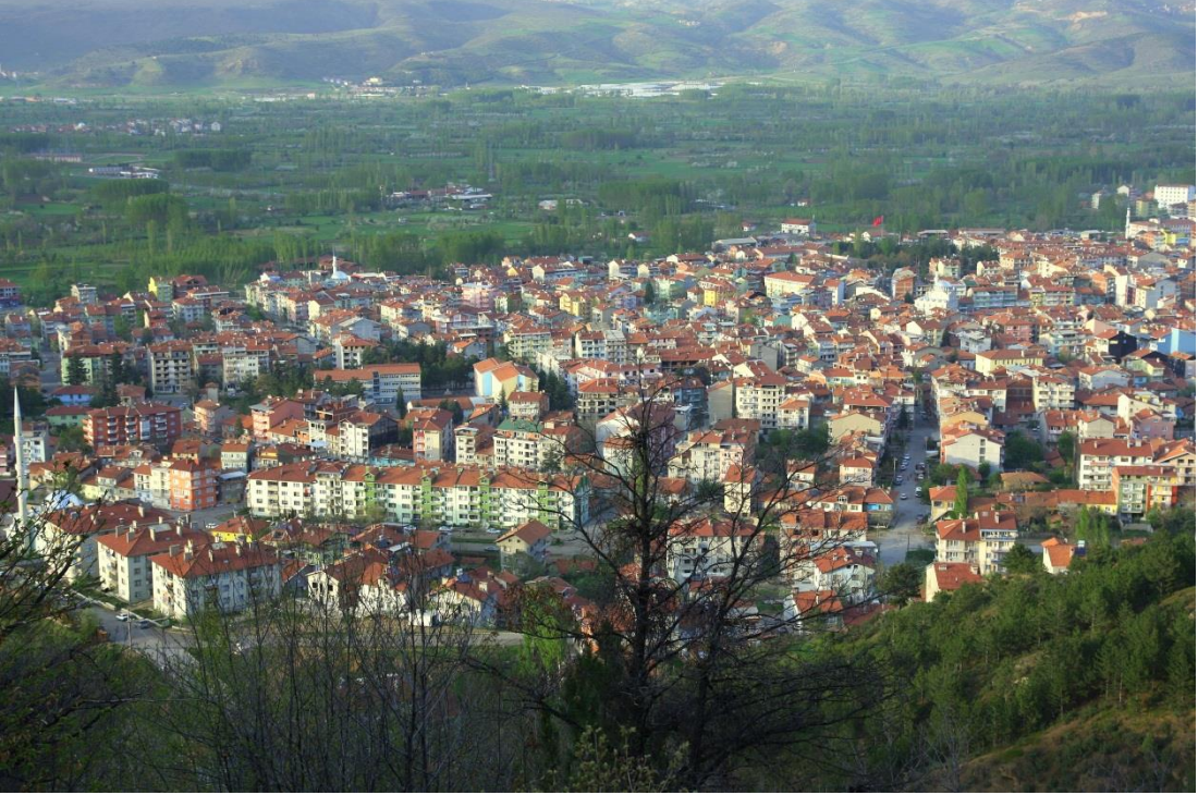
Simav İlçe Merkezi