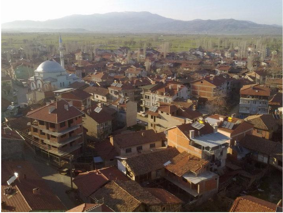
Çitgöl Kasabasından Genel Görünüm