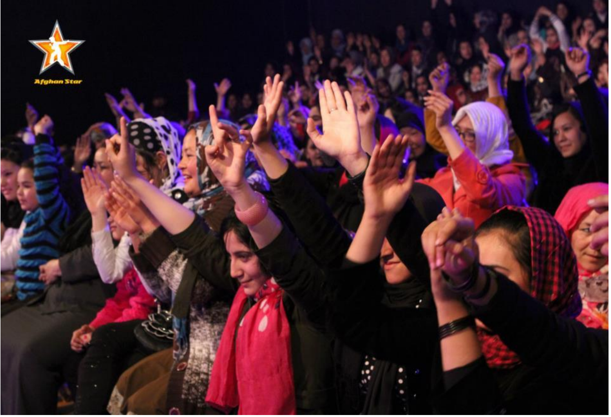
Bir televizyon programına katılan Kadınlar