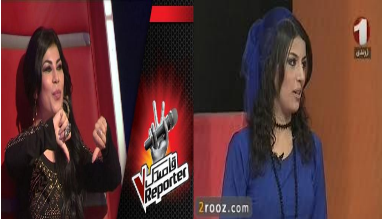
Bir şarkı yarışmasının jüri üyesi