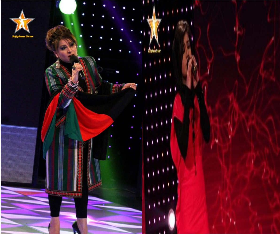
Sitare-i Afgan adlı bir şarkı yarışması