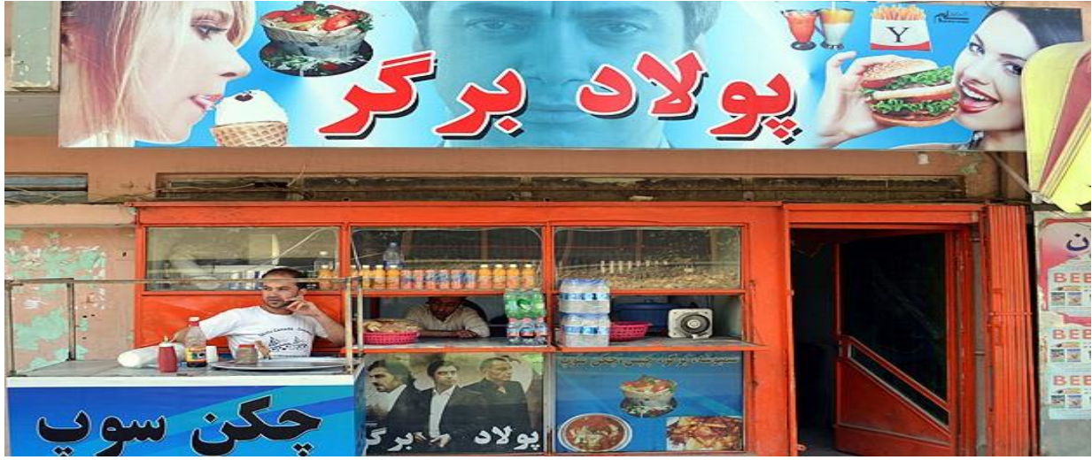
Kabilde Polad ALEMDAR adıyla bir resturant.