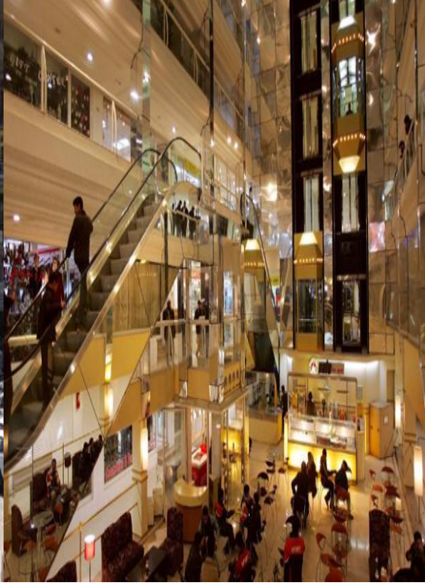
Kablde Bir alışveriş merkezi,