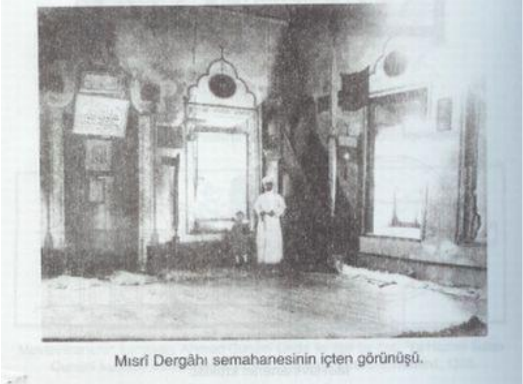
Misri Dergâhı semahanesinin içten görünüşü.