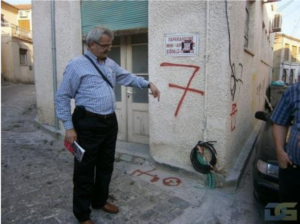
Limni'deki Mısrî Dergâhı'nın Günümüzdeki Hali