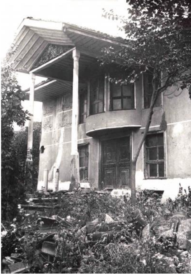
Bursa'daki Mısır Dergâhı

Mısır'nın Bursadaki dergâhının yıkılmadan önceki hâli