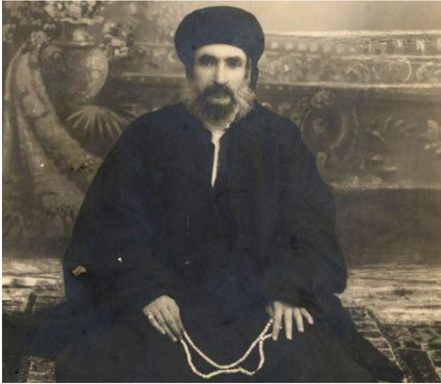
Bursa'daki Mısrî Âsitanesi'nin Son Seccadeniřini