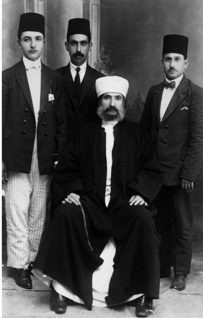
Mehmed Şemseddîn Efendi