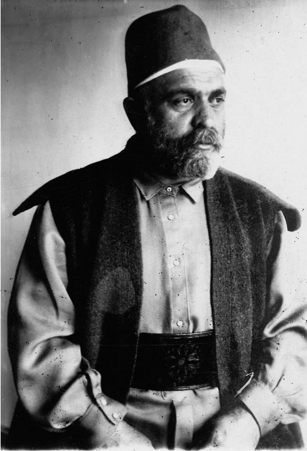
Osmanzâde Hüseyin Vassâf