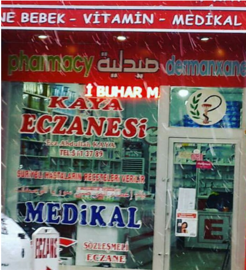
Foto 3: Viranşehir'deki İş Yerlerinde Suriyelilerle İlgili Arapça-Türkçe Yazılara Örnek