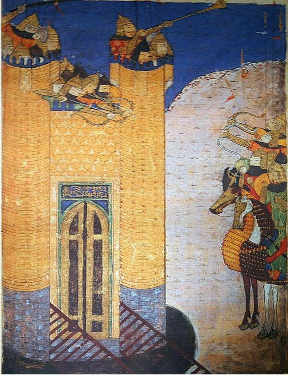
Resim 5: Alamut Kalesi'nin Moğollar tarafından kuşatılması https://ai.stanford.edu/~latombe/mountain/photo/iran-14/alamut-14.htm