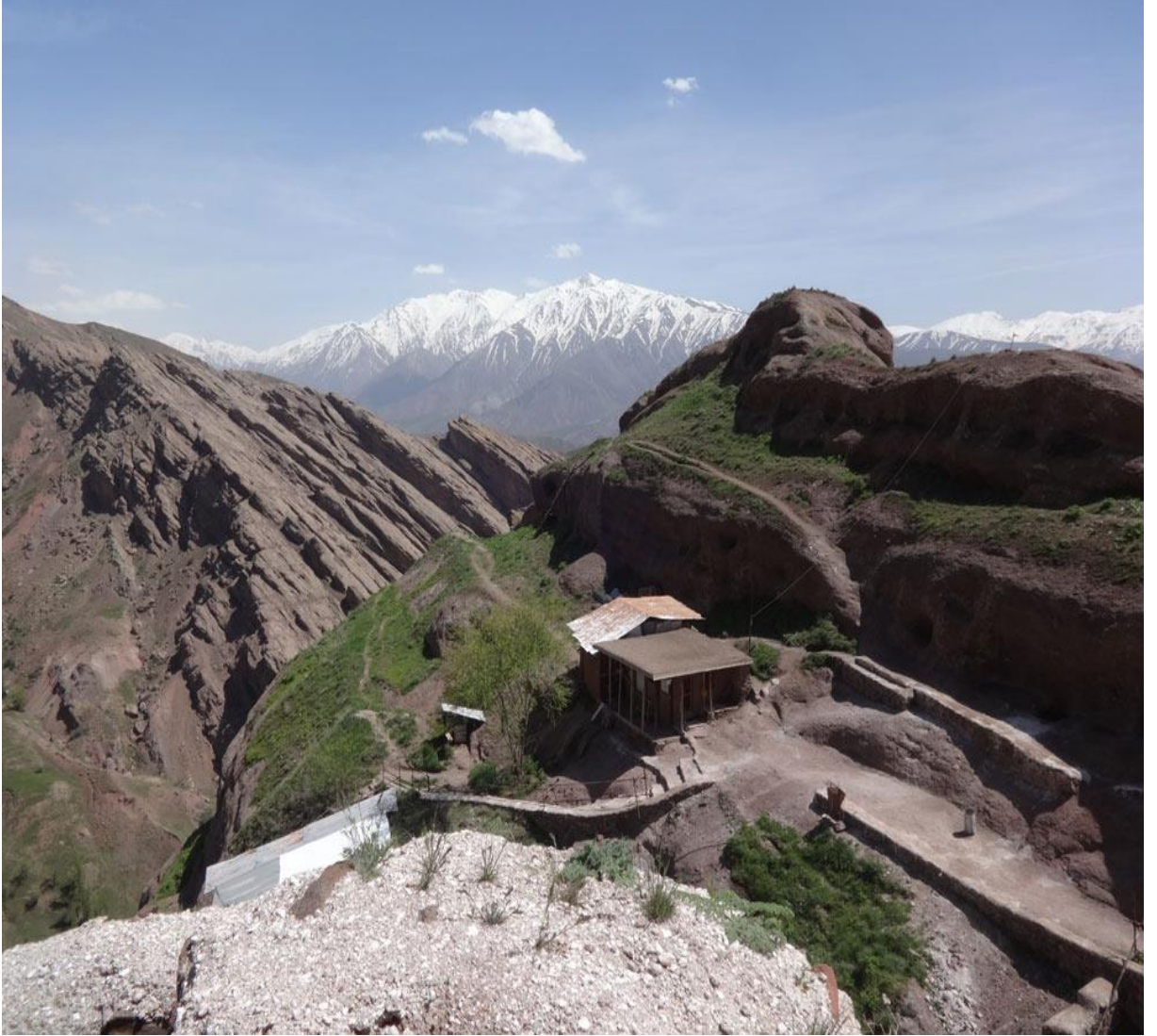
Resim 1: Alamut Civarı