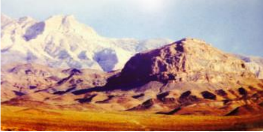
Resim 6: Girdkuh Kalesi

https://ismailimail.files.wordpress.com/2016/12/girdkuh1.jpg?w=350&h=175