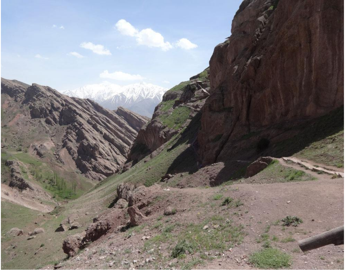
Resim 2: Alamut Kalesi'ne giden yol http://gateofalamut.com/wp-content/uploads/2016/07/DSC02502-1.jpg