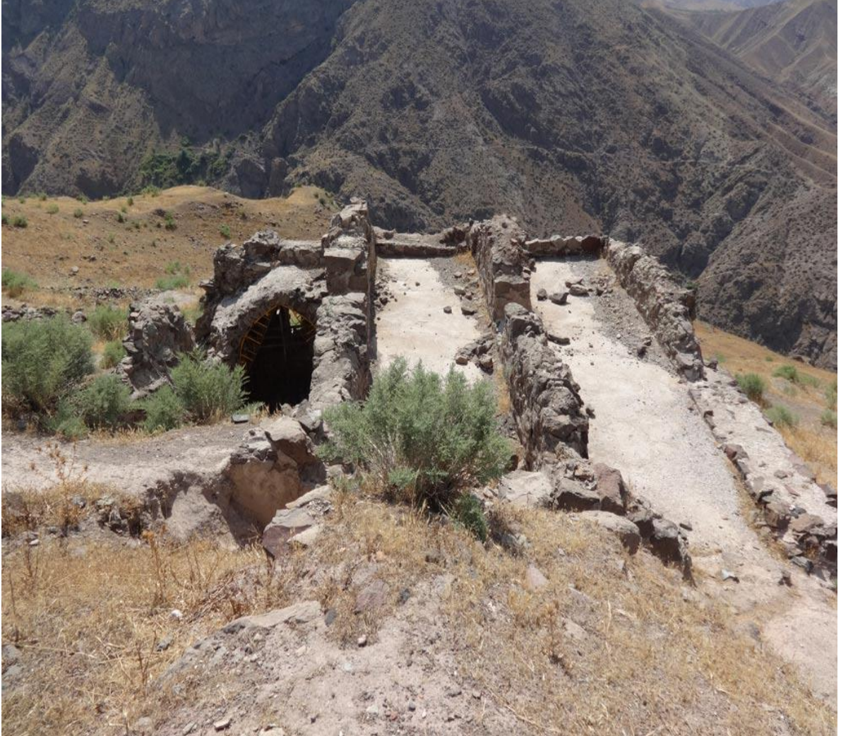
Resim 4: Lammasar Kalesi'nin kalıntıları