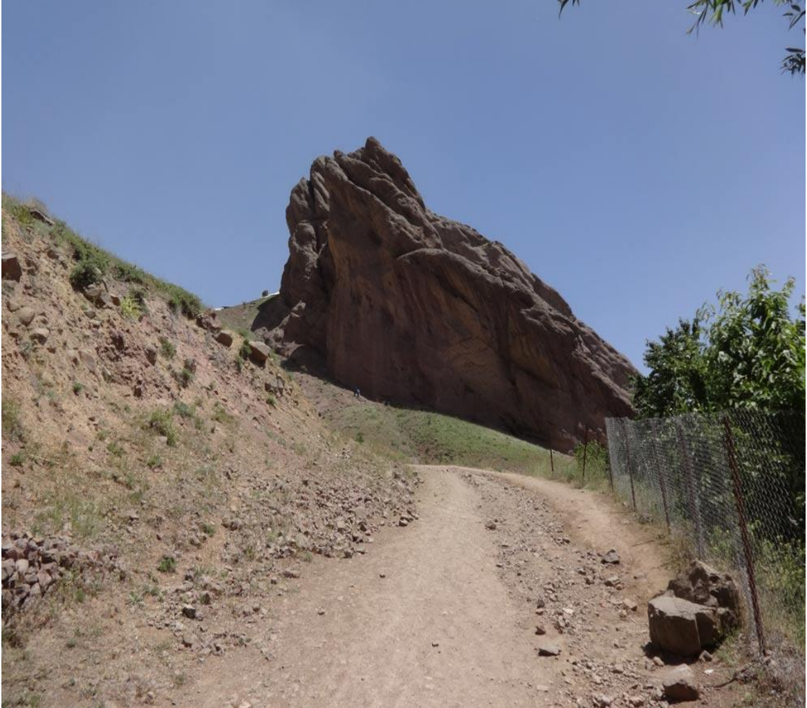
Resim 3: Alamut Kalesi

http://gateofalamut.com/wp-content/uploads/2016/07/DSC02729.jpg