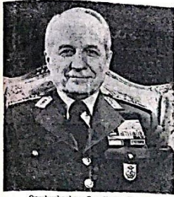
Cumhurbaşkanı Org. Kenan Evren

□ Gazetemize ulaşan sonuçlara göre Konya'da 1279 sandık açılmış ve 291.774 yurttaş Kabul, 36.750 yurttaş ise Red oyu kullanmıştır