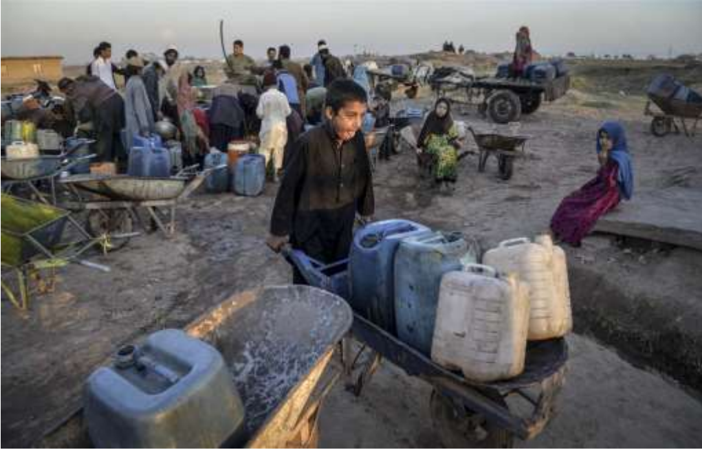
FOTO 6: 1980 yılında Afganistan Türkmenlerinin kaldığı mülteci kampın yakınında bir su dağıtım merkezinde su dağıtımı yapılırken.