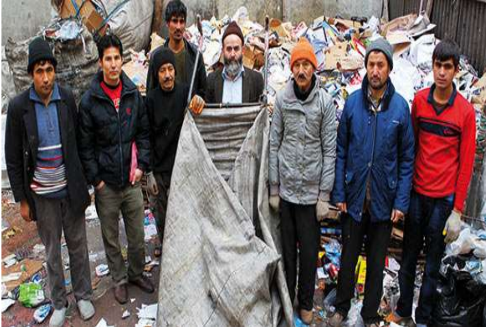
FOTO 9: 1982 yılında Türkiye'ye gelen Afganistan Türkmenleri. O zamanlar Türk vatandaşı olmadıkları için başka işlerde çalışamayıp geçimlerini kâğıt toplayarak sağlayan Türkmenler