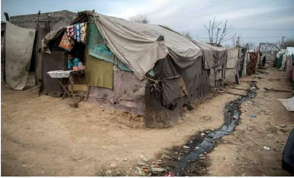
FOTO 5: 1979 yılında Rus işgalinden ve çatışmalardan kaçan Afganistan Türkmenlerinin Pakistan 'da yaşadıkları bir mülteci kampı.