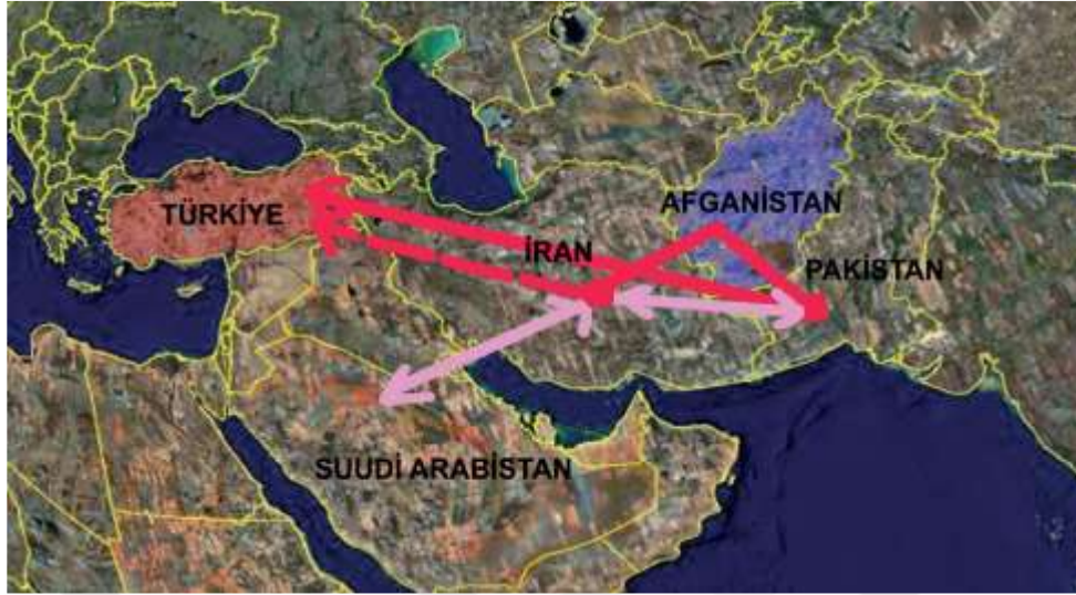
Afganistan'dan Türkiye'ye göç yolları

Afganistan Türkmenlerinin Türkiye ile olan soydaşlık bağı ve karşılıklı yardımlaşmaları 1979 yılı Rusların Afganistan'a saldırması ve Türkmenlerin Türkiye'ye sığınmasıyla gündeme gelen bir durum değildir. Türkmenlerin Anadolu'ya olan kardeşlik hissiyatı 1913'ü yıllarda günümüz Türkmenistan'ını Mari şehrinde Atatürk'ü destekleme komitesini kurarak Anadolu'ya yardımlar göndermesiyle başlamıştır. 89