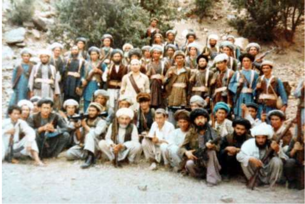
FOTO 4: 1979 yılında Sovyetlerin Afganistan'ı işgali sonrası Ruslara karşı cihat eden Trkmen mcahitler.