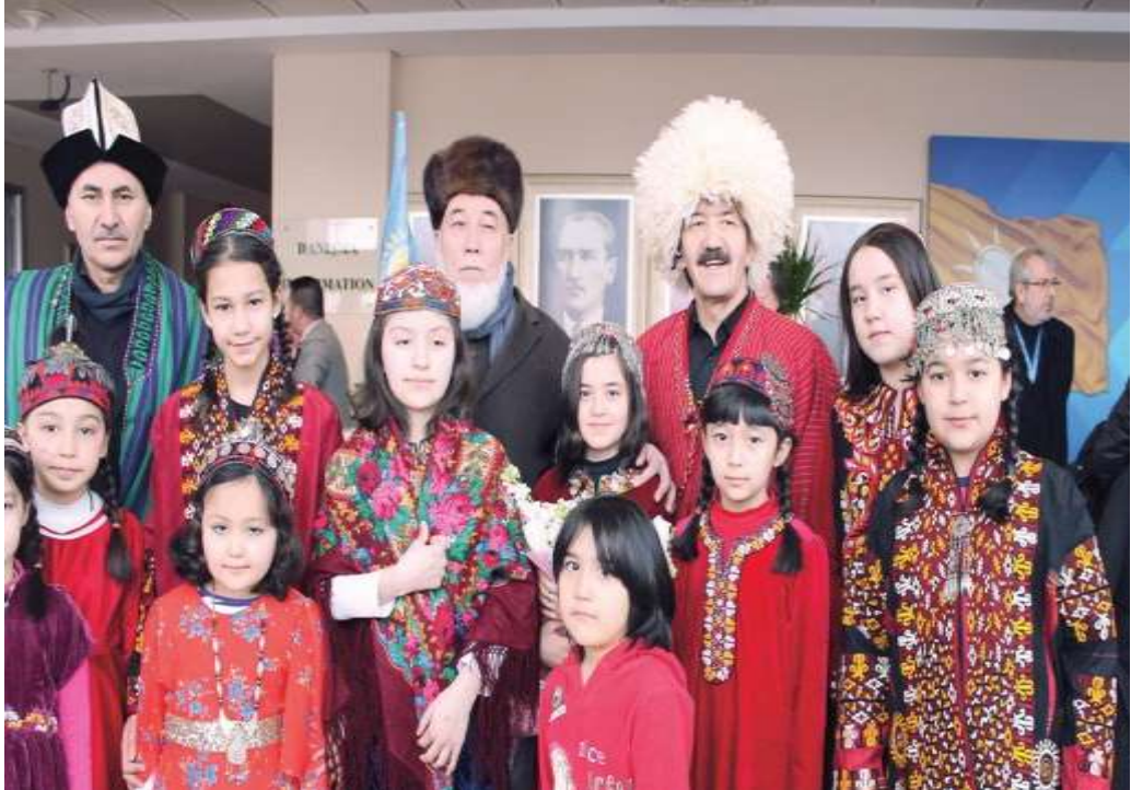
FOTO 11: Afganistan'dan Türkiye'ye gelip İstanbul Zeytinburnu'na yerleşen Türkmenlerin kültür tanıtımından bir resim.