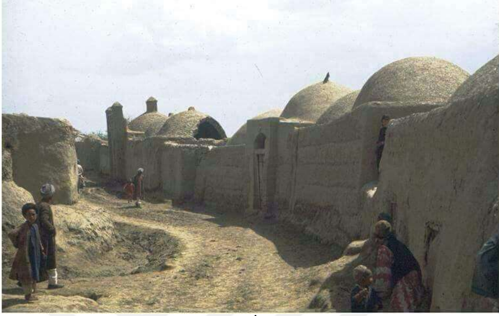
FOTO 3: Kuzey Afganistan'ın Faryab İline baęlı Trkmenistan sınırına yakın blgede yer alan bir Trkmen Ky.