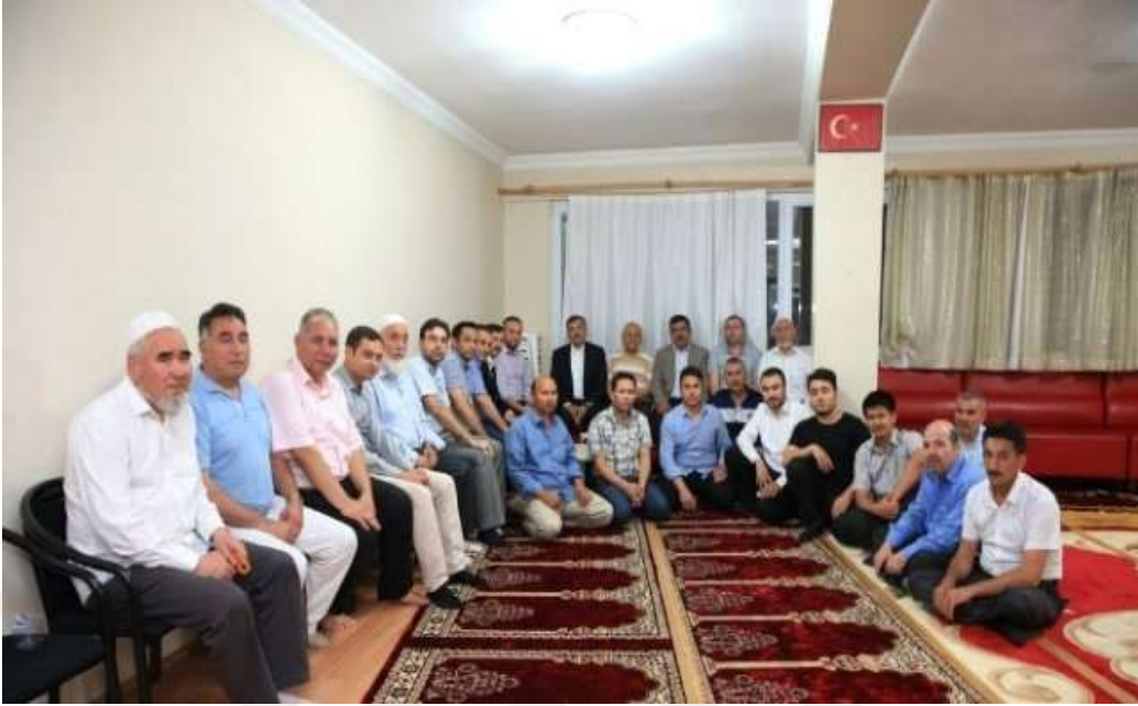
FOTO 10: Afgan Türkmenlerinin Türkiye'ye yerleştikten sonra burada resmi makamlara işlerini resmi yollarla daha kolay yapabilmeleri için kurdukları: Afganistan Türkmenleri Sosyal Yardımlaşma ve Dayanışma Derneği, danışma toplantısı. İstanbul Zeytinburnu.