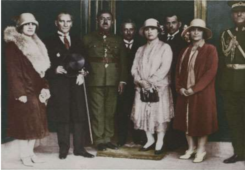
Foto 1: 1921 yılında Türk-Afgan dostluk antlaşması imzalandıktan sonra 24.05. 1928 Tarihinde Afgan kralı Şah Amanullah Han'ın Mustafa Kemal Atatürk'ü ziyareti.