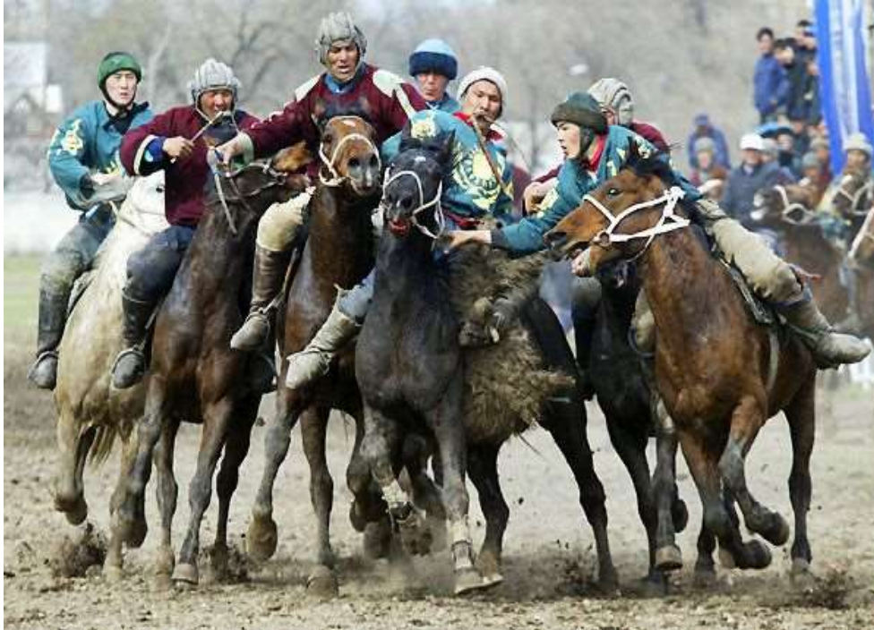
FOTO 2: Kuzey Afganistan Türklerinin geleneksel olarak kış mevsiminde oynadıkları oğlak adında bir spor türü.