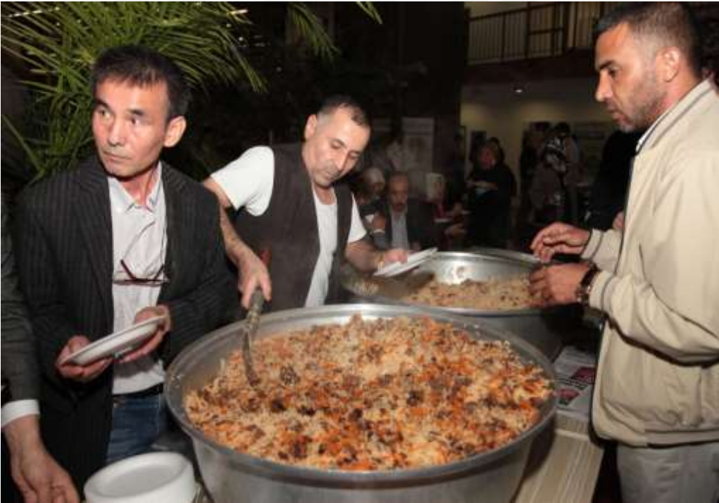
FOTO 13: Afganistan Türkmenlerinin düğün, sadaka, hayrat gibi özel günlerde yaptıkları yöresel yemekleri Türkmen Pilavı.