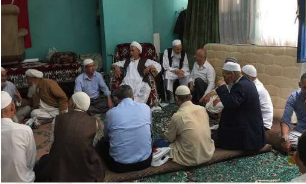
FOTO 12: Türkiye’de yaşayan Afganistan Türkmenlerinin düğün münasebetiyle bir araya geldikleri bir toplantı.