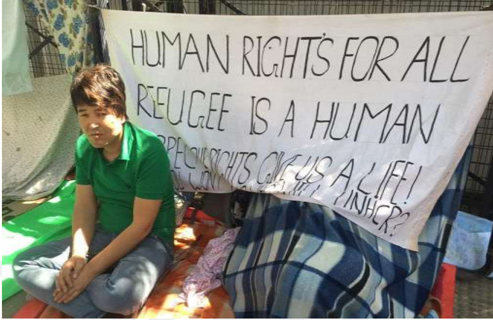
FOTO 7: Pakistan'da mültecilerden sorumlu görevlilerin mülteci kamplarındaki ayrımcılık tutumuna isyan eden bir Afganistan vatandaşı.