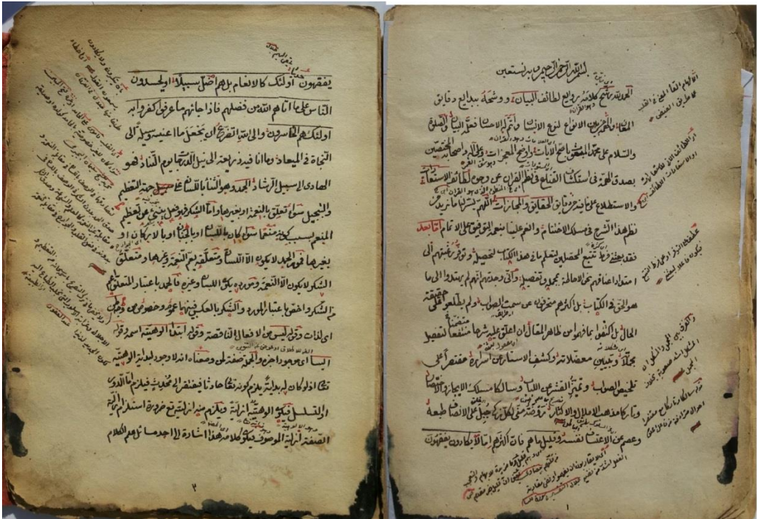
Ek 3: Zeyârî nüs. vr. 1B-2A