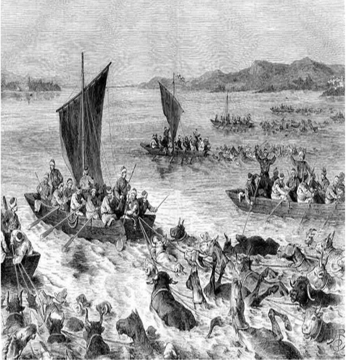
Ek 4: 93 Harbi sırasında Tuna Nehri'nde Osmanlı askerleri (1877), (Mustafa Öztürk, "93 Harbi'nde Rus Gazeteciler ve Faaliyetleri" SDÜ Fen Edebiyat Fakültesi Sosyal Bilimler Dergisi , S. 27, Isparta 2012, s. 35.)