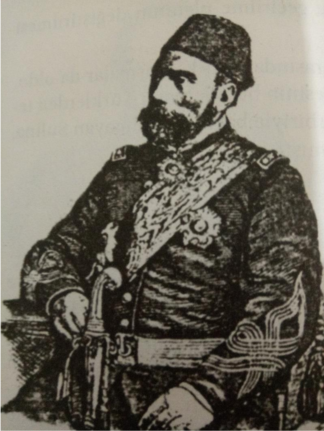
Ek 6: Plevne Kahramanı Gazi Osman Paşa (A.B. Şirokorad, Osmanlı-Rus Savaşları, Selenge Yayınları, İstanbul 2009, s. 422.)