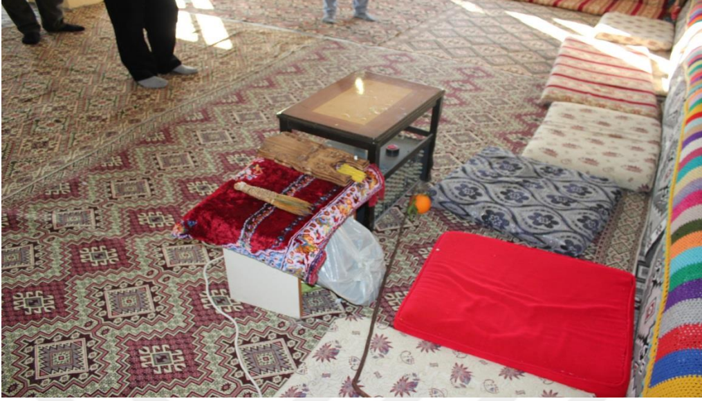
FOTOĞRAF-20 ALİ ULVİ KURUCU MAHALLESİNDE BULUNAN CEM EVİ VE CEM SİMGELERİNDEN BİR GÖRÜNTÜ