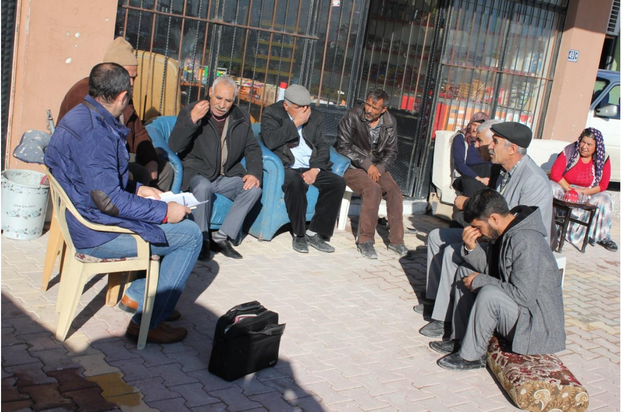
FOTOĞRAF-21 ALİ ULVİ KURUCU MAHALLESİNDE BULUNAN ABDALLAR VE DEDELERLE GÖRÜŞME