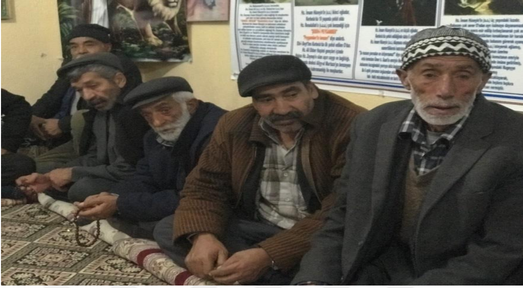
FOTOĞRAF-18 ALİ ULVİ KURUCU MAHALLESİNDE YAPILAN CEMDE ABDAL İHTİYARLARI