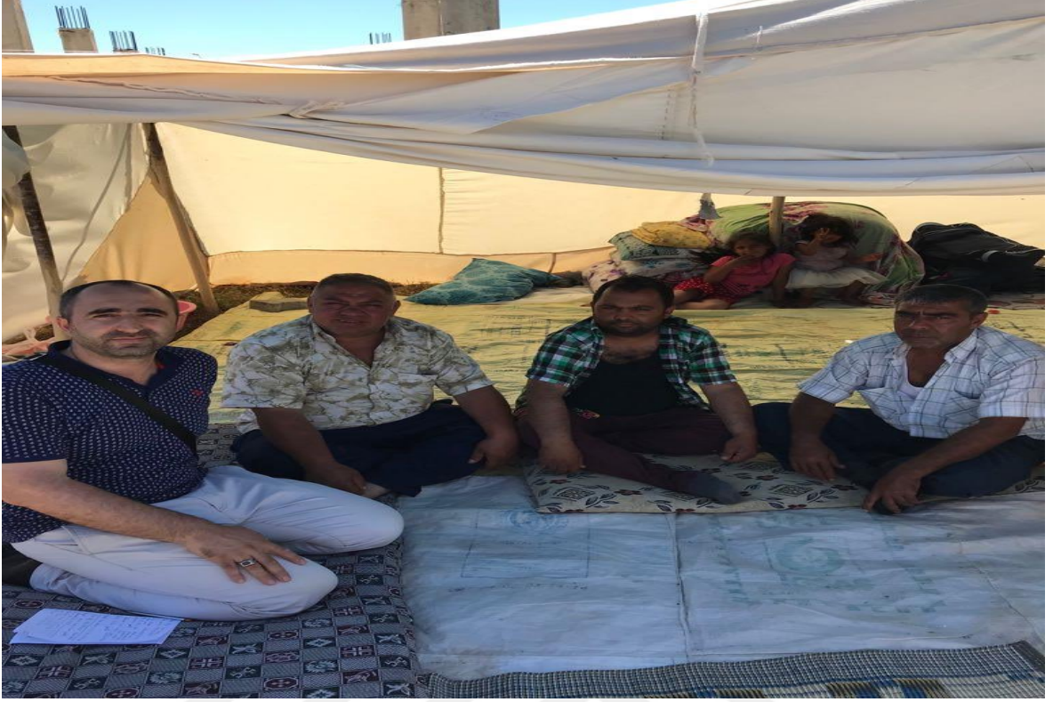
FOTOĞRAF-10 ANTALYA ELMALI TEKKE KÖYÜ ABDAL MUSA ANMA TÖRENLERİNE KATILAN KONYA ABDALLARI