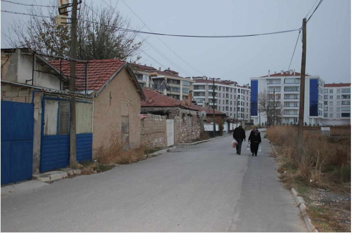
FOTOĞRAF-1 YENİMAHALLE'DE ABDALLARIN YAŞADIĞI MEKANLAR-KENTSEL DÖNÜŞÜM (YOLUN SONU)

Fotoğraflarla Konya Abdalları, Yaşam Alanları ve Ziyaretleri 147