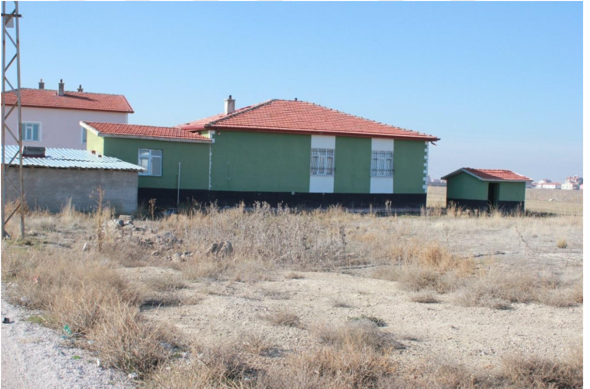
FOTOĞRAF-23 ALİ ULVİ KURUCU MAHALLESİNDE BULUNAN CEME Vİ DİŞARDAN GÖRÜNÜŞ