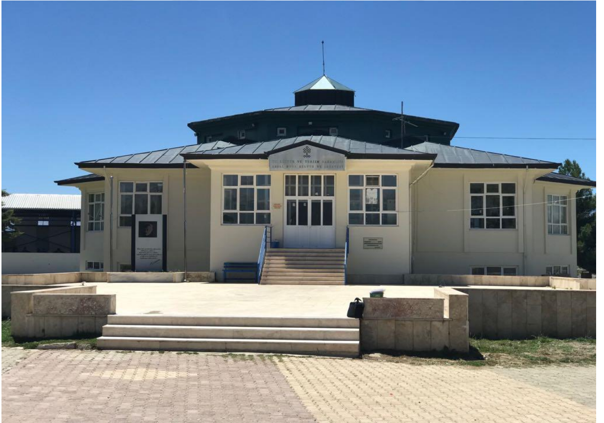
ANTALYA ELMALI TEKKE KÖYÜ ABDAL MUSA DERGAHI YAKININDAKİ CEMEVİ