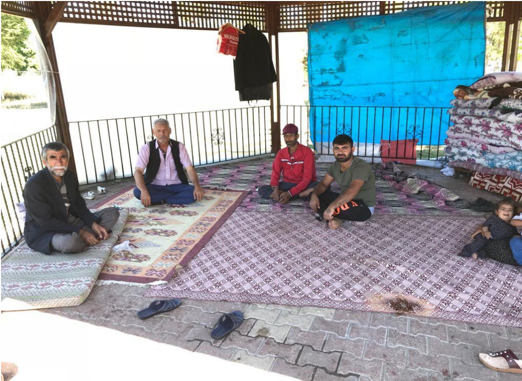
FOTOĞRAF-11 ANTALYA ELMALI TEKKE KÖYÜ ABDAL MUSA ANMA TÖRENLERİNE KATILAN KONYA ABDALLARI