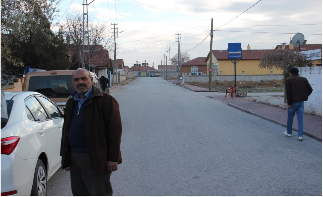
FOTOĞRAF-4 YENİMAHALLE'DEN TATLILAK MAHALLESİNE TAŞINAN ABDALLARIN YAŞADIĞI EVLER