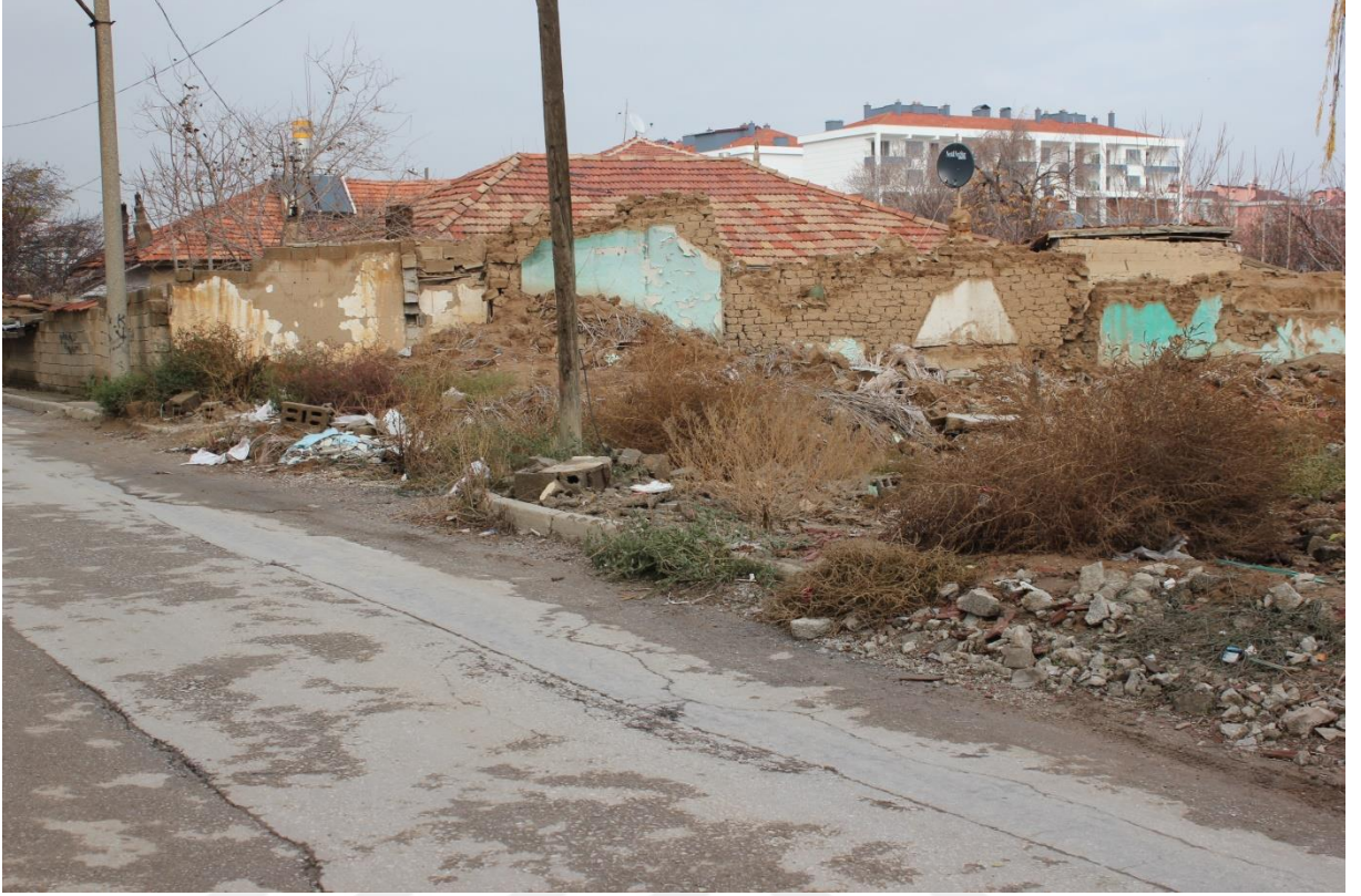
FOTOĞRAF-2 YENİMAHALLE'DE ABDALLARIN YAŞADIĞI MEKANLAR-KENTSEL DÖNÜŞÜM