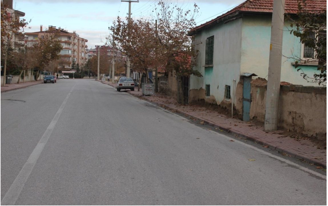
FOTOĞRAF-3 YENİMAHALLE'DE ABDALLARIN YAŞADIĞI MEKANLAR -KENTSEL DÖNÜŞÜM